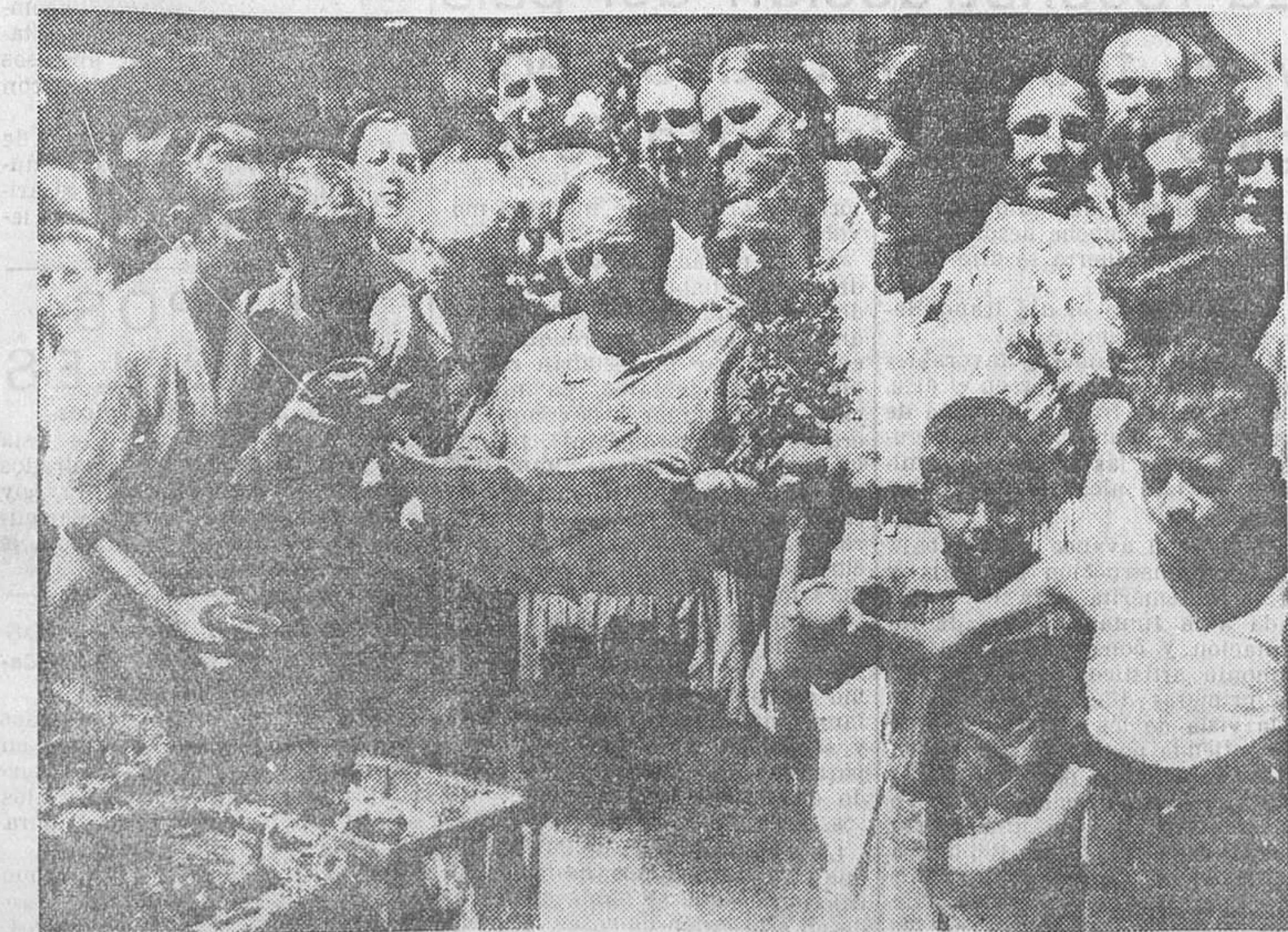
LA REBAJA DE ALQUILERES.—La «Gaceta» ha llegado a los mercados. Una incontenible alegría inunda a las lectoras de este periódico oficial