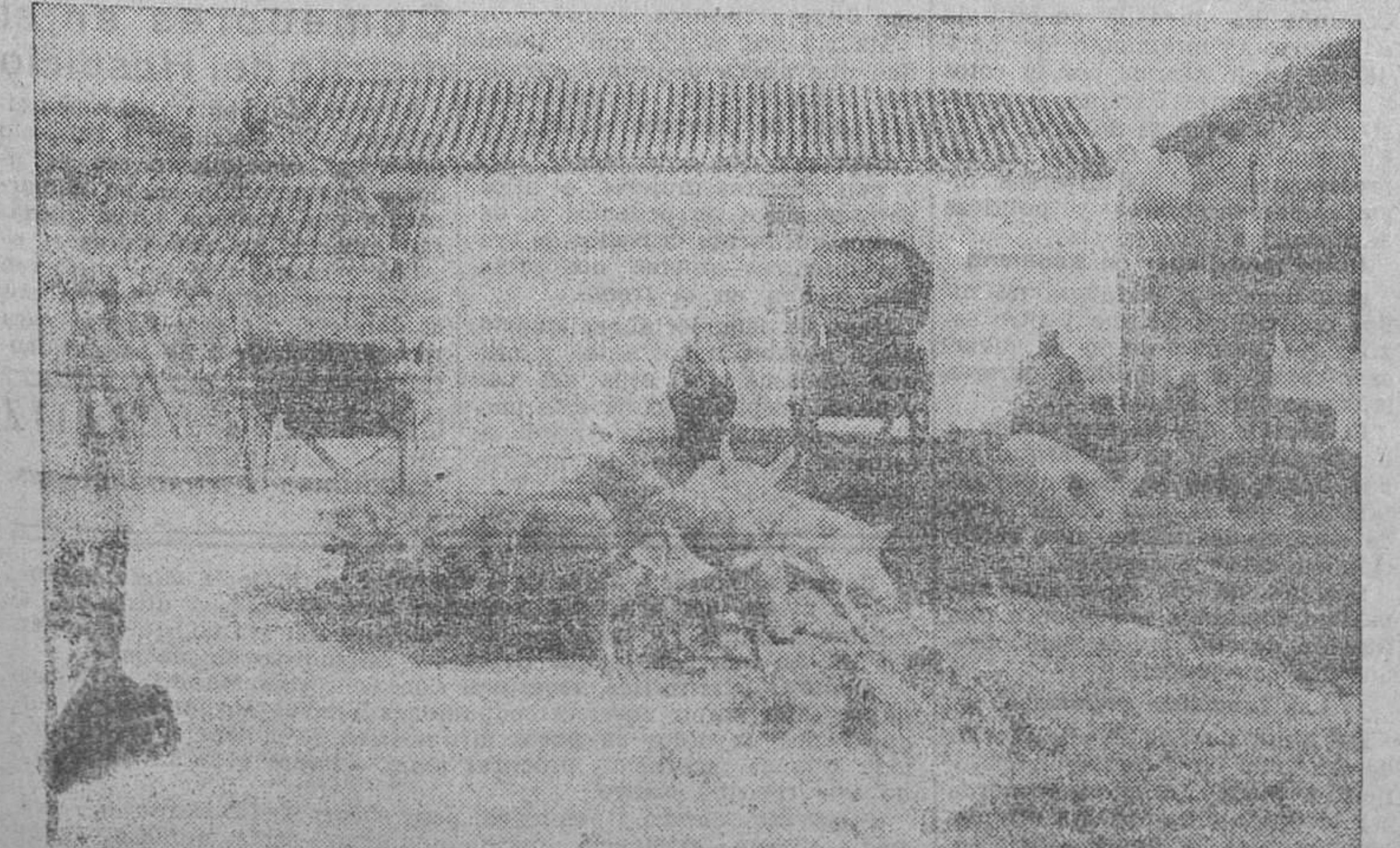
¡Buen botín! Vean los lectores, ¡cuantos solamente, estos magníficos rebeldes, cogidos por nuestras bravas milicias en uno de los sectores del Centro