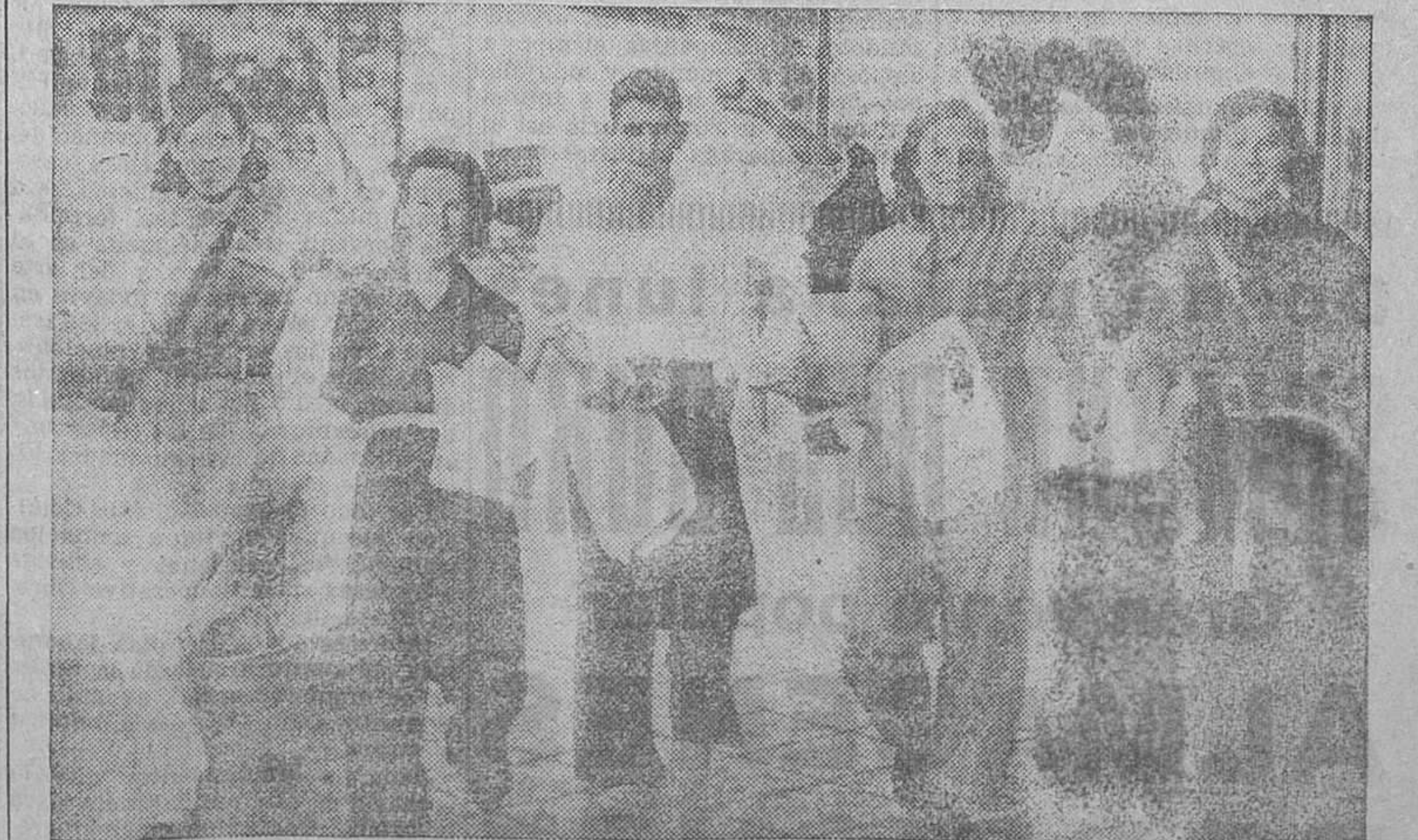
También se gana la guerra con la propaganda. Así, este grupo de muchachas corre por las calles realizando una labor muy eficaz: la de fijar en las fachadas carteles antifascistas que han de unir a los combatientes en un deseo común; el de vencer al enemigo

Barcelona, 24.—Como prólogo del mitin de mañana en la plaza de toros Monumental, que ha de sellar el pacto concertado por la C. N. T., la F. A. I., la U. G. T. y el partido socialista unificado