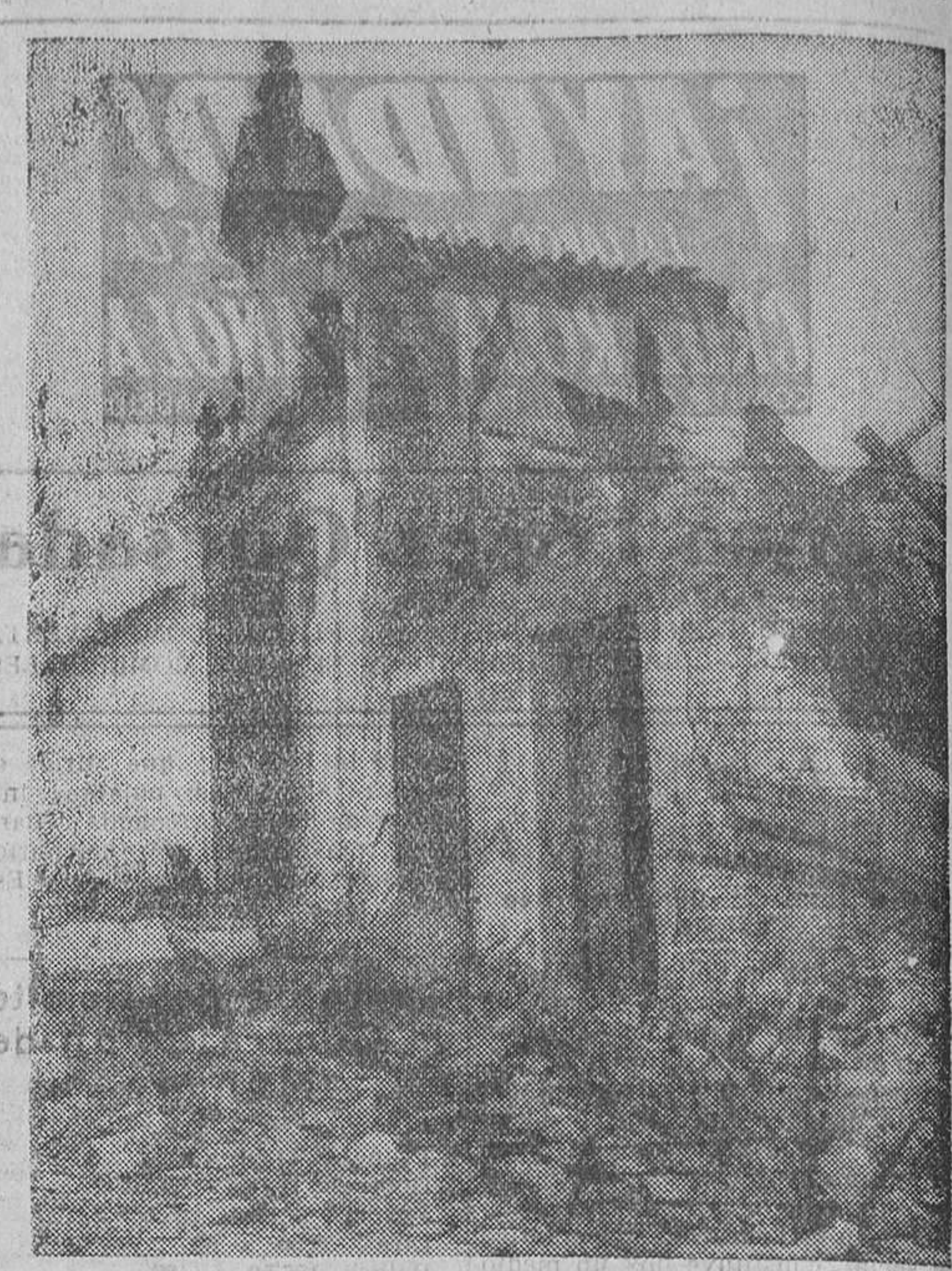
EN EL FRENT DE TERUEL.—Las bombas de los aviones facciosos acaban de destruir esta casa. No obstante, el miliciano, tranquilo y sentado en su silla, presta servicio a la puerta de este edificio

La agitación que por todos los medios pone en práctica el partido comunista está teniendo re-