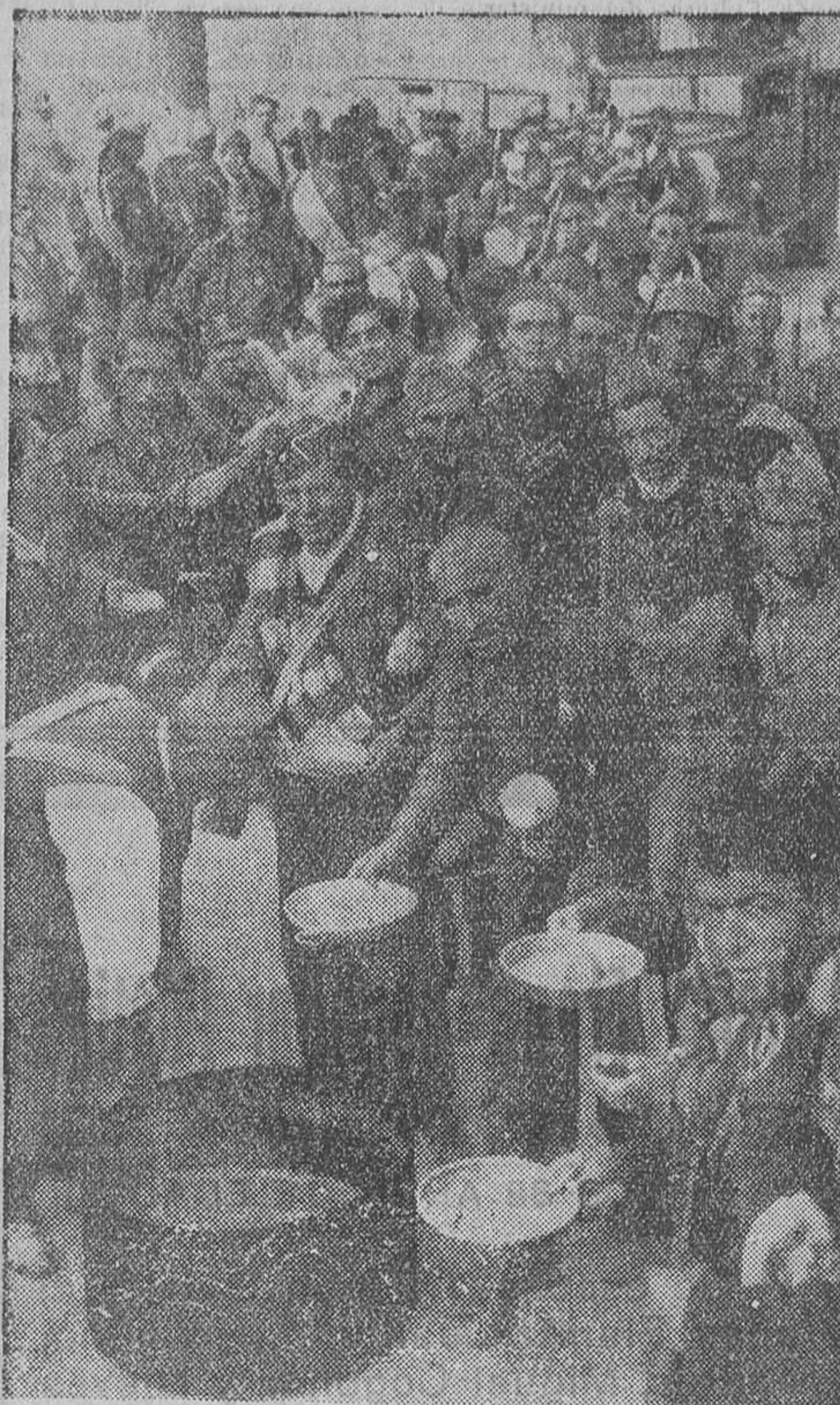
EN EL SECTOR CENTRO.—La hora del rancho del relevo de los soldados que bajan de las avanzadillas