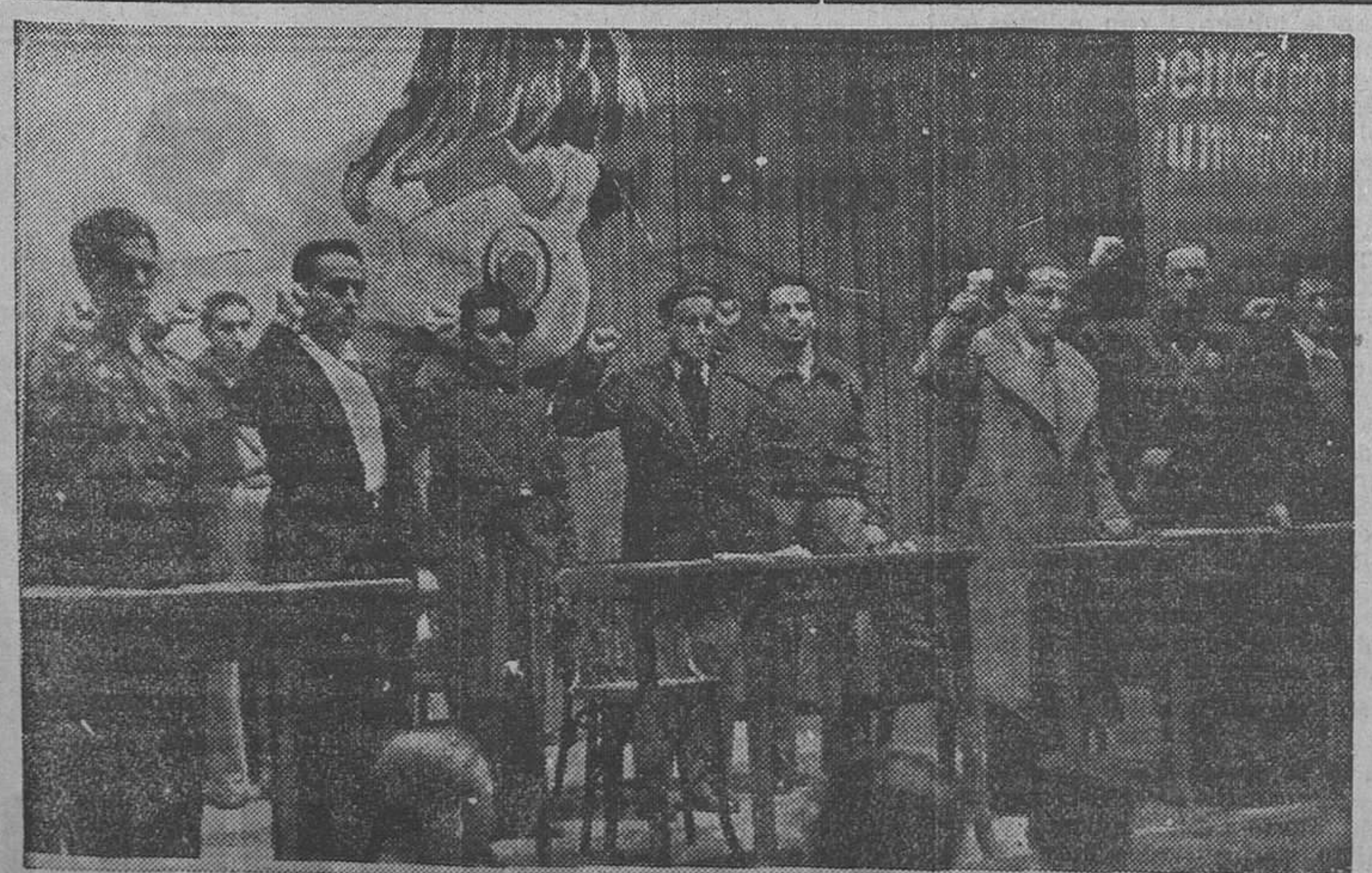
Los oradores que tomaron parte en el mitin del Comité provincial del partido comunista, con el representante de la U. R. S. S., saludan al público, que les aclama