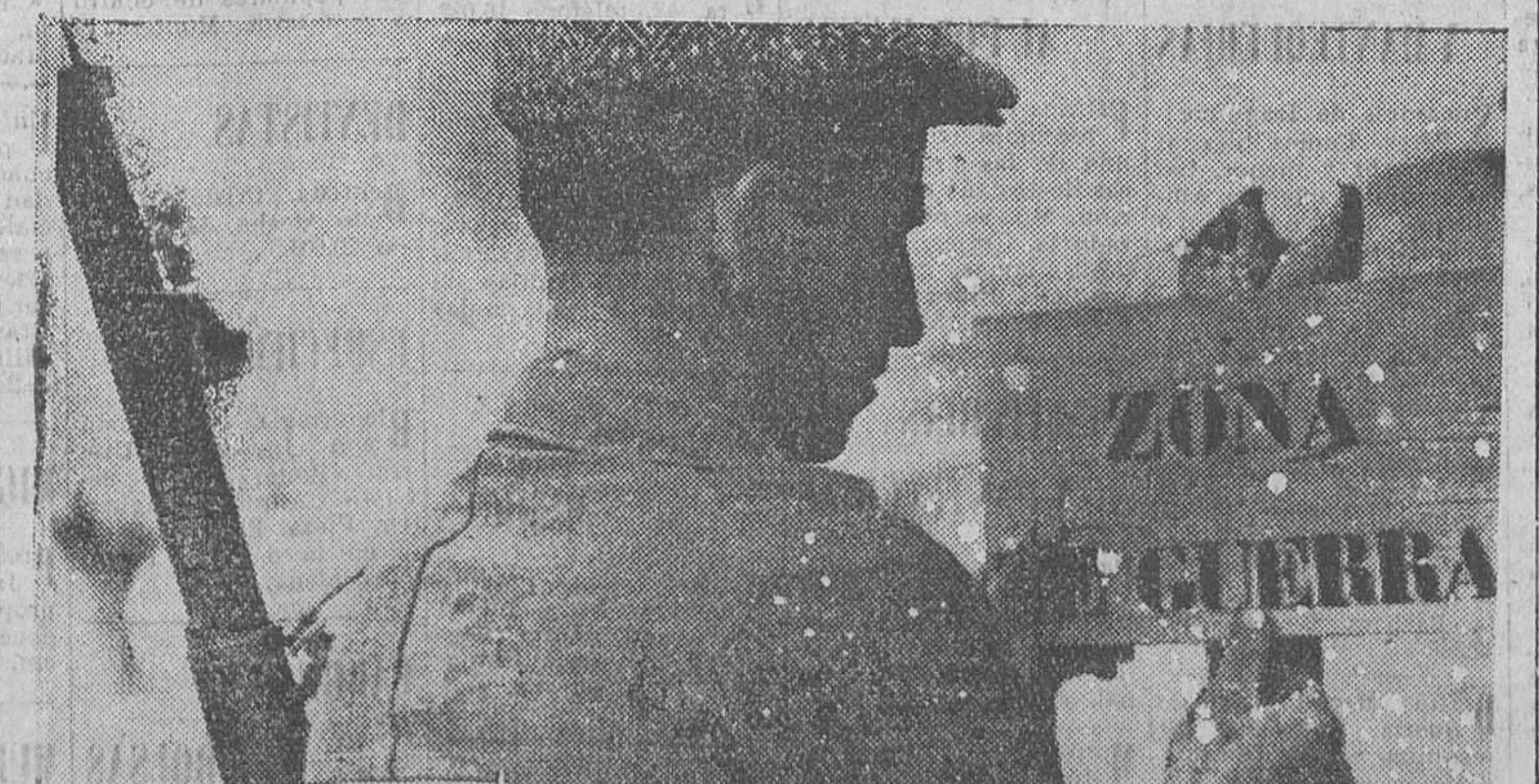
Un campesino coloca el cartel que señala el comienzo de la zona de guerra en el sector del Centro

Se produjo la fractura de la base del cráneo, por lo que falleció cuando los médicos se disponían a operarle.