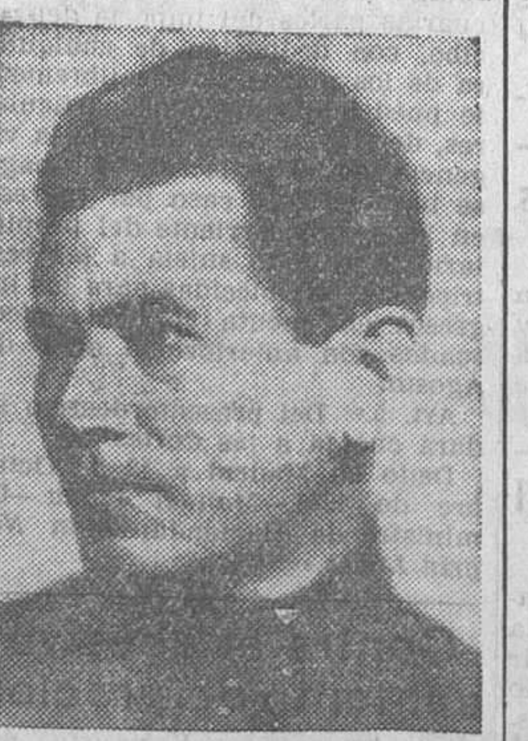
Nicolás Ivanovitch Elov, nuevo comisario del Pueblo del Interior en la U. R. S. S.