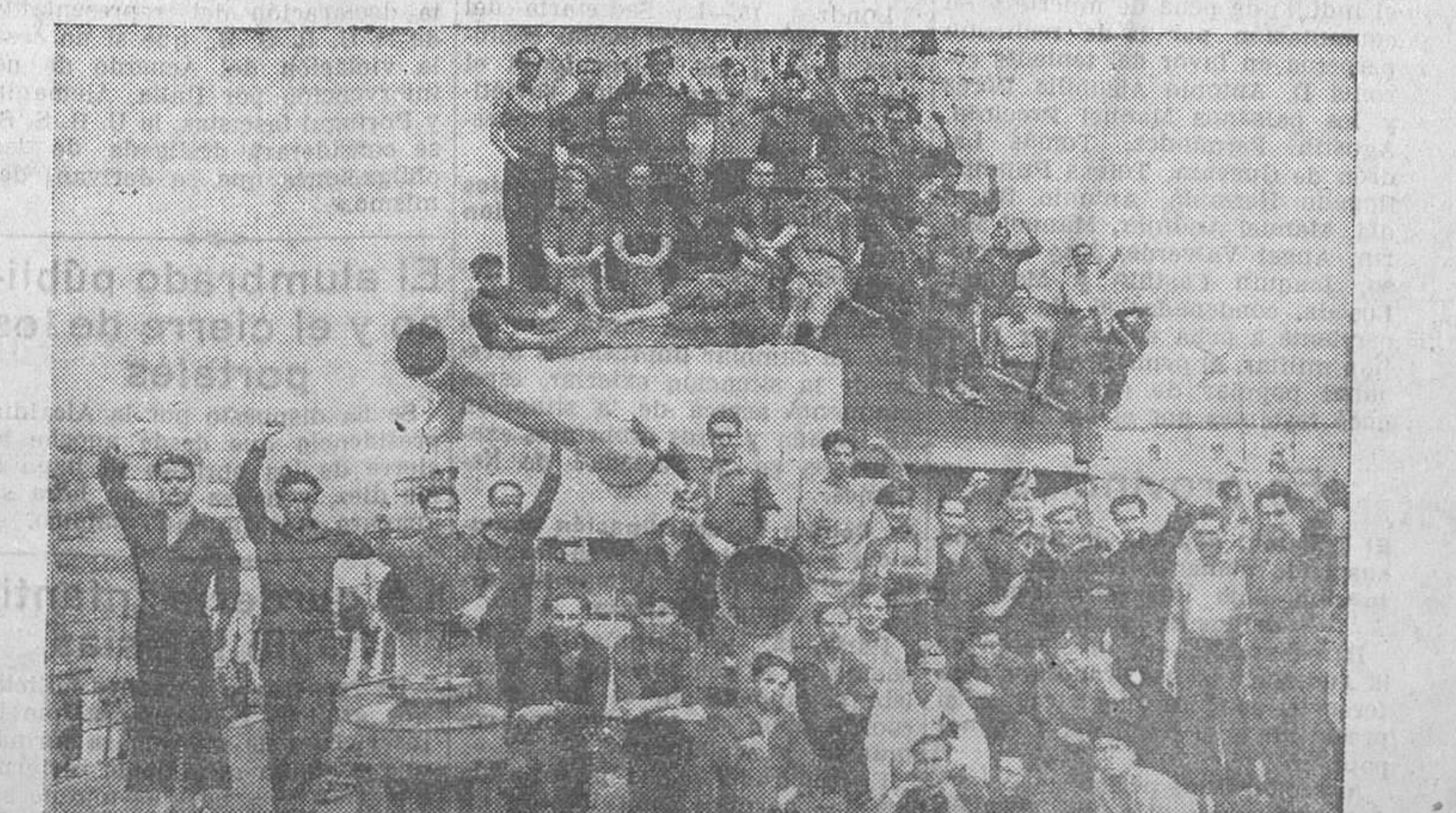
LA MARINA LEAL.—La dotación del «Alcaid Galtano», que constantemente viene dando pruebas de su inquebrantable adhesión al régimen