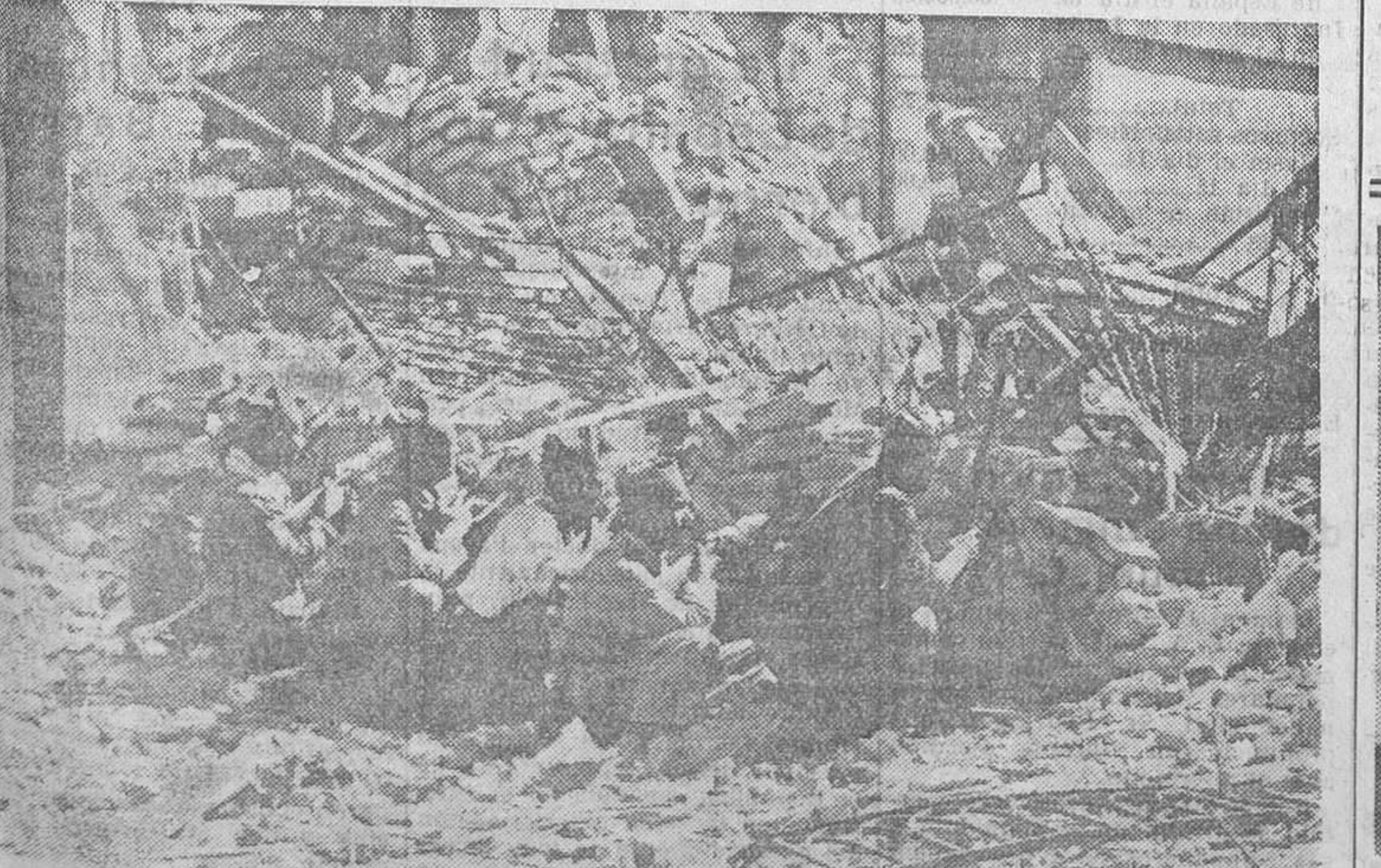
Después de reconquistado un pueblecito, destrozado por el enemigo, las fuerzas leales se atrincheran aprovechando el escombros