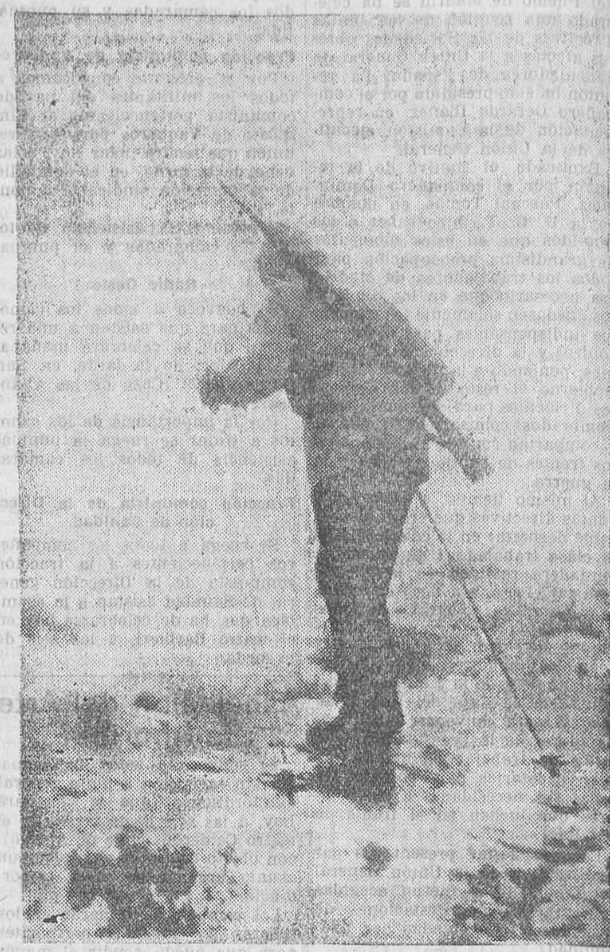
NIÉVE EN LOS FRENTES SERRANOS.—Un bravo militano del batallón alpino del quinto regimiento ganando una de las lomas en la nevada Sierra

París, 15.—A propósito de los discursos del rey de Bélgica, «Le Temps» escribe de este modo: «Que Bélgica quiera practicar una política «exclusiva e integral belga», se concede y no se le puede hacer objeción. Es, en efecto, una nación que tiene el sentimiento de su independencia en la dignidad. La sola experiencia que hay que probar será para nuestros vecinos y amigos saber si esta política «exclusiva e integralmente belga» está mejor servida por la voluntaria neutralidad de hecho y al modo de Suiza u Holanda, dejando a Bélgica su entera libertad de movimientos, que por una política de acuerdos de seguridad que comprenda obligaciones recíprocas. Pero la neutralidad lealmente defendida; si no constituirá un peligro no tan sólo para Bélgica, sino también para los vecinos de buena fe.»