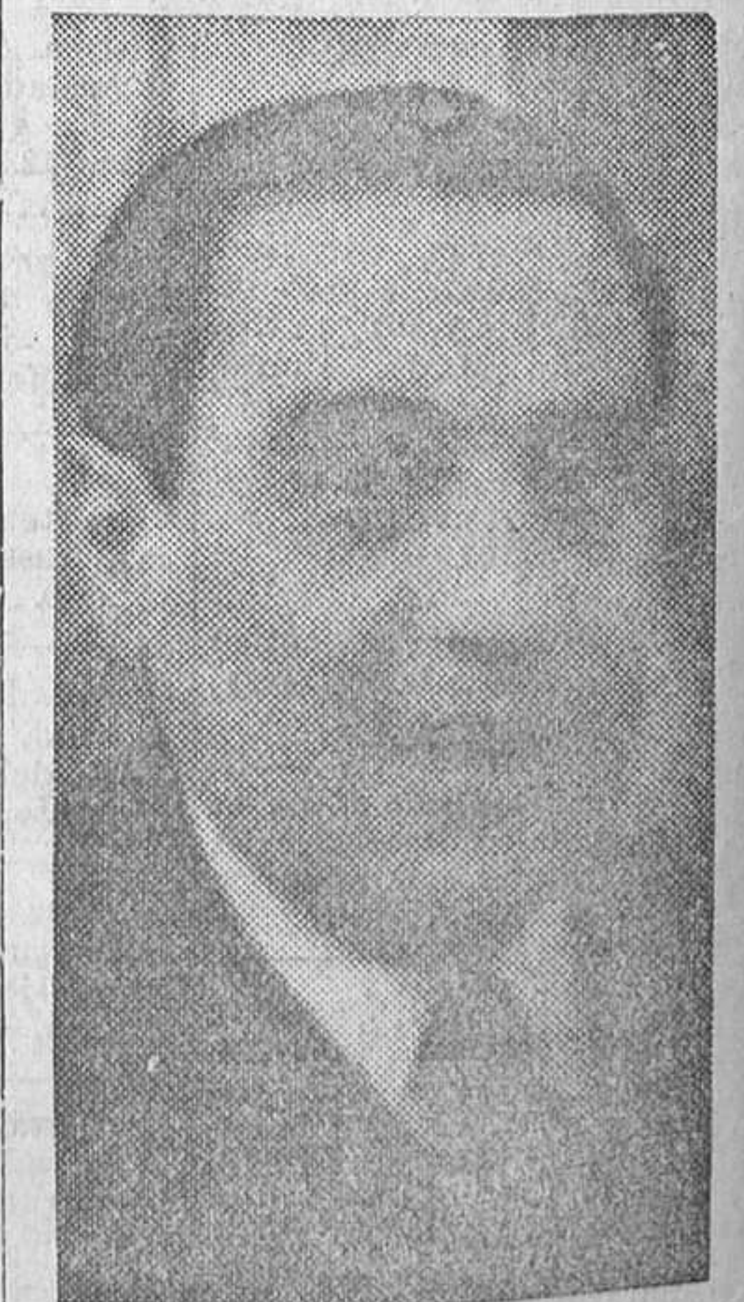
Don Luis Jiménez de Asúa, ministro plenipotenciario de primera clase, encargado de Negocios en la Legación de España en Praga

Los milicianos son portadores de muchos trofeos y armas cogidas al enemigo.