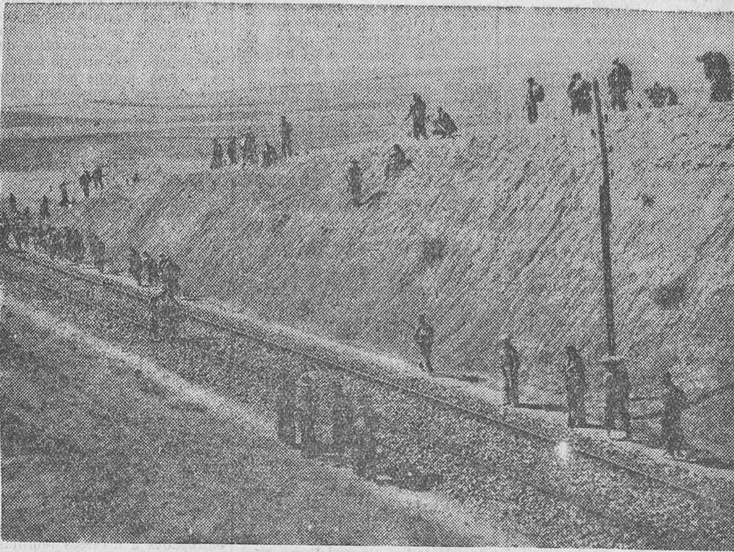
Las fuerzas de la República marchan vigilando la línea férrea

Análogos episodios se han registrado en los barrios de San Claudio y Santa Marina. La lluvia, que tenazmente cae desde ayer, ha retrasado algunas operaciones. A pesar de ello, nuestros camiones blindados han llegado