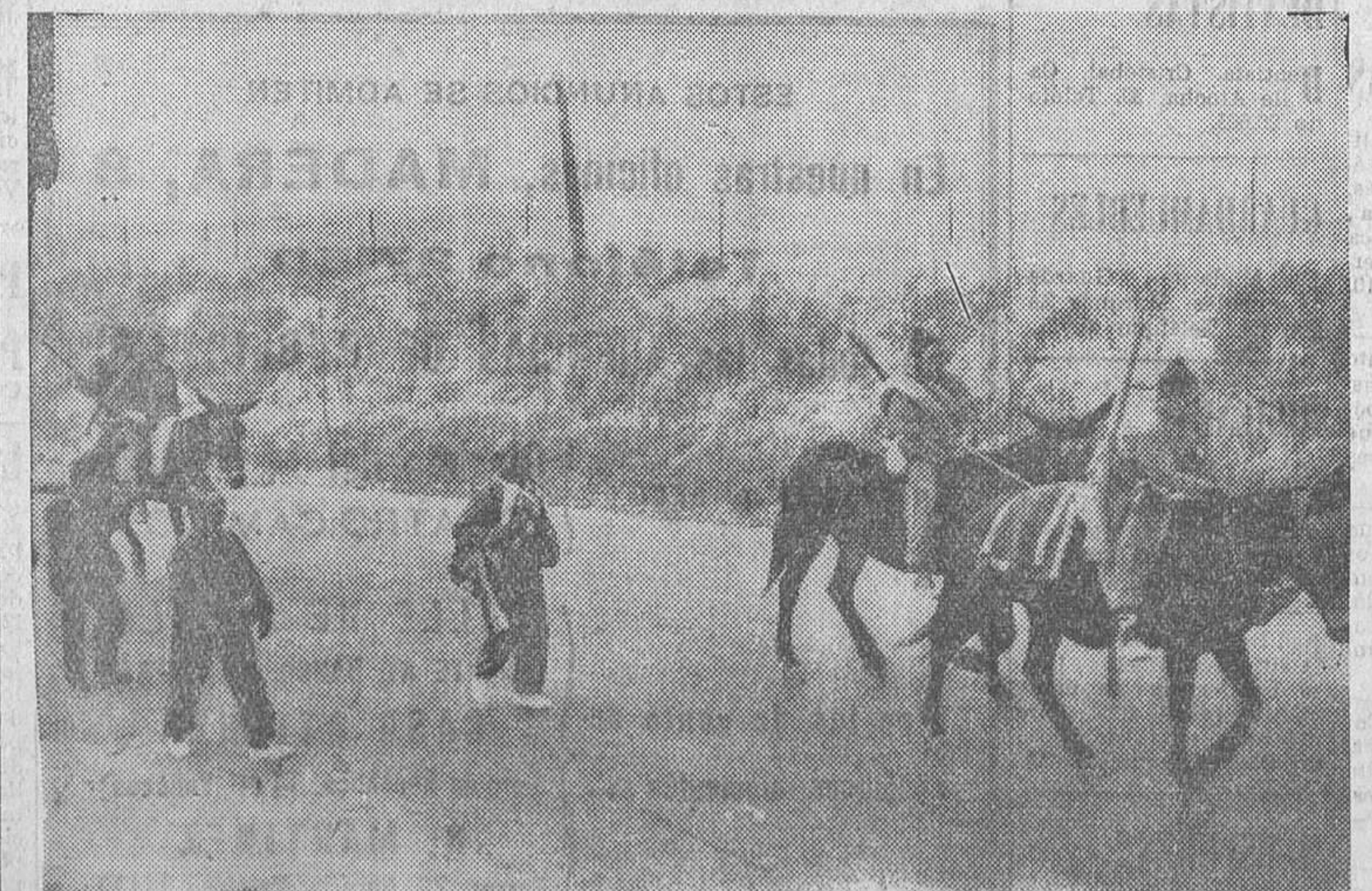
Soldados leales a la República marchan por la carretera hacia las líneas de fuego