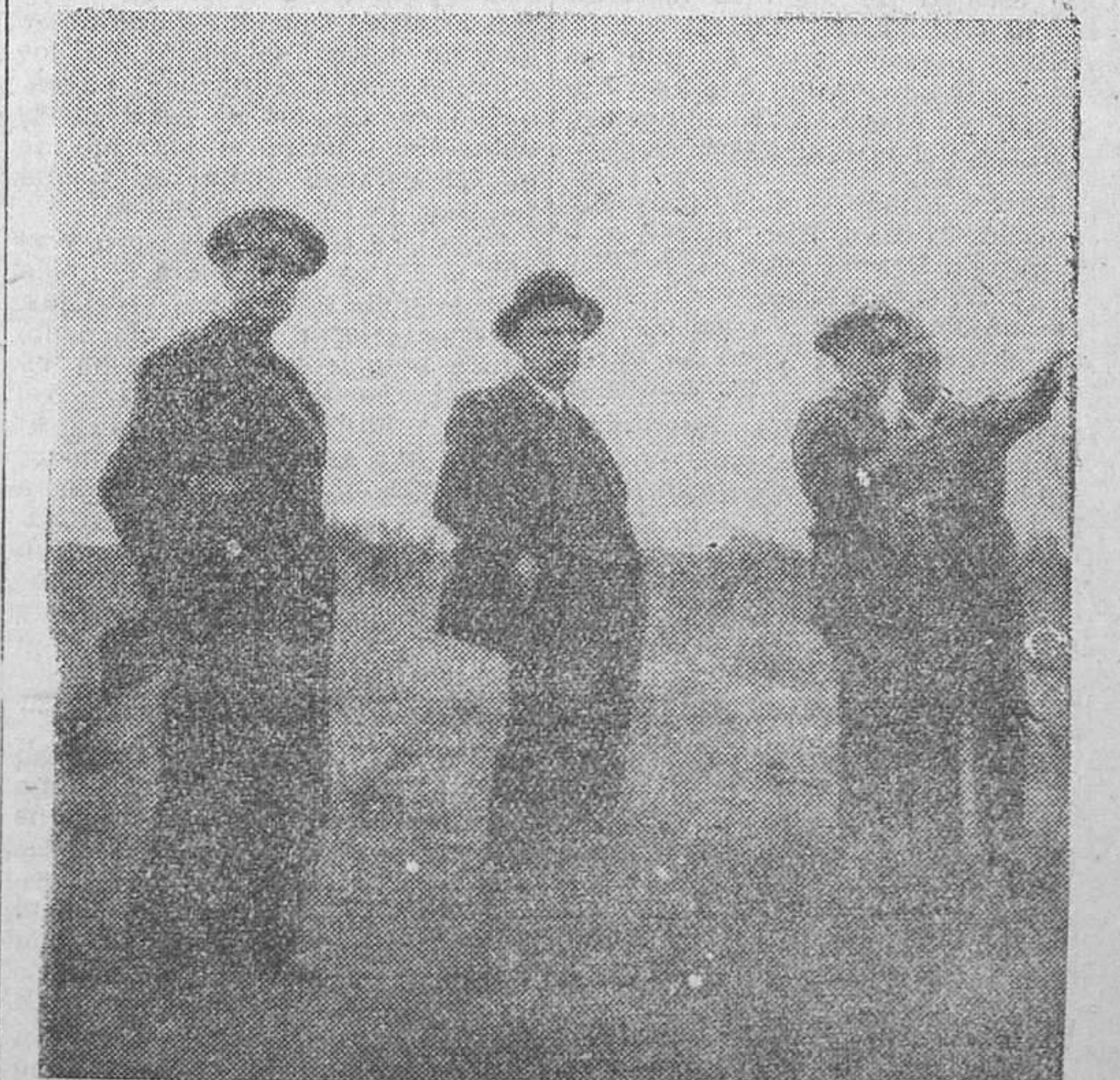
El jefe del Gobierno visitando en el frente las posiciones de nuestras fuerzas

Roma, 5.—El ministro de Propaganda, Alfieri, ha regresado a esta capital, habiendo realizado el viaje, que duró cinco horas, en el avión especial del Führer.