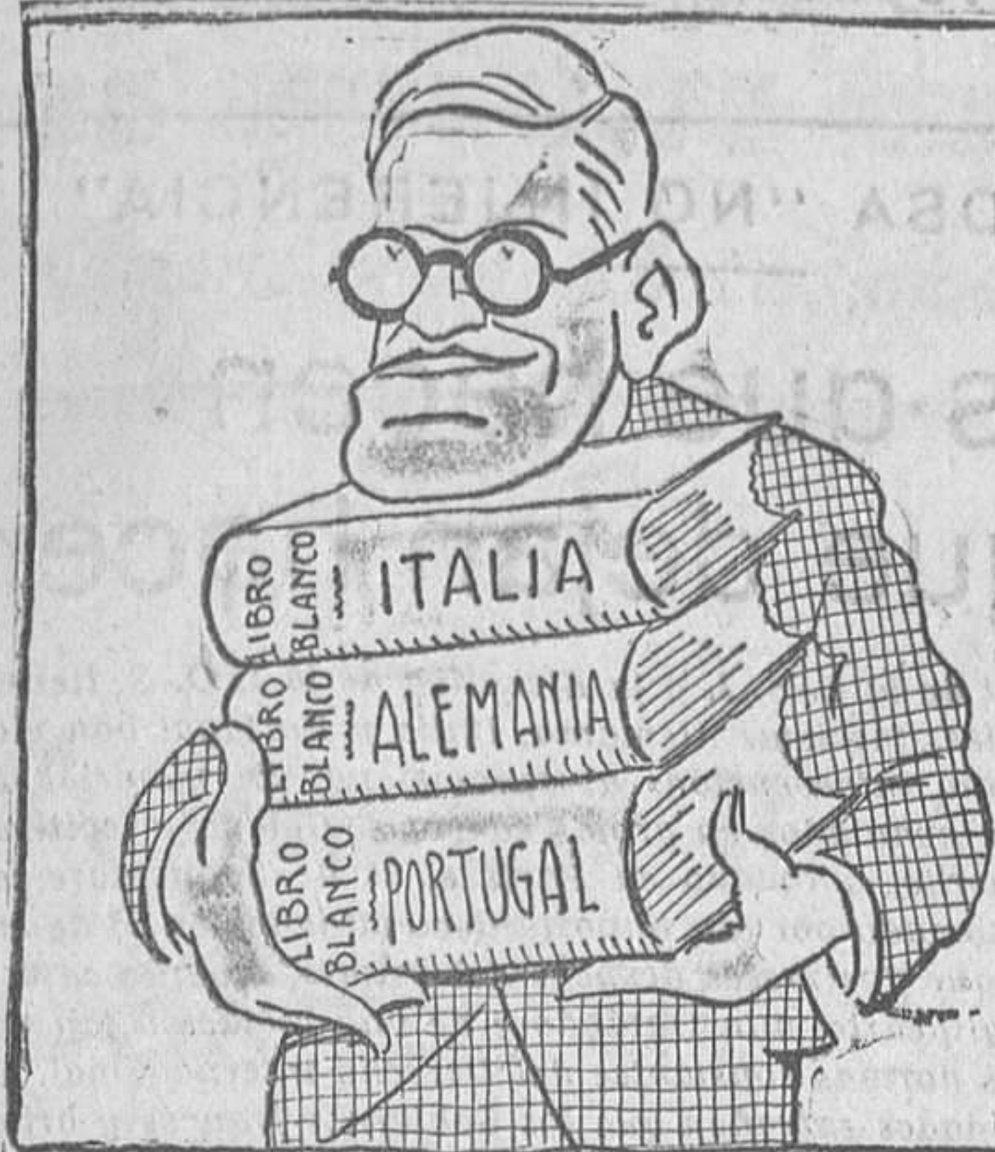
Alvarez del Vayo.—Y ahora a preparar la segunda edición, sin corregir, pero aumentada.