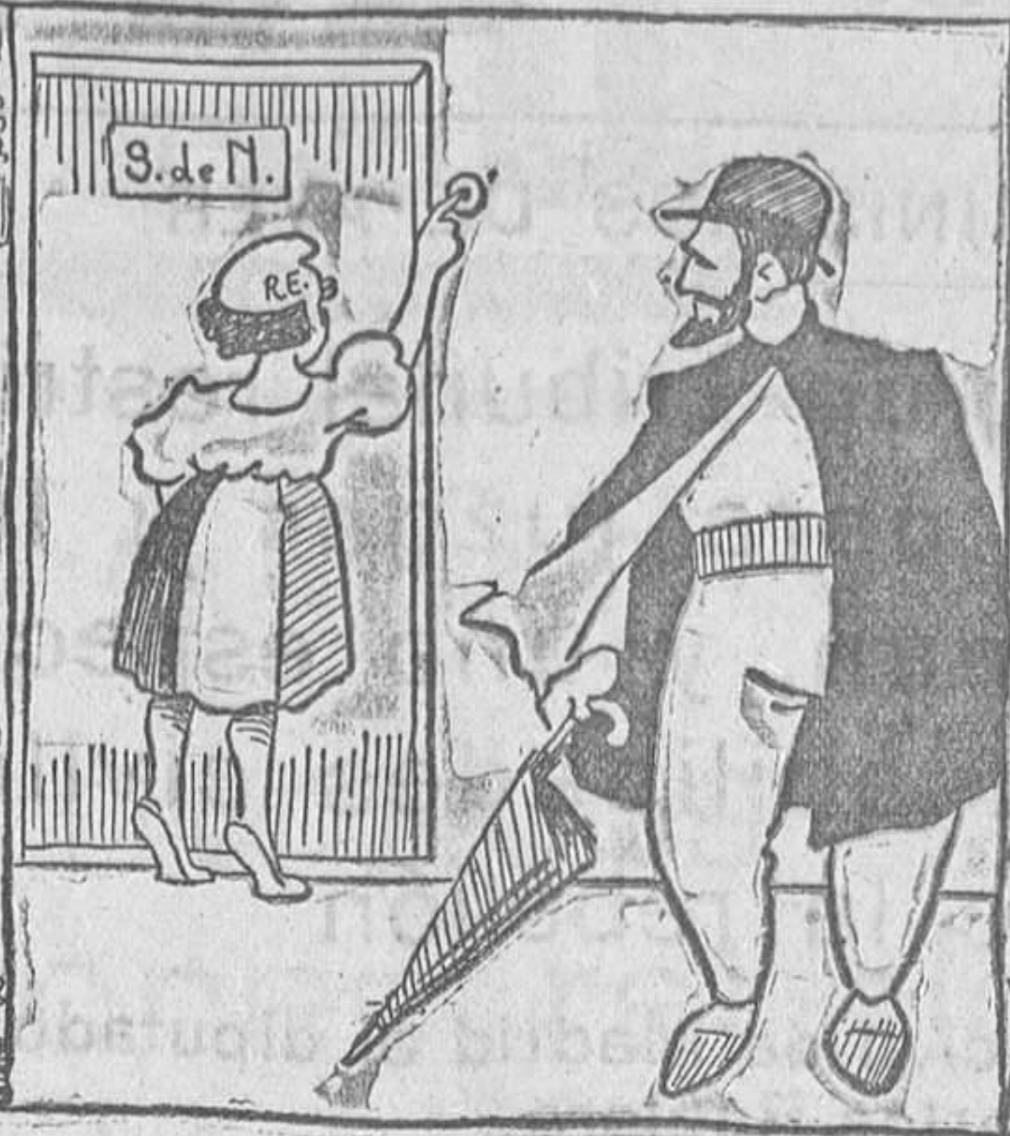
El Negus.—De haber tenido yo tu pueblo, no habria perdido el tiempo llamando a esa puerta.