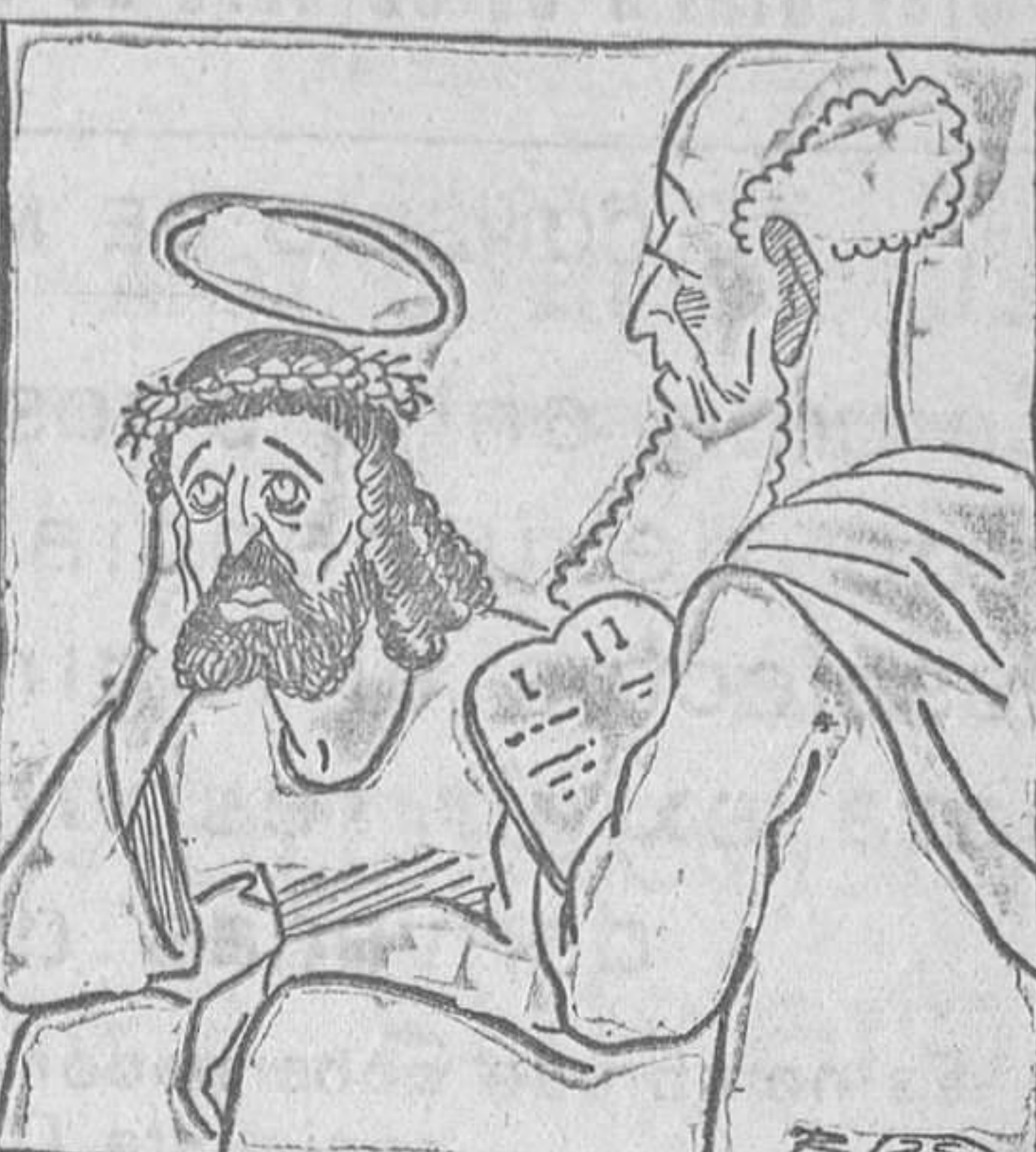
—Señor, los clérigos de España han traducido mal las palabras divinas. Y, es claro, se atienen a esta traducción errónea «Mataos los unos a los otros».