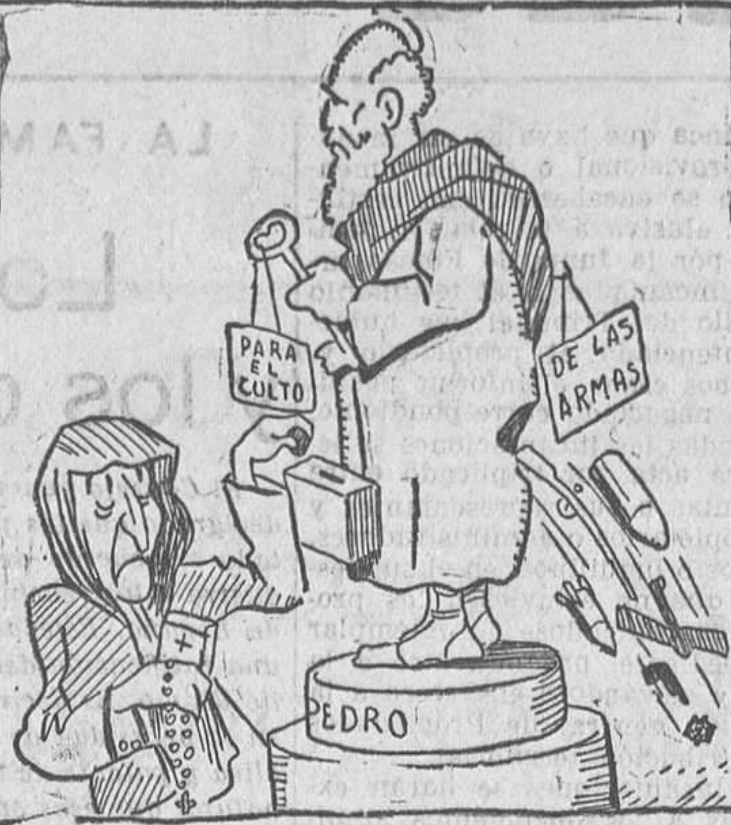
Los dineros de San Pedro.