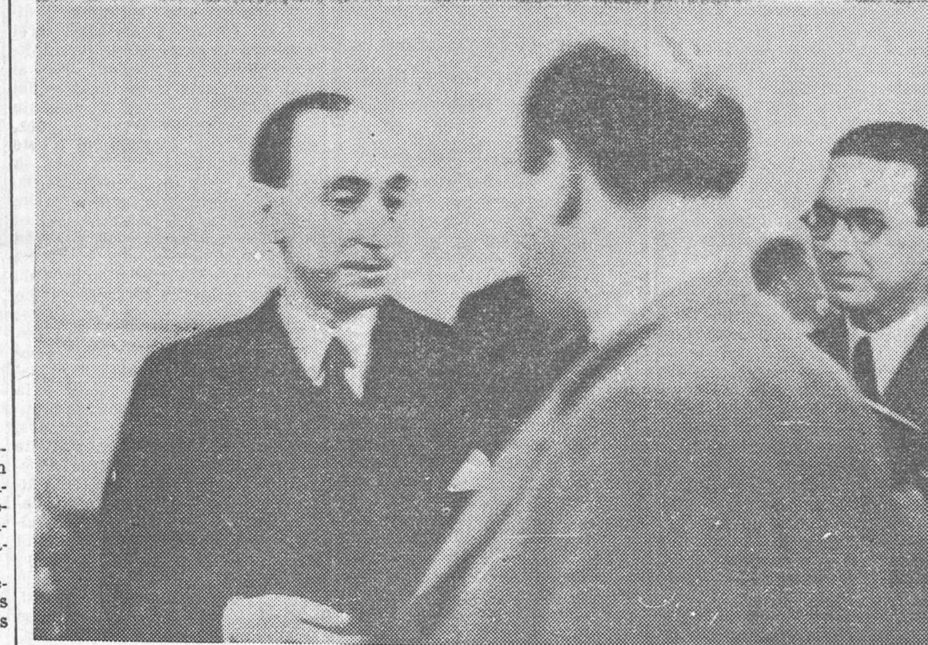
El jefe del Gobierno, Sr. Casares Quiroga, dando una referent a de lo tratado en la reunión con los representantes del Frente Popular

Advierte que mientras han sido interrumpidos no han pensado en retirarse, y sólo lo han hecho cuando el ministro ha calificado de mezquina la enseñanza religiosa. Recuerda que la República, en sus comienzos, publicó un decreto contra el intrusismo, y en virtud de él fueron afectados muchos centros de enseñanza religiosa.