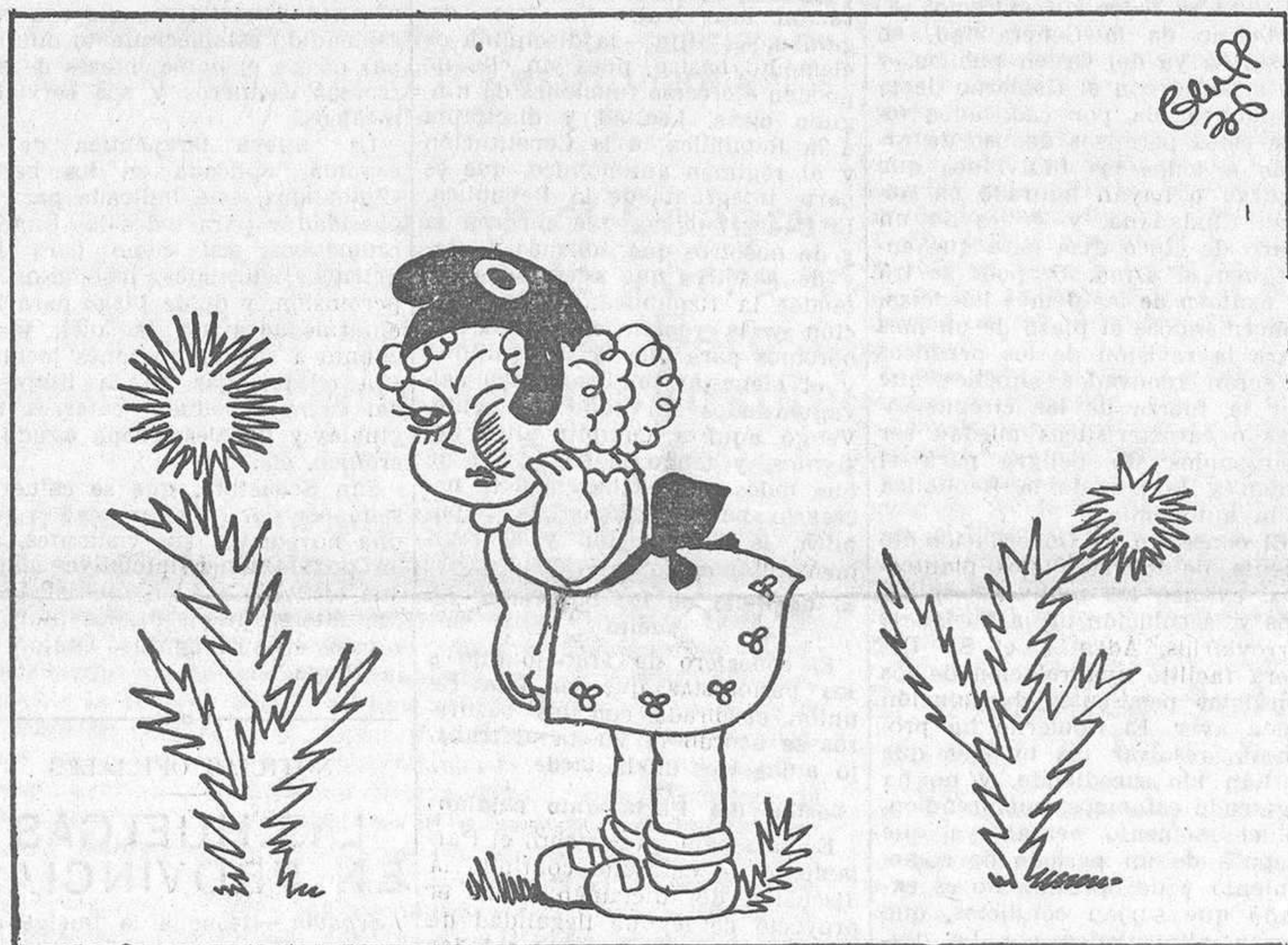
CON LA CARA HINCHADA, por Bluff —¿Pero es que voy a tener que poner el otro carrillo, como dicen que Cristo nos enseña?

En cuanto al reajuste ministerial, convergen todos los rumores en que se hará de acuerdo con el resultado de la conferencia que ayer sostuvieron los representantes del Frente Popular con el jefe del Gobierno. Momento adecuado para imprimir al Gobierno el carácter de máxima energía que nosotros pedimos. Parece fundamental que en el Gobierno—si se ha de llegar al régimen de fuerza que propugnamos—tengan representación algunos sectores más del Frente Popular, dispuesto a hacer más firme su cohesión y a no crear obstáculos al régimen. El reajuste ministerial significa, en primer lugar, una rectificación de política, sobre todo en el sentido de hacer estricta justicia y de conseguir el resplandecimiento de la verdad. Produzca, pues, lo que se espera. Del debate parlamentario de hoy saldrá vigorizada la fuerza moral del Frente Popular. Del reajuste del Gobierno esperamos nuevas líneas políticas más adecuadas a la grave situación por que atraviesan España y la República.