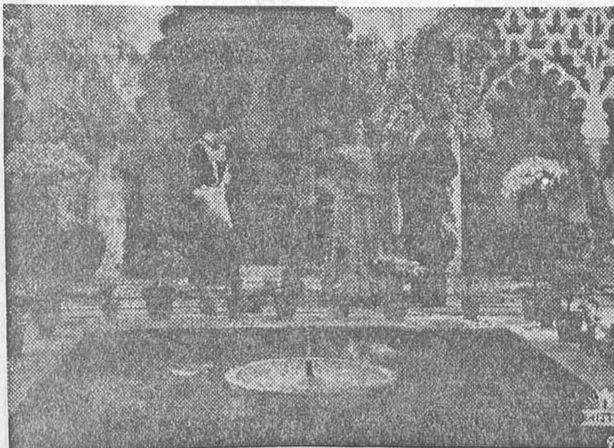
La admirable estrella Imperio Argentina en una escena de la película nacional de Florián Rey «Morena clara», éxito sin precedente de Cifesa en Rialto