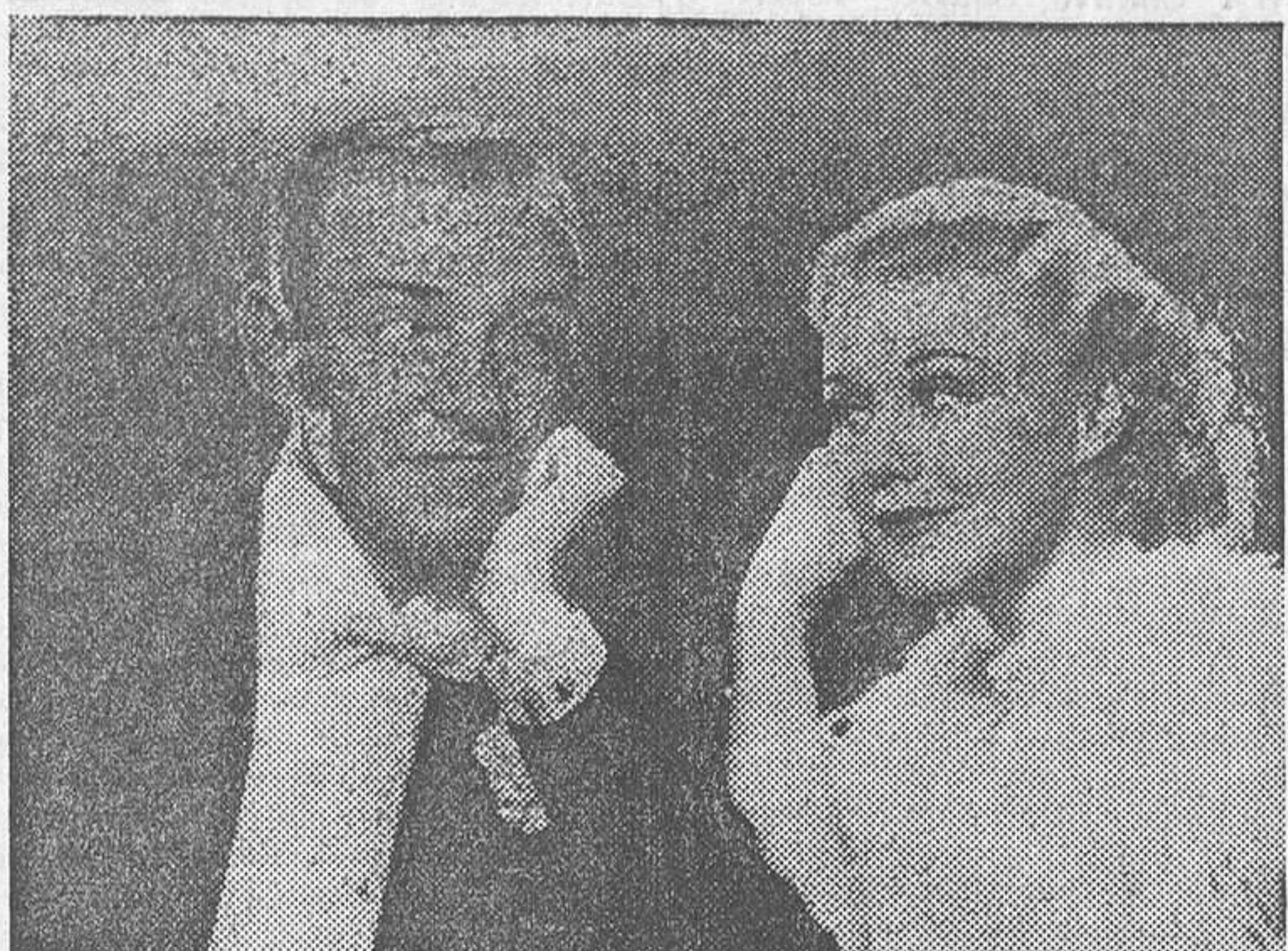
Gingers Rogers y Fred Astaire, la triunfal pareja de «Sommbrero de copa», film Radio de grandioso éxito en el Avenida

Florián Rey es aragonés, de la Almudia de Doña Godina; lleva dedicado al cinematógrafo dieciocho años. Comenzó interpretando los primeros films que dieron prestigio al cinema español, entre los que figuraban «La verbena