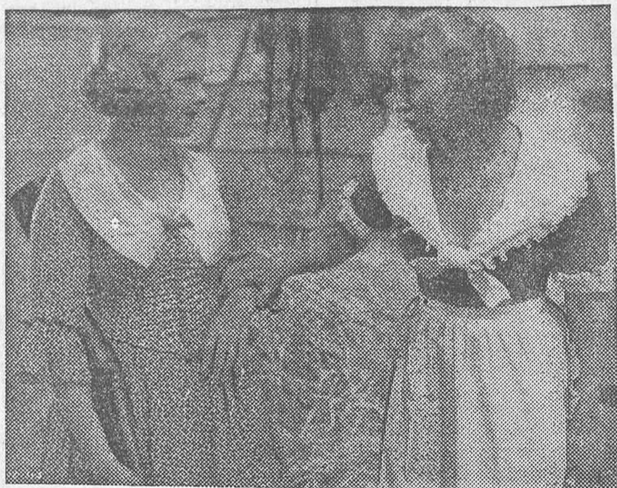
Joan Bennett y Mary Boland en «El derecho a la felicidad», sensacional film Paramount que el sábado se estrenará en la Prensa

ofrece con los conceptos morales de aquellos días; esa escena es el punto culminante de esta comedia, que retrata fielmente ciertas peculiaridades sociales de los tiempos coloniales en Norteamérica.