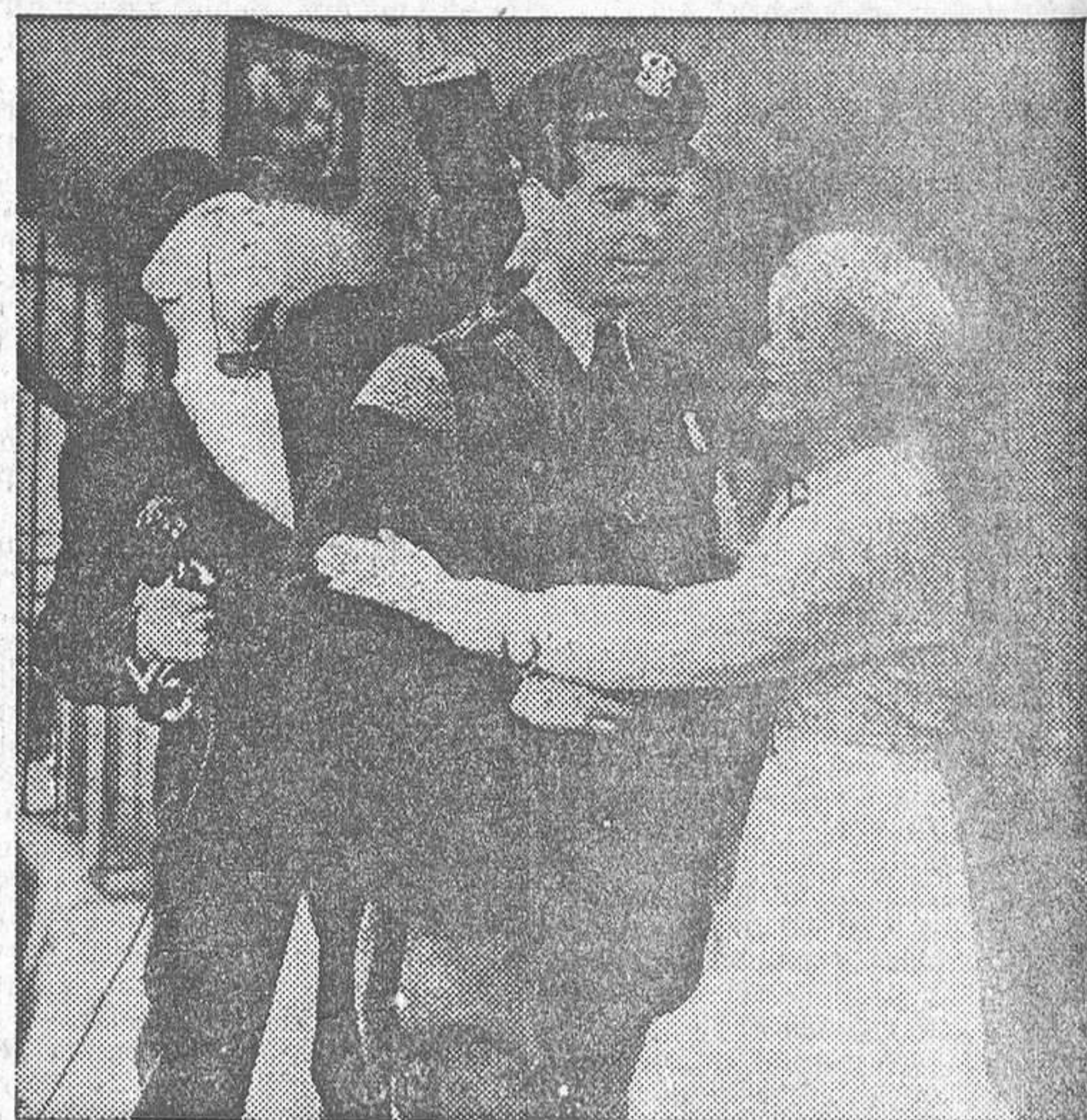
In Guy Standing, Ann Sheridan y Fred Mac Murray en «Pistas secretas», intrigante film Paramount que el lunes próximo se estrenará en Figaro

¡Una vida de emociones condensada en sesenta minutos de vértigo!