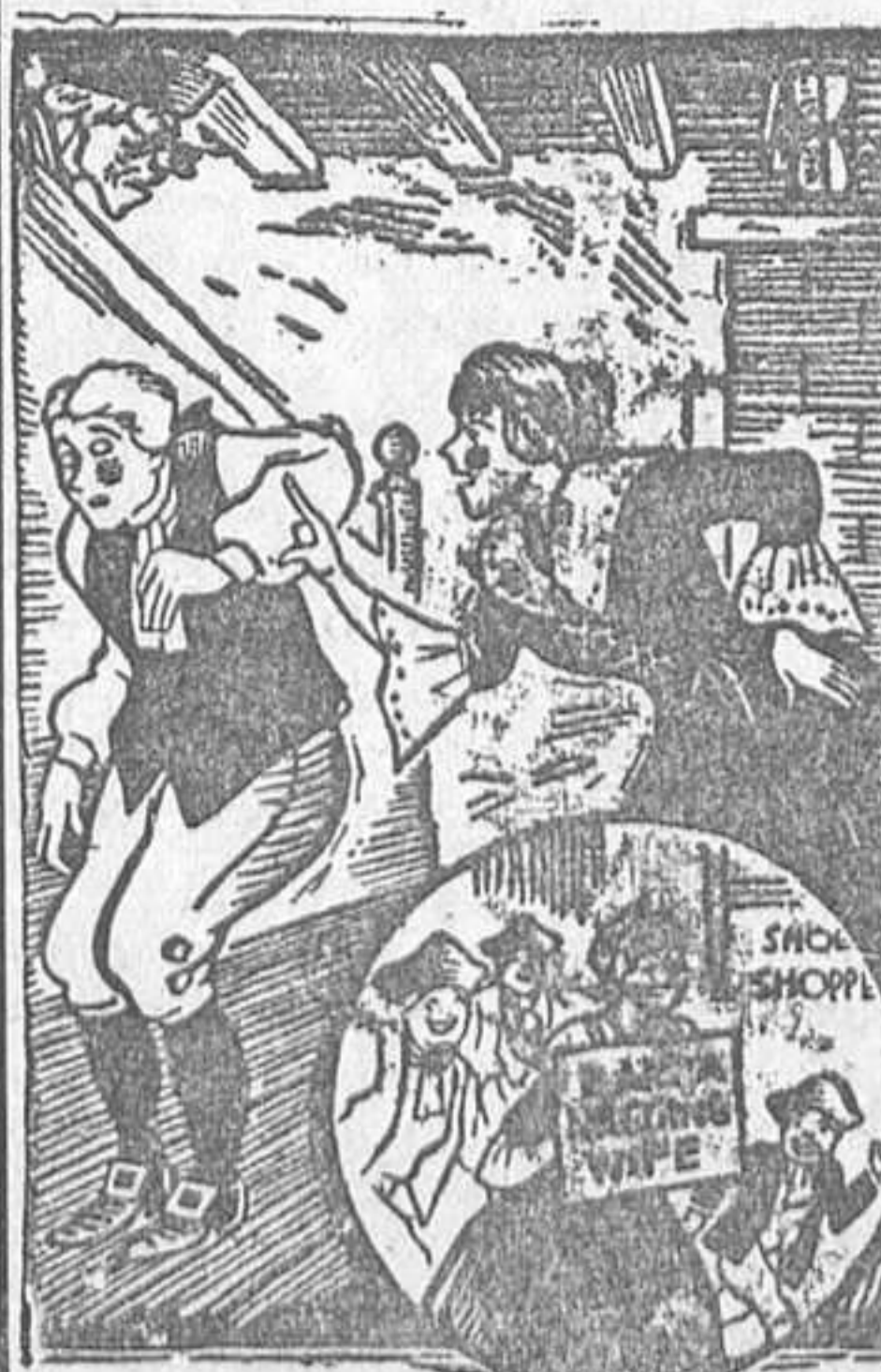
JOAN BENNETT, CHARLIE RUGGLES, MARY BOLAND ES UN FILM PARAMOUNT