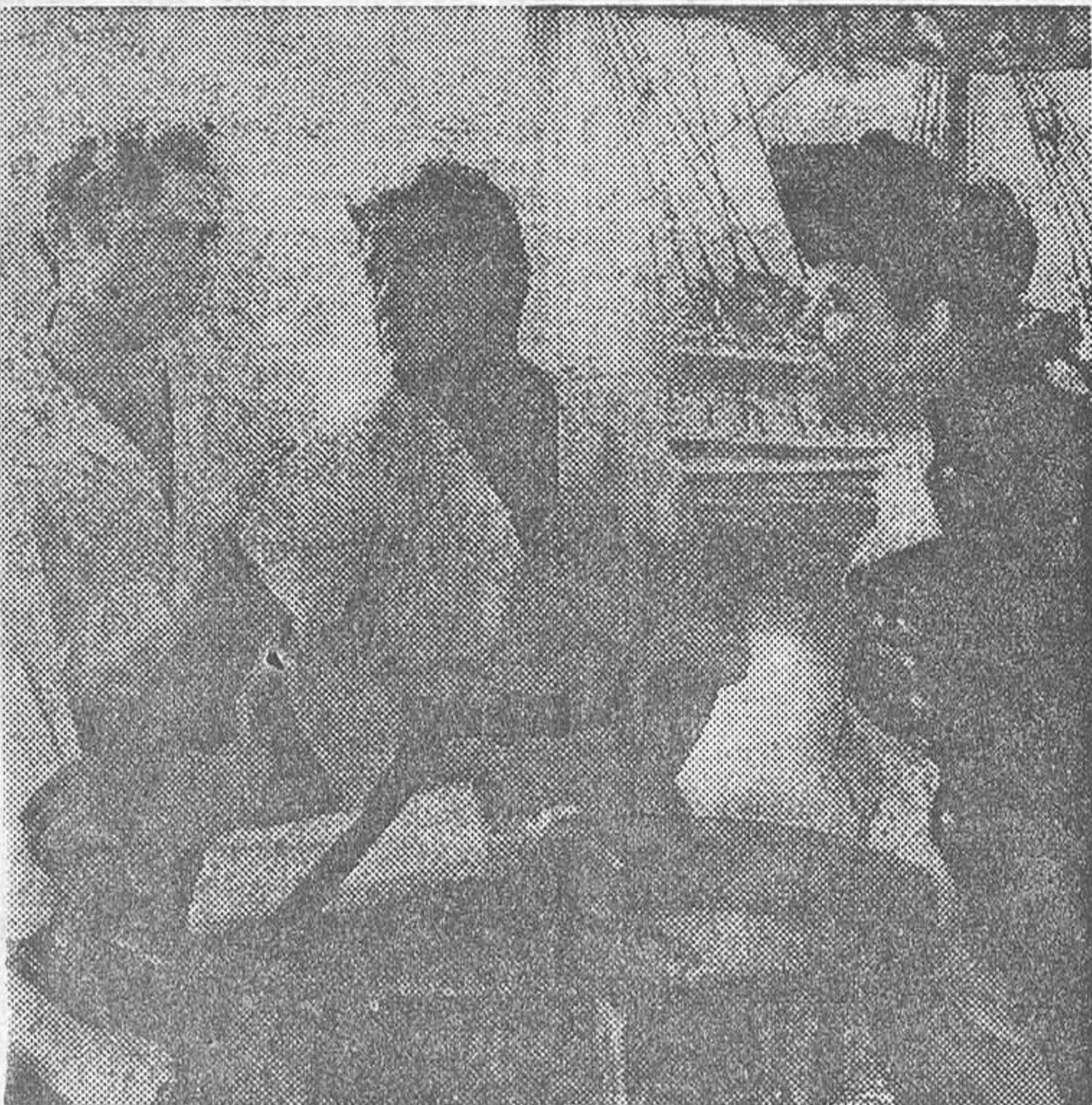
Clark Gable y Charles Laughton en la superproducción Metro-Goldwyn-Mayer «Rebelión a bordo», que el lunes próximo se estrenará en Capitol