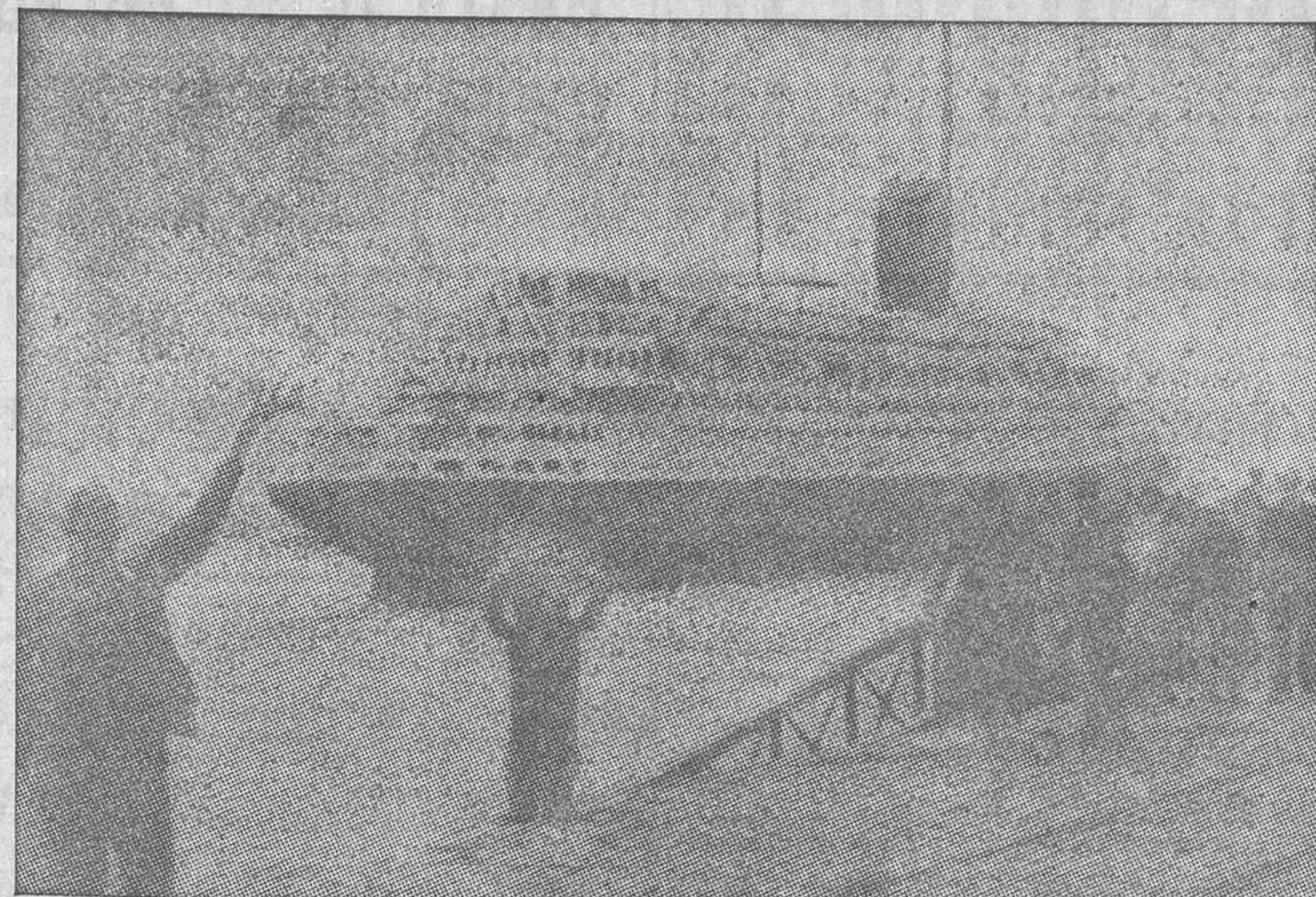
Vueltos los obreros de los puertos al trabajo, la salida del paquebot «Champlain» del puerto de El Havre señaló el término del conflicto