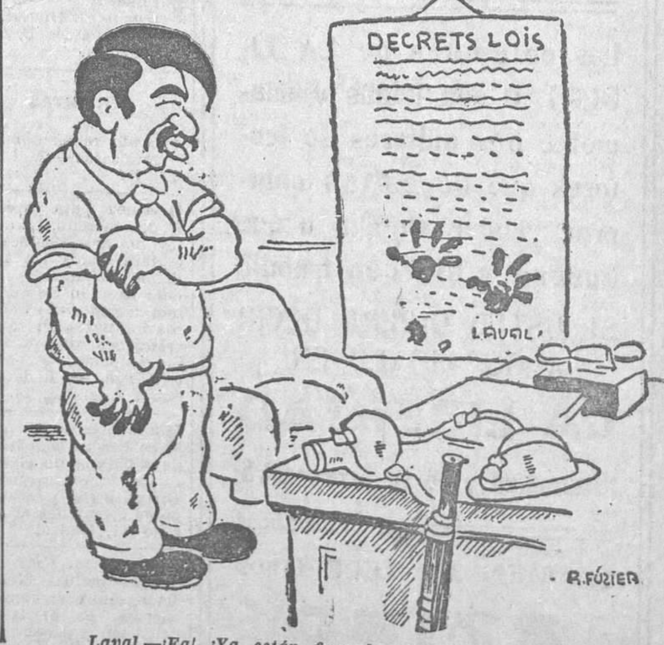
Laval.—¡Eal! ¡Ya están firmados los decretos-leyes!