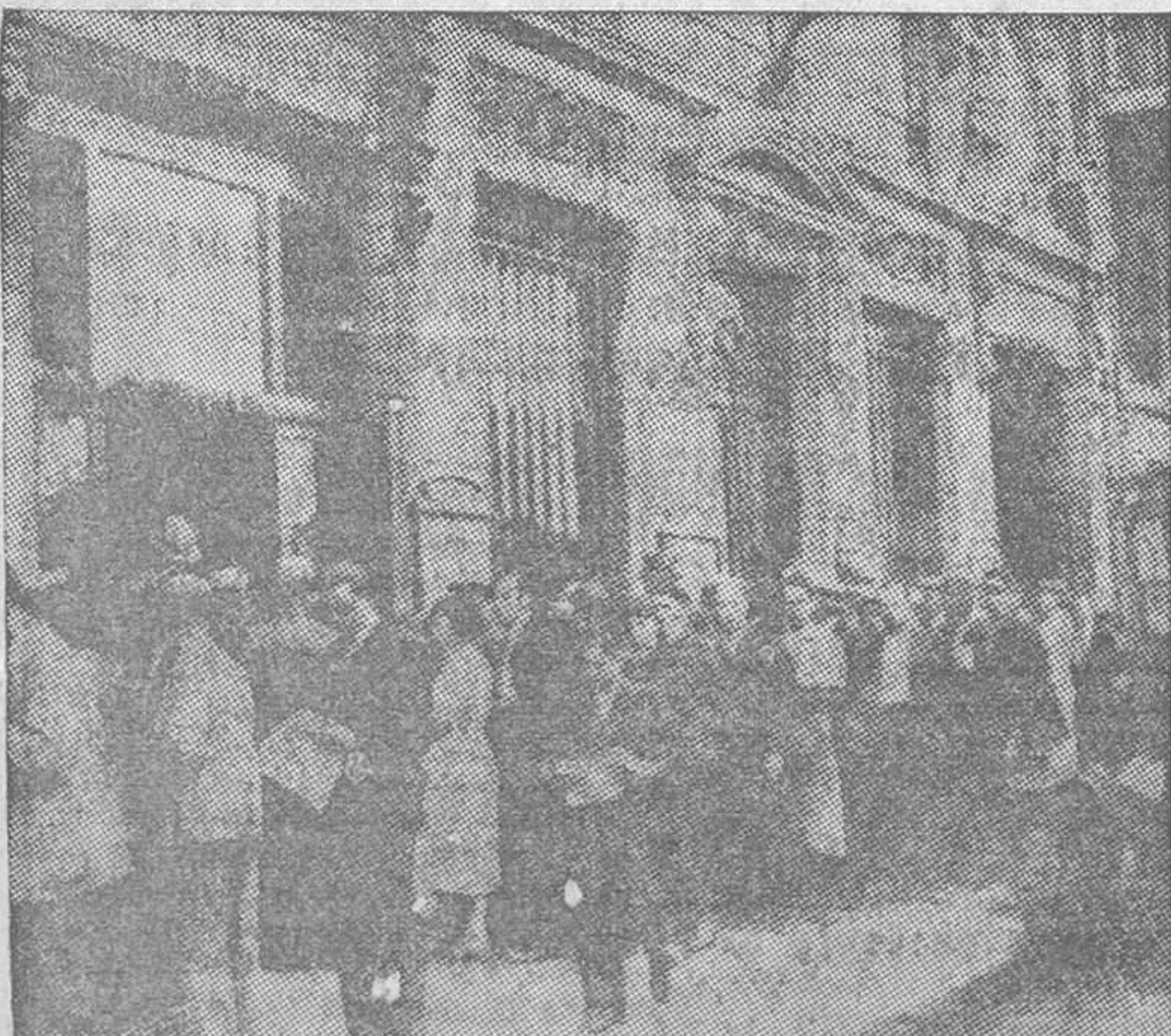
Continúa en Francia la hostilidad a los decretos-leyes de Laval. Ante el periódico oficial, la gente se informa inquieta del contenido de esos decretos, que han de atacar el presupuesto de la casa

La Habana, 12.—Todo el comercio y las oficinas públicas han cerrado hoy en conmemoración del segundo aniversario del derrumbamiento del régimen Machado. La ciudad ha estado tranquila. No se ha celebrado ninguna festividad oficial.