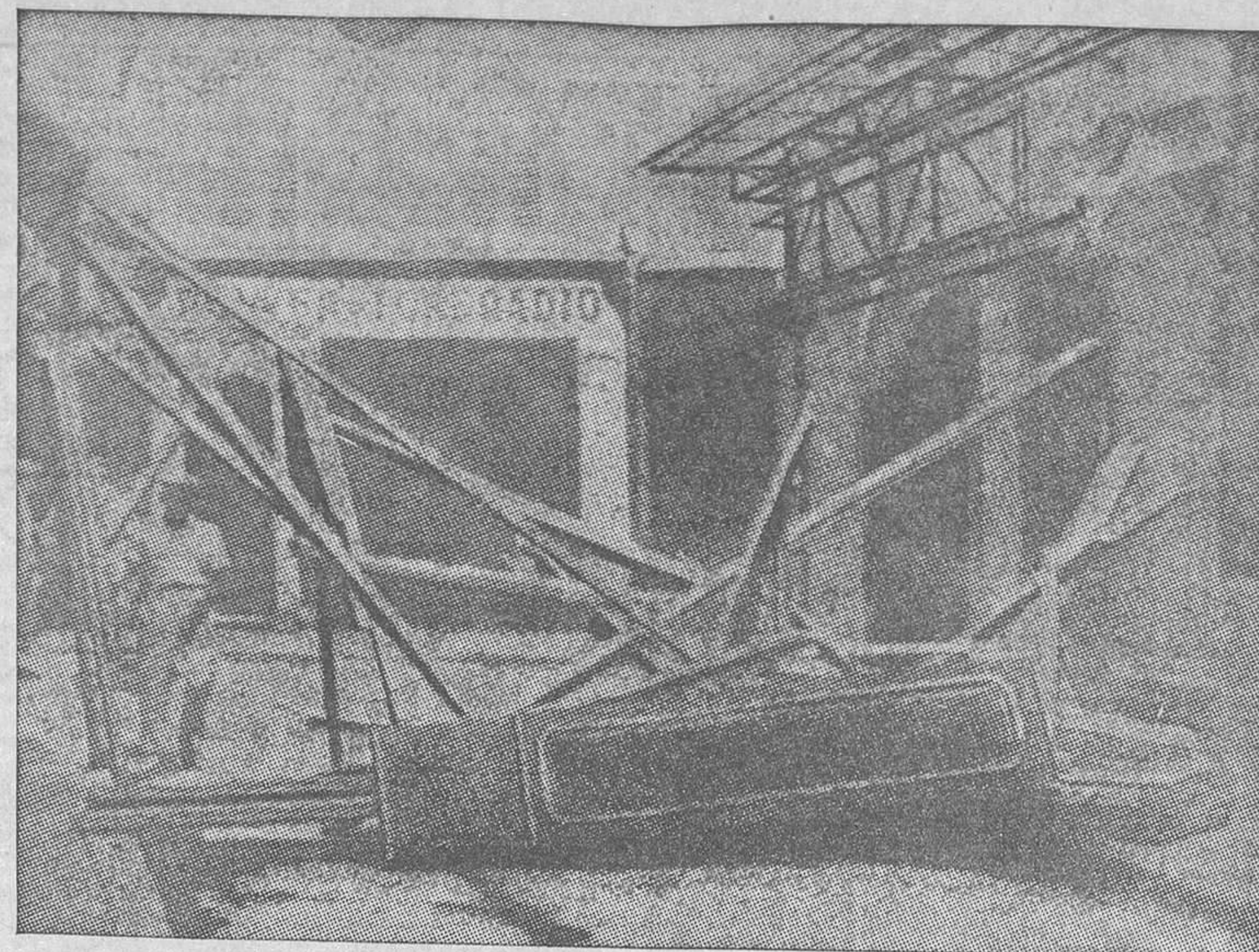
DESPUES DE LOS SUCESOS DE TOLON.—Una de las barricadas levantadas por los huelguistas en los barrios bajos

A impulsos del nacionalismo, víctima del nacionalismo, el Mundo retrocede siglos y siglos. De poco nos sirve toda la civilización si no nos permite considerar hermanos a los nacidos al otro lado de un río o de una montaña. Porque de continuar así, de prolongarse esa terrible xenofobia, no tardaremos en colocarnos a la altura de las tribus salvajes, para quienes cada extraño es enemigo al que hay que exterminar para no ser exterminados.