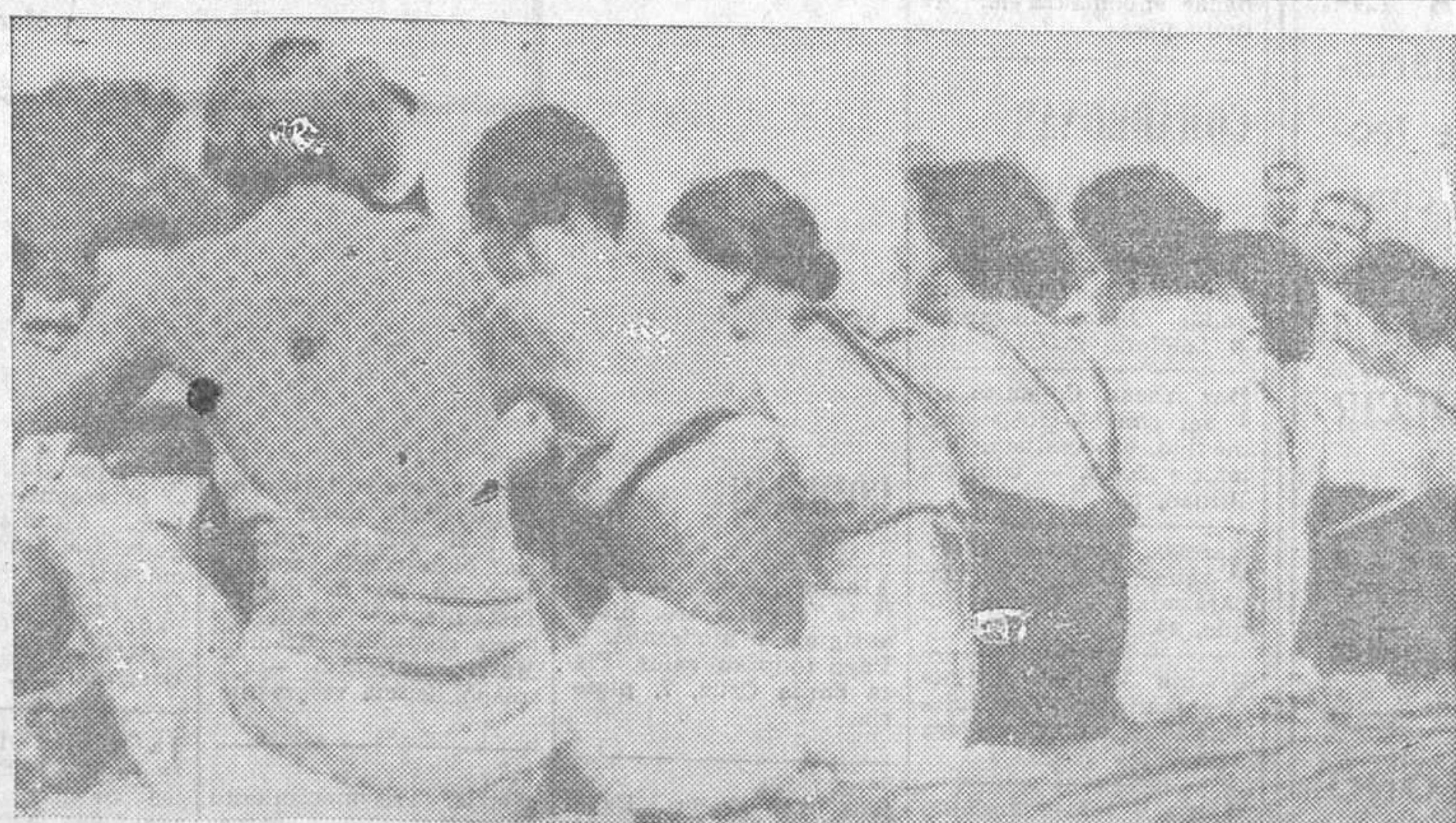
Estas señoritas londinenses se bañan en la Serpentina de Hyde Park, y ofrecen su bella espalda a la ola de calor

Se habían adoptado precauciones por temerse que hubiera desórdenes al abandonar el trabajo a últimas horas de la tarde; pero los obreros se han retirado de los talleres sin provocar manifestación alguna.