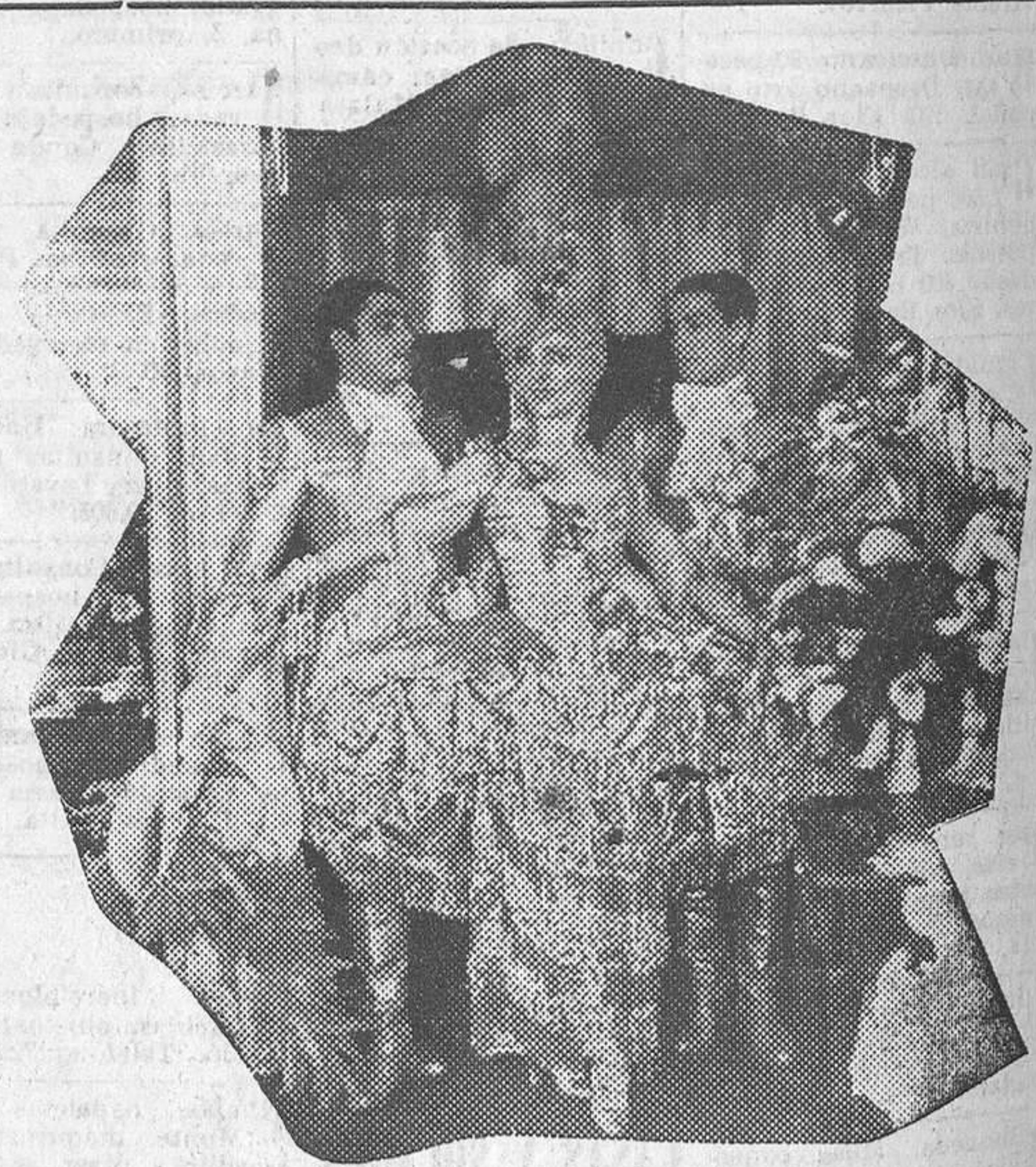
Cecile Sorel, la gran trágica francesa, acaba de hacer su presentación como «vedette» de revista en un célebre «musichall» parisién. Cecile Sorel en un palco del Casino de París

La oposición a esto obedece a que los periódicos estiman que esta previsión no está determinada concretamente en la ley de Prensa.