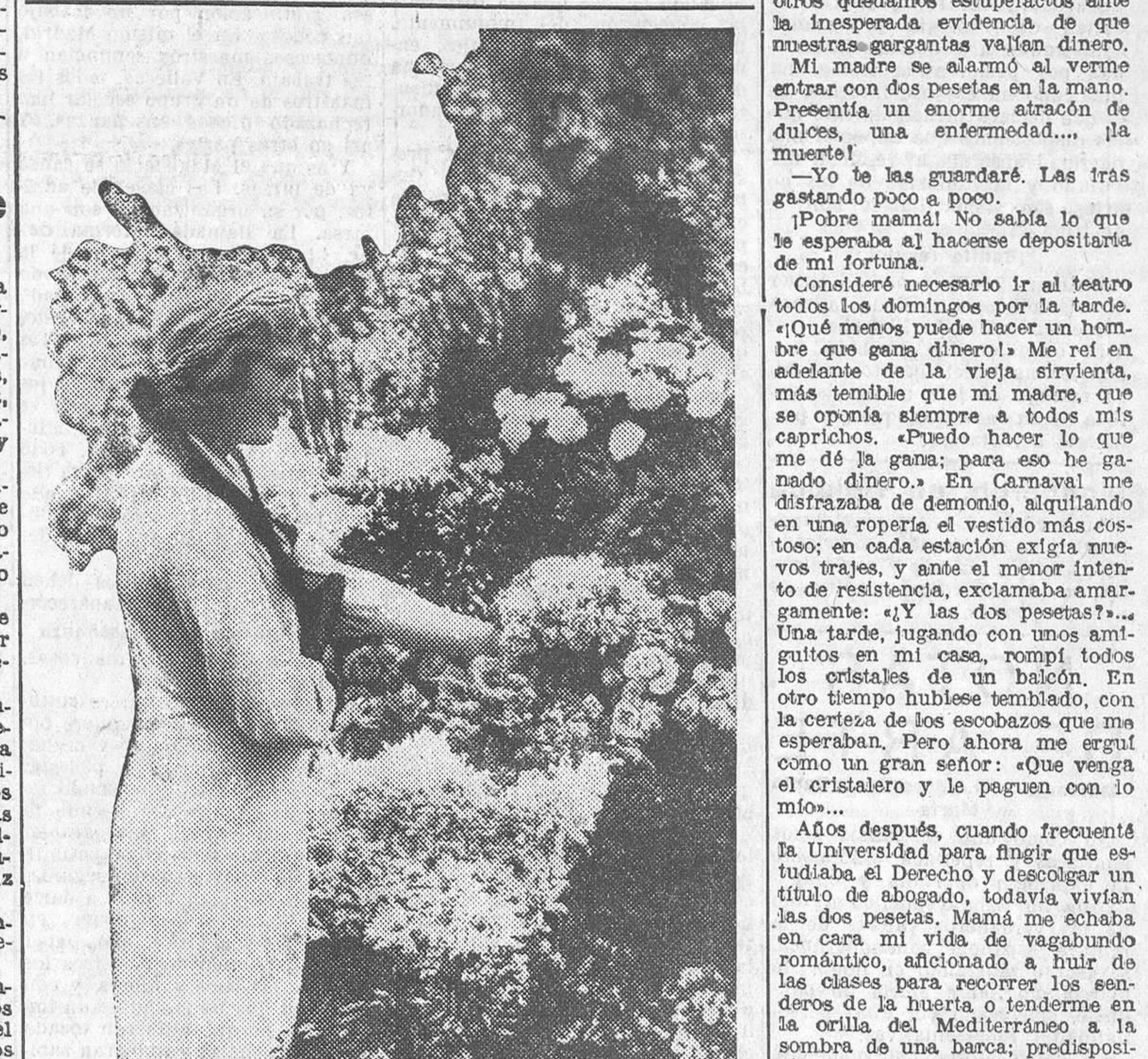
LA FIESTA DE LOS DIFUNTOS EN BARCELONA.—Una barcelonesa adquiriendo flores en un puesto de la Rambla