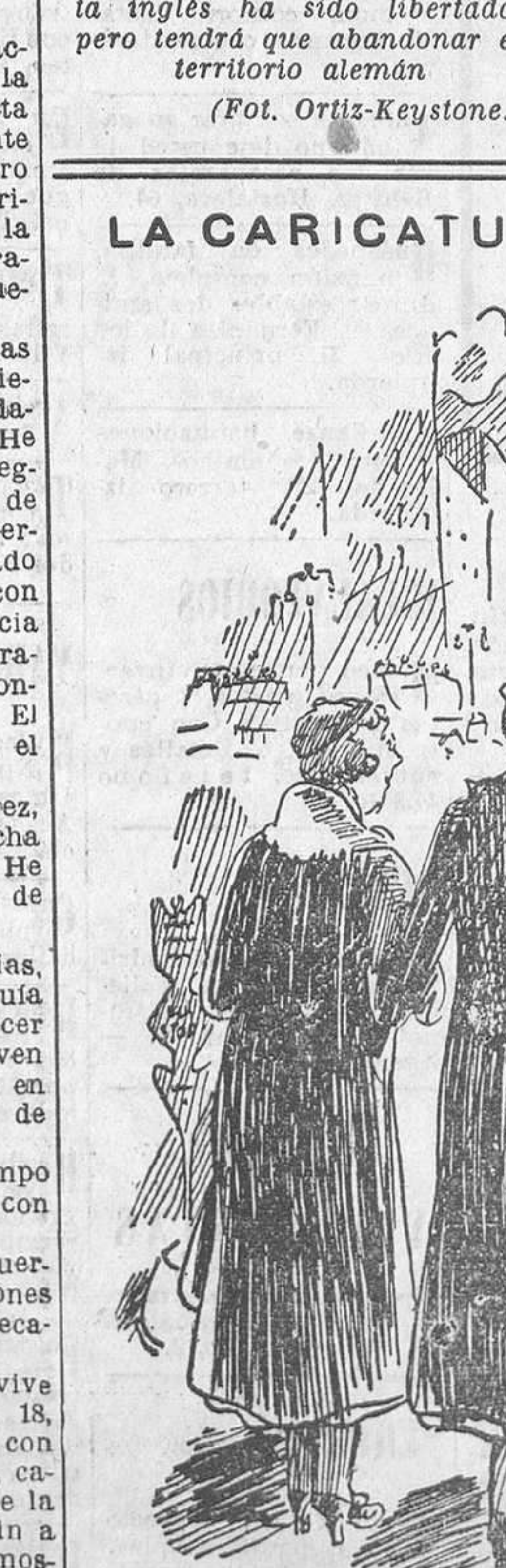
—Precisamente, cuando se habla del diablo... (De «New Yorkers»)