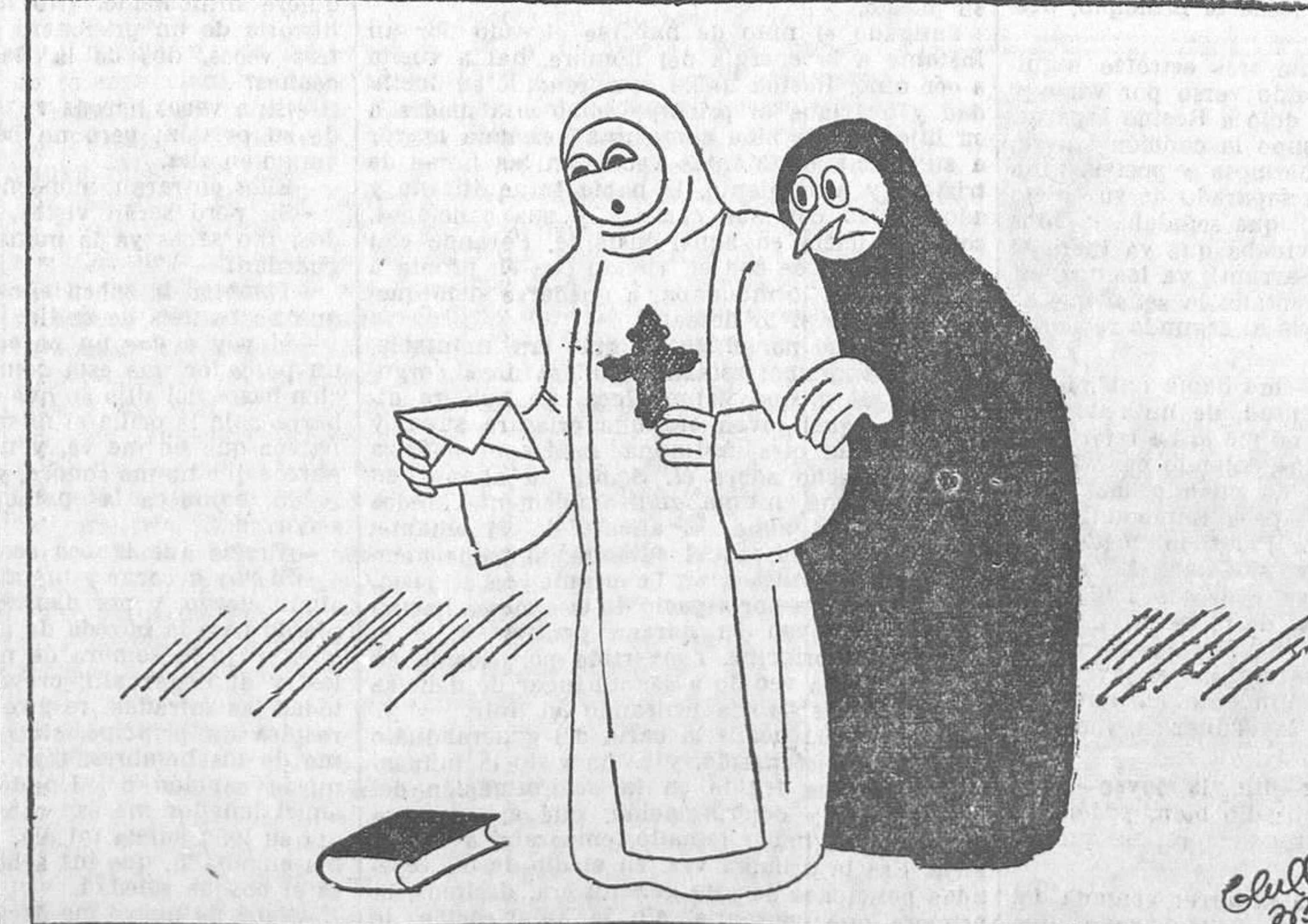
«¡Cielo santo, qué escritural! ¿A que lo manda Gil Robles y es una candidatura?»