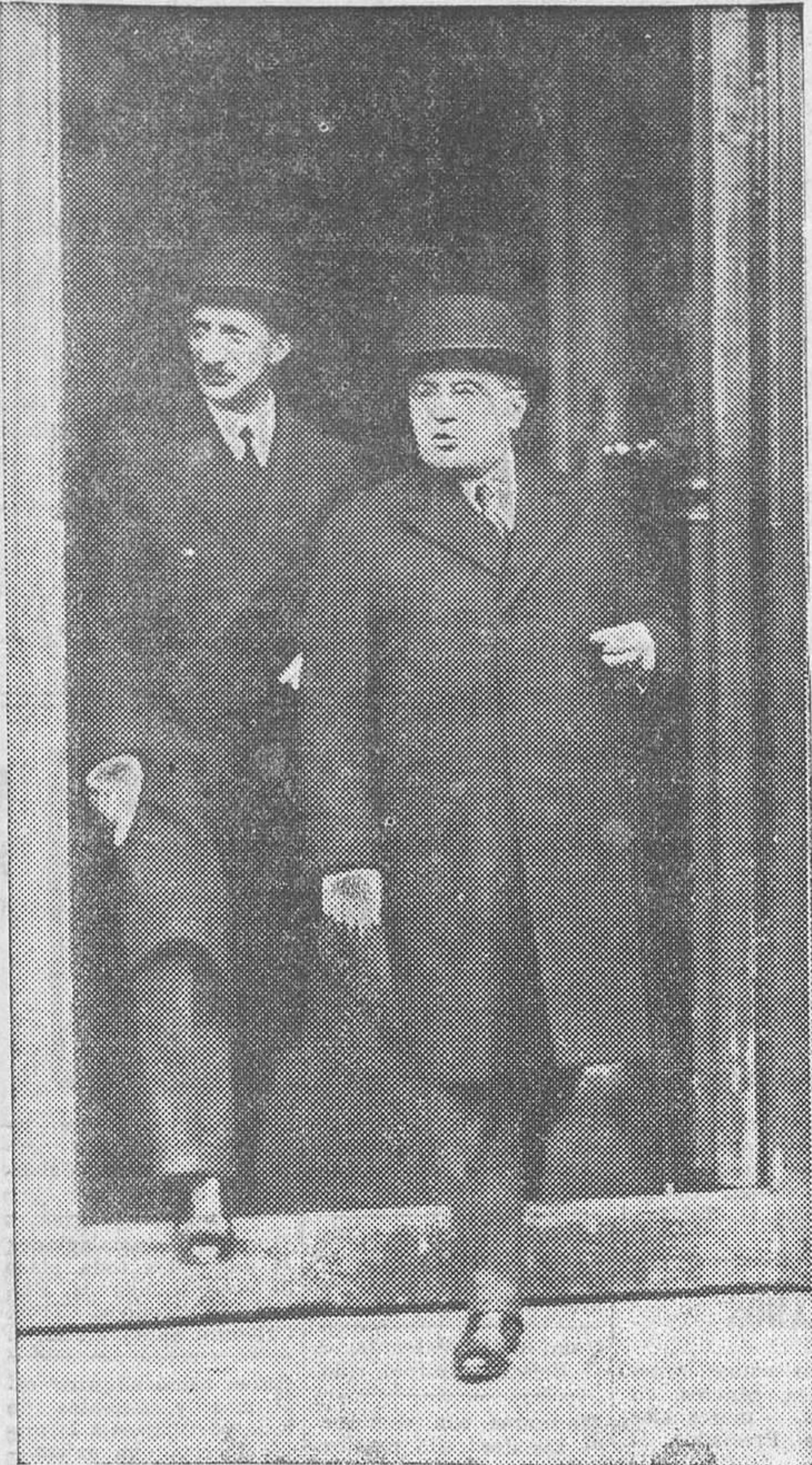
Monsieur Sarraut, presidente del Consejo, y M. Georges Bonnet, ministro de Finanzas, de Francia, saliendo de la casa mortuoria de Painlevé