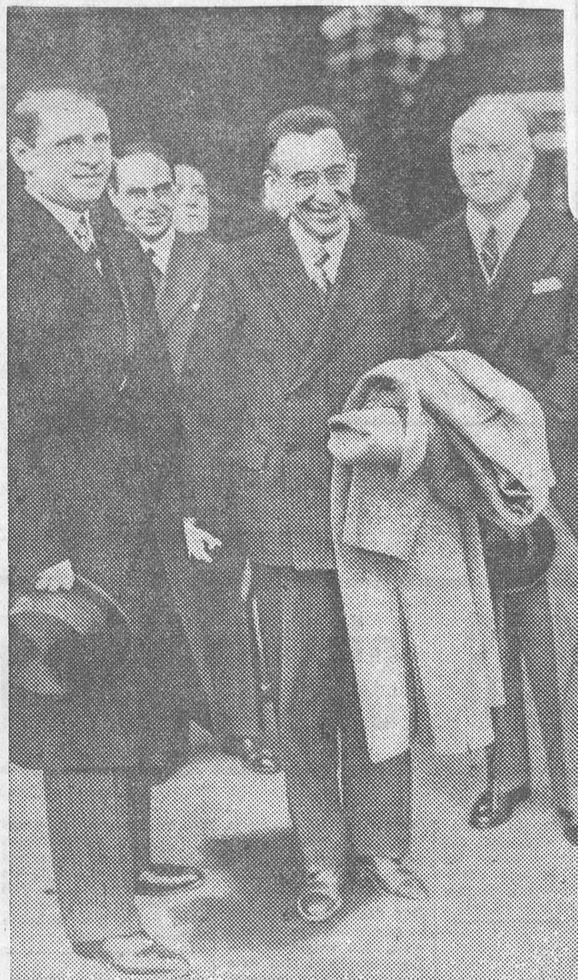
El nuevo embajador de España en Alemania, D. Luis de Zulueta, al llegar a Berlín.