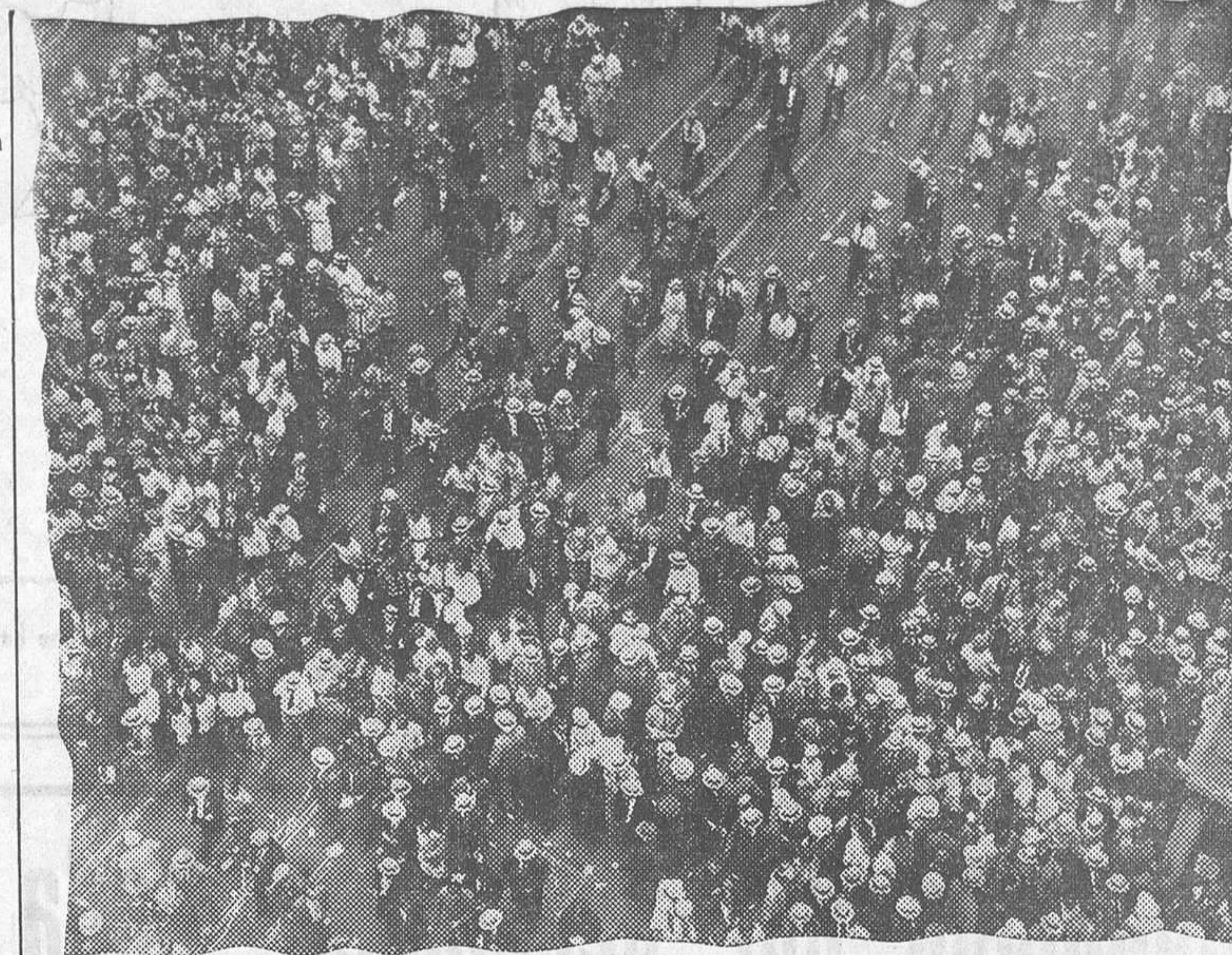
La multitud en las calles de Roma espera con ansiedad noticias del viaje de regreso de la escuadrilla de hidroaviones mandada por el mariscal del Atre, Balbo, y de la tripulación de los hidro.

ENTRENAMIENTO —Si, señor; nos hemos convertido al nudismo; pero mos decidido hacerlo poco a poco. (De «Marianne», de Paris)