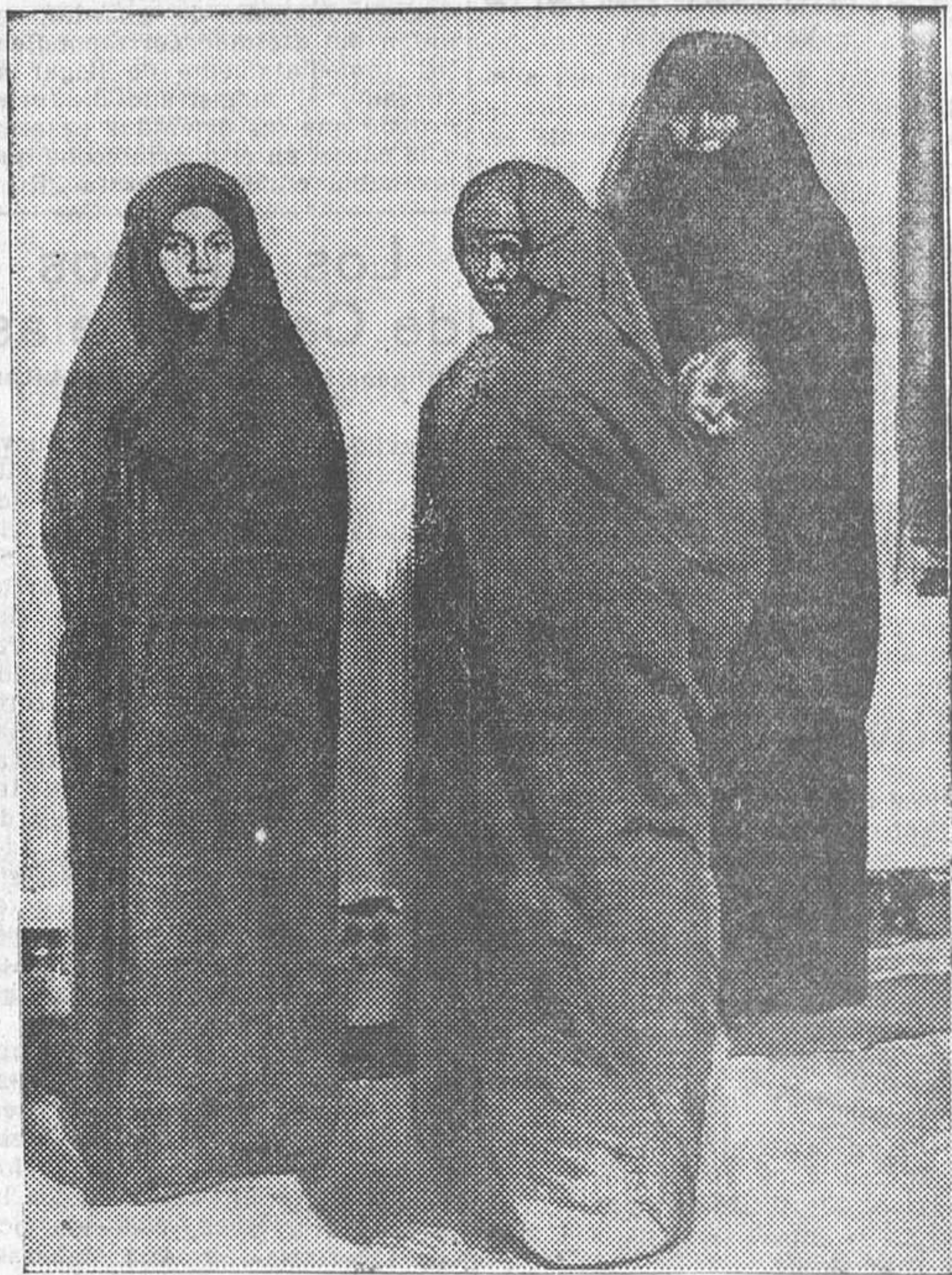
«Mujeres marroquíes», por Ortiz de Echagüe

—En la observación. El «camelo», la farsa, ha tenido uno de sus grandes apoyos en Italia, el más grande país del arte. La Exposición internacional de Venecia fué, me refiero a la última, a la que asistí y en la que tuve el