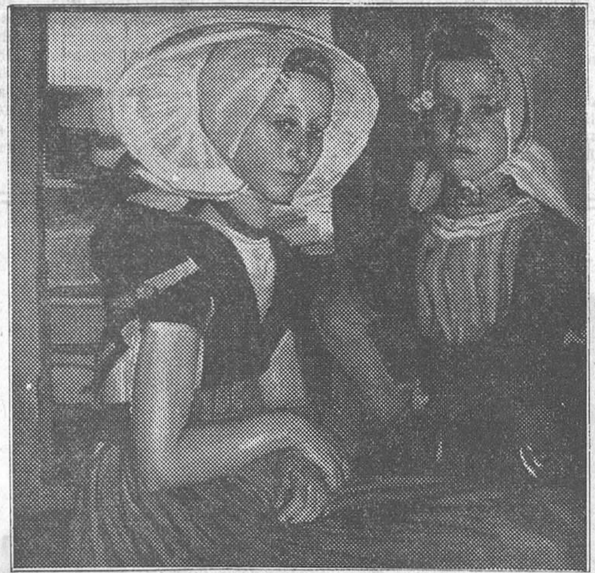
«Adeanas hilanderas», por Ortiz de Echagüe

«¿Bien está el derecho que tiene todo el mundo de pintar; pero no el derecho de exponer sus absurdos y de llamarse pintores!»