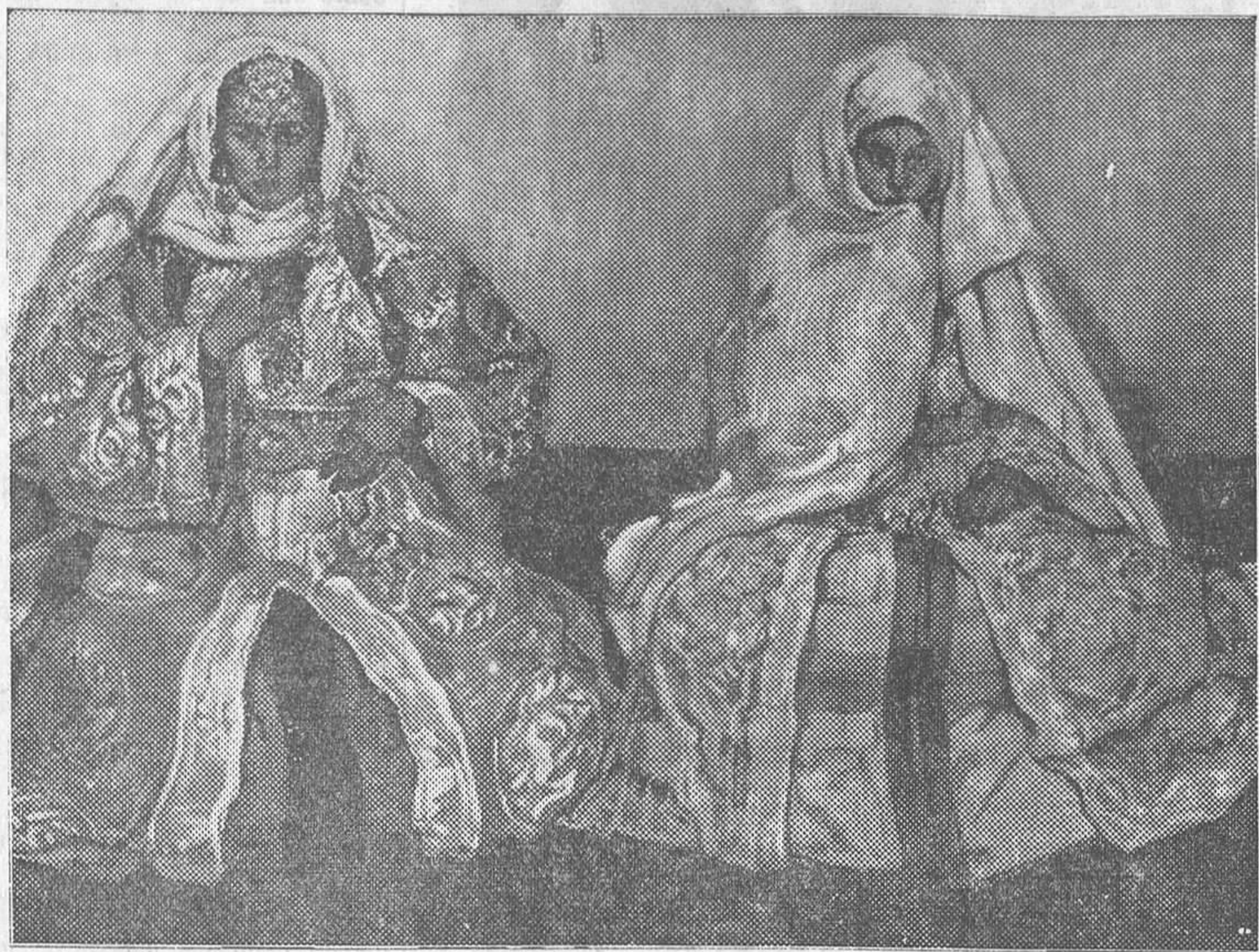
«Cortesanas de Fez», por Ortiz de Echagüe

CASA COLOMINA, Carrera de San Jerónimo, 1; teléfono 10490.