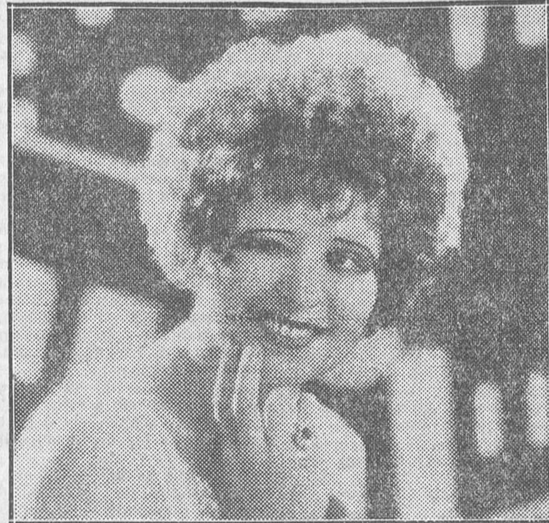
CLARA BOW, PROTAGONISTA DE «SANGRE ROJA», FILM FOX QUE EL MARTES SE ESTRENA EN EL BARCELO

Un film 100 por 100 Greta Garbo MARTES, ESTRENO Ultimos días de SUEÑO DORADO por LILIAN HARVEY y HENRY GARAT