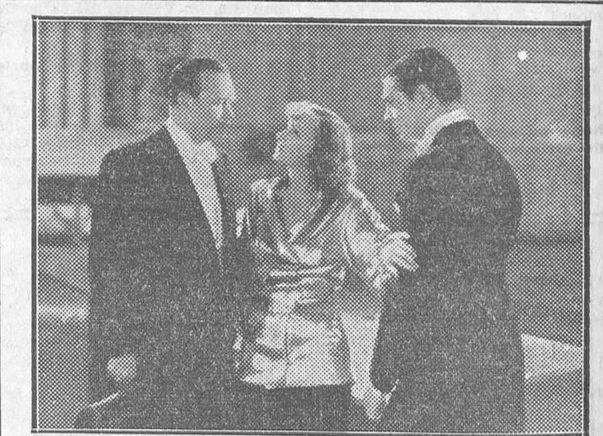
GRETA GARBO EN EL FILM DE LA METRO-GOLDWYN-MAYER «SUSAN LENOX», QUE EL MARTES SE ESTRENARA EN EL PALACIO DE LA MUSICA

La huelga de los alumnos de las Escuelas Normales Nos ruegan la publicación de la nota siguiente: «La Asociación Profesional de Estudiantes del Magisterio (F. U. E.), de la Escuela Normal del paseo de la Castellana, número 71, en junta general extraordinaria, celebrada en la mañana de hoy jueves para tratar de su posición ante la huelga planteada durante cuarenta y ocho horas por los alumnos del Curso Cultural, en apoyo de su petición al ministerio de que se les otorgue el título de maestro según el plan 1914, con un curso de ampliación sobre los tres que abarca el período de Cultura general, ha tomado el siguiente acuerdo: Ver con profunda simpatía esta aspiración de nuestros compañeros, y en su apoyo realizar una visita al director general de Primera enseñanza con objeto de interesarle su rápida tramitación. Realizada en el día de hoy esta visita, y habiendo escuchado de