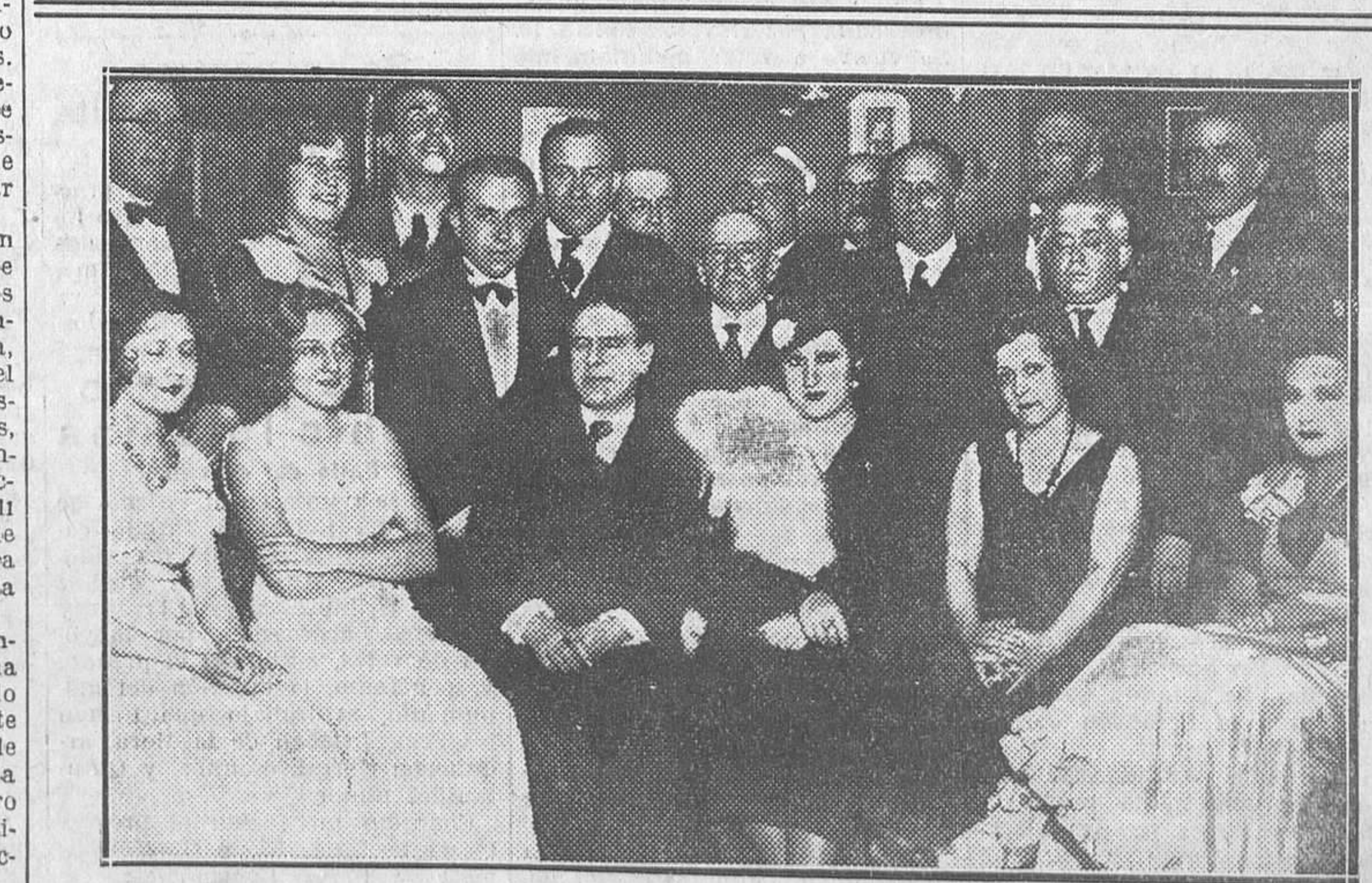
HOMENAJE A PEDRO DE REPIDE.—El ilustre cronista de Madrid, Pedro de Répide, con Miguel Fleita y otros artistas y escritores que tomaron parte en el homenaje que la Peña Fleita ha tributado al eminente literato para celebrar la distinción de que le ha hecho objeto la Fundación francesa Victor Hugo