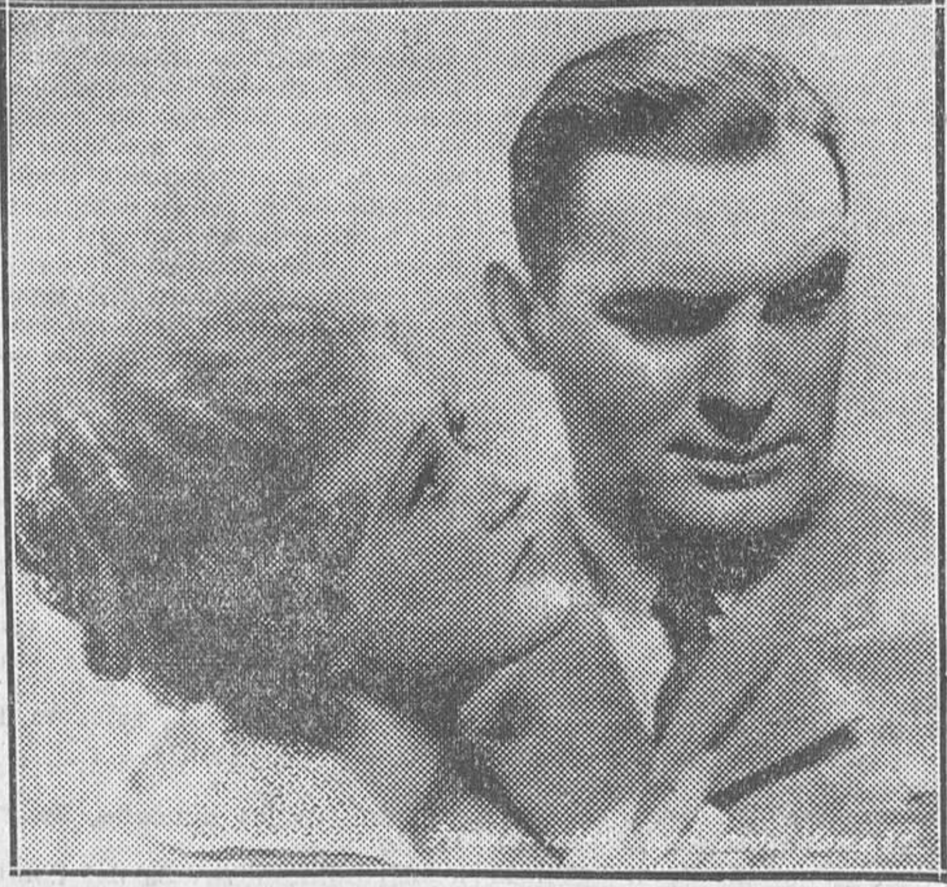
UNA ESCENA DE «UNA MUJER PERSEGUIDA», QUE EL MARTES SE ESTRENARA EN EL ASTORIA

En los momentos más difíciles para la producción cinematográfica española, mientras se mendigaba la protección que el Estado debe y los Gobiernos regatean a la industria y al arte del cine nacional, Star Film abordó heroicamente la ardua empresa de filmar no una película de ensayo, una verdadera superproducción sin colaboraciones extrañas. El resultado fue esa hermosa película «El hombre que se reía del amor», que sobre sus muchos valores intrínsecos tiene el significativo y esperanzador mérito de servir de demostración de que en España, y por españoles, pueden hacerse excelentes películas. Para cuantos hemos proclamado inútilmente esta verdad durante tanto tiempo, para los profesionales y para el público, interesados en el florecimiento de un cine nacional, el ejemplo de Star Film debe servir de satisfacción y debe avivar la esperanza. Star Film ha hecho el milagro con sólo el talento de nuestros técnicos y el entusiasmo de nuestros artistas. Todos, desde el director al más modesto electricista y desde el autor hasta los desconocidos camarógrafos, merecen aplauso y gratitud. Por entenderlo así, recogemos la