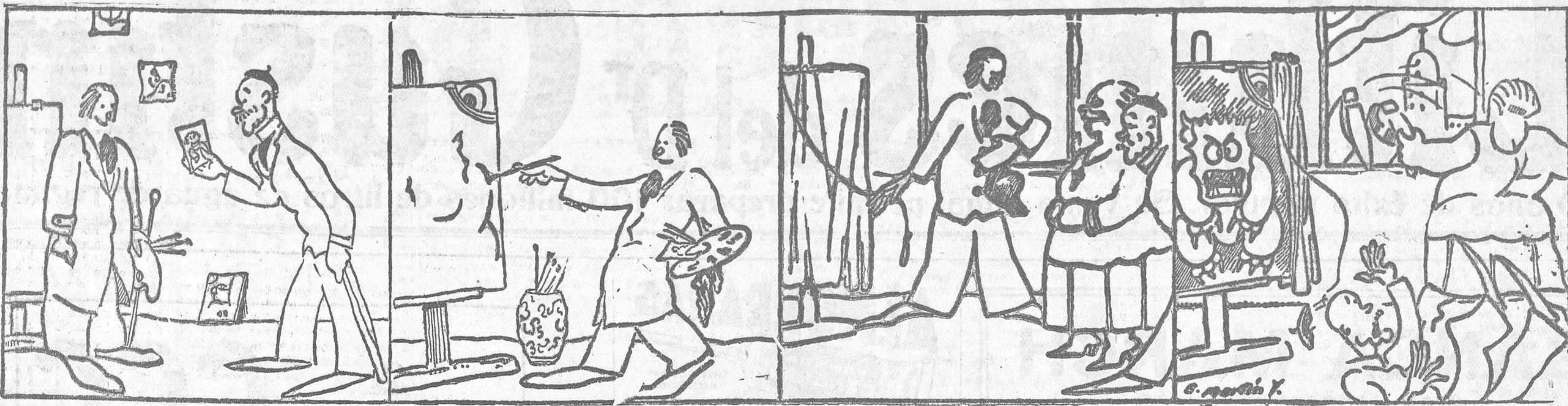
—Quiero que me haga un retrato de esta fotografía de mi mujer. Es para darle una sorpresa el día de su cumpleaños.