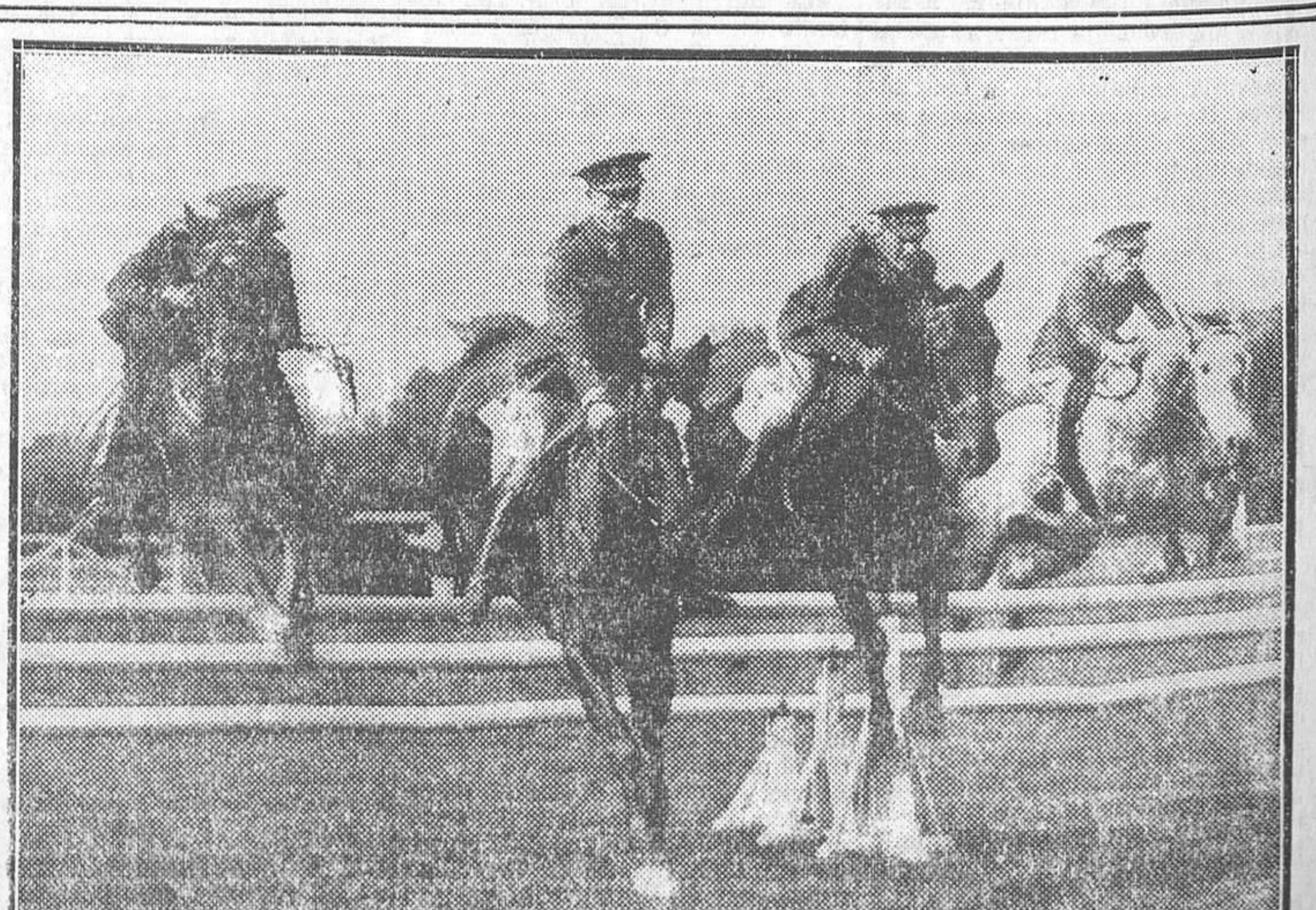
EL CONCURSO HIPICO QUE SE CELEBRA EN MADRID.—Un momento del salto de triple barra por cuatro jinetes