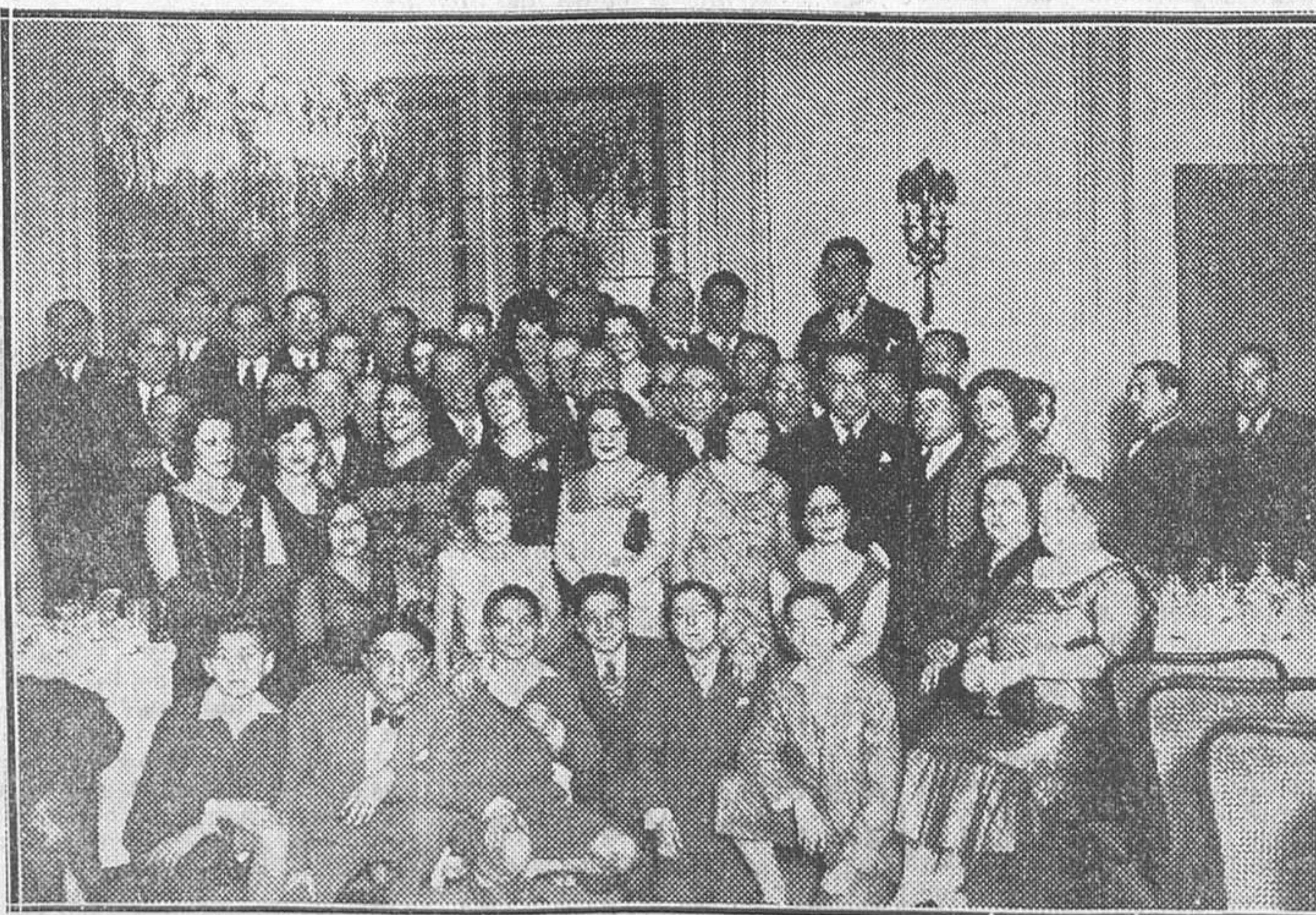
Fiesta de homenaje a los intérpretes de la famosa obra de Pérez de Ayala, escenificada por Martín Galeano y López de Carrión, «A. M. D. G.»

Yo no creo—afirma—en la indisciplina del partido radical socialista, y así lo ha probado con su actuación parlamentaria, perfectamente concordante con los principios que lo informan. Para hablar de indisciplina es preciso comprender bien el significado de la palabra «disciplina», que no es otra cosa que la norma ideal que la preside. El impulso juvenil puede haberle dado esa forma exterior que algunos han titulado «jacobinismo». Este no es una norma. Tal vez sea conveniente, en determinados momentos, para vencer obstáculos insuperables que obli-