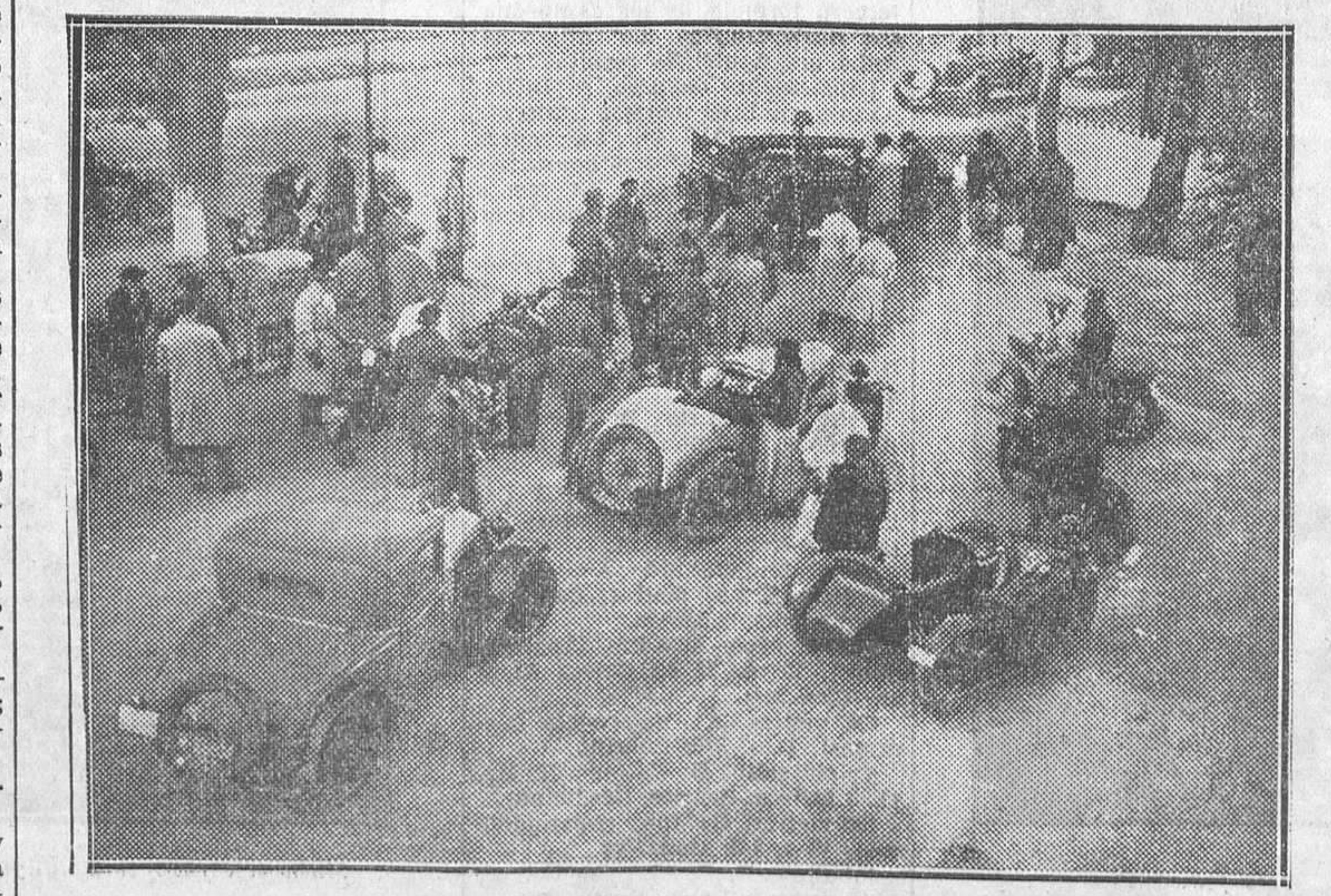
Preparativos para las carreras de regularidad de «motos» celebradas el domingo

Negociaciones de que mañana daremos cuenta al lector.—FRIKI.