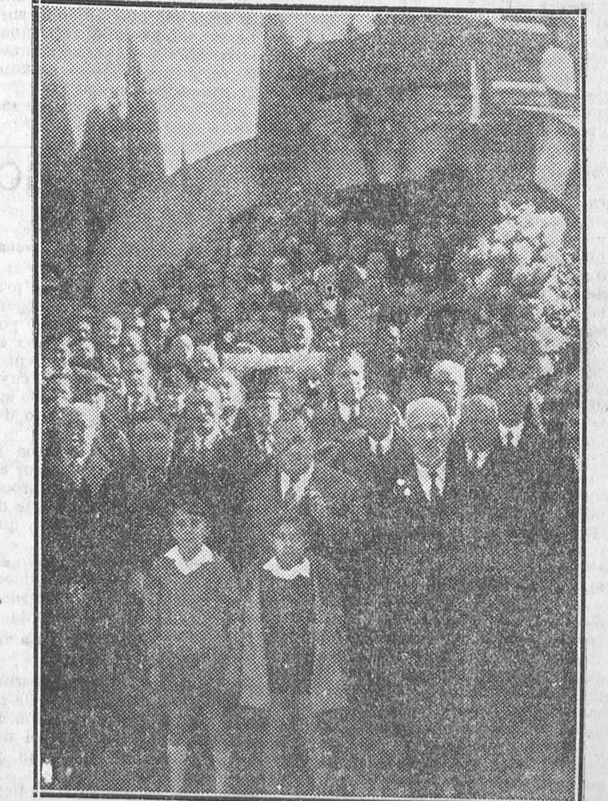
HOMENAJE A LA MEMORIA DE PI Y MARGALL.—Manifestación ante la tumba del ilustre republicano.