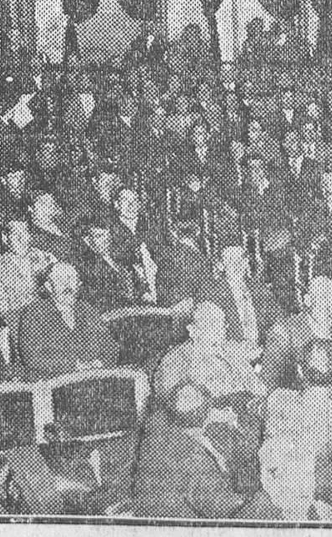
Asamblea del partido radical, en el teatro Maria Guerrero

El subsecretario de Gobernación, al recibir a los periodistas, dijo: —El gobernador de Vizcaya me