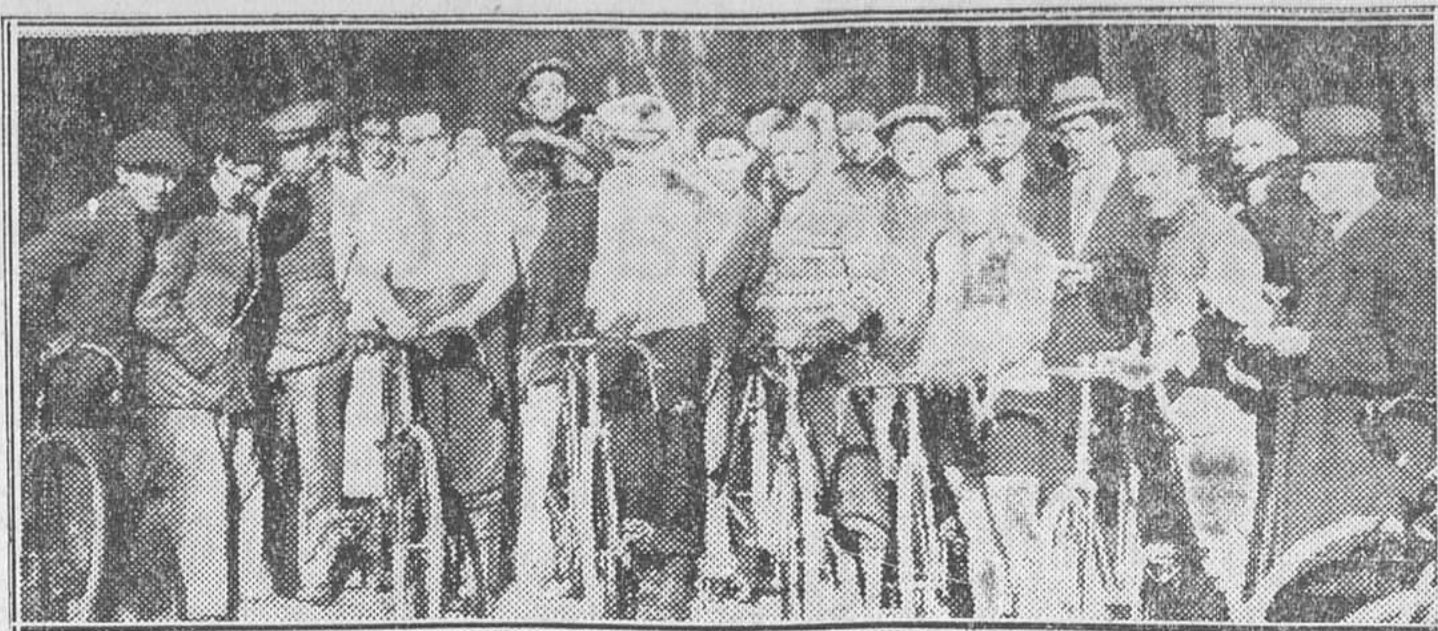
Grupo de participantes en la carrera ciclista de veteranos de la U. V. E., celebrada el domingo

Se forma una gran caravana de automóviles y motos. El recorrido a realizar era: Chalet del Moto Club, por Aravaca, Pozuelo, Húmera, Campamento, Carabanchel y Leganés, a Getafe,