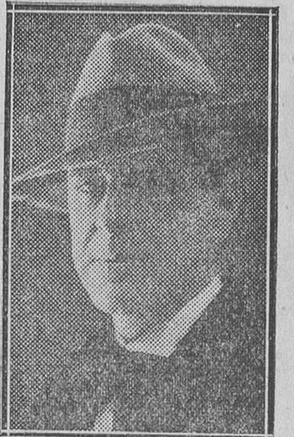
Pedro de Répide