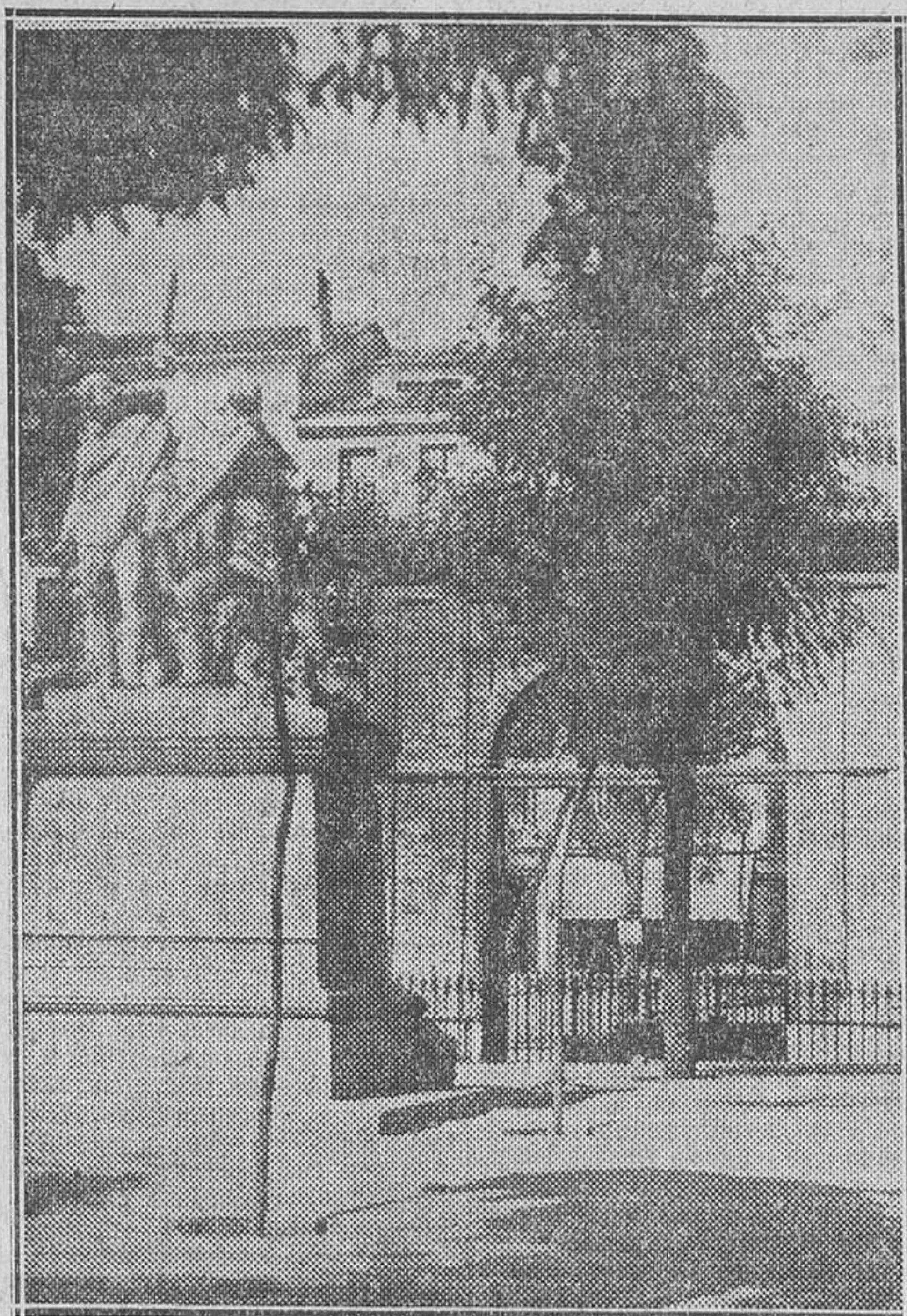
El grupo escultórico de Daoiz y Velarde, que ha sido trasladado de los jardines de la Moncloa a la plaza del Dos de Mayo, lugar más adecuado para perpetuar la memoria de los dos héroes de la Independencia