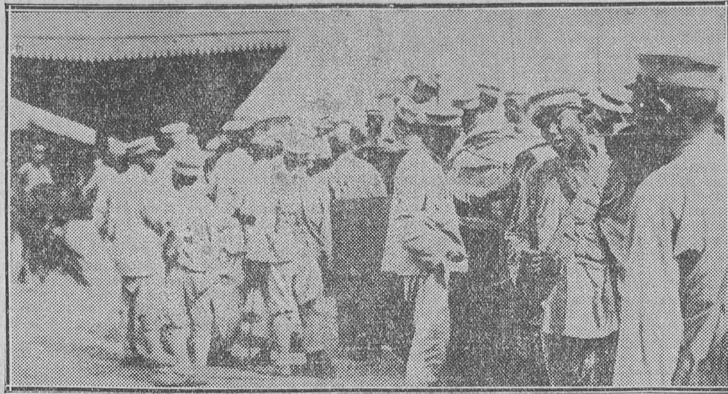
EL CONFLICTO CHINOJAPONES.—Movilización de tropas chinas