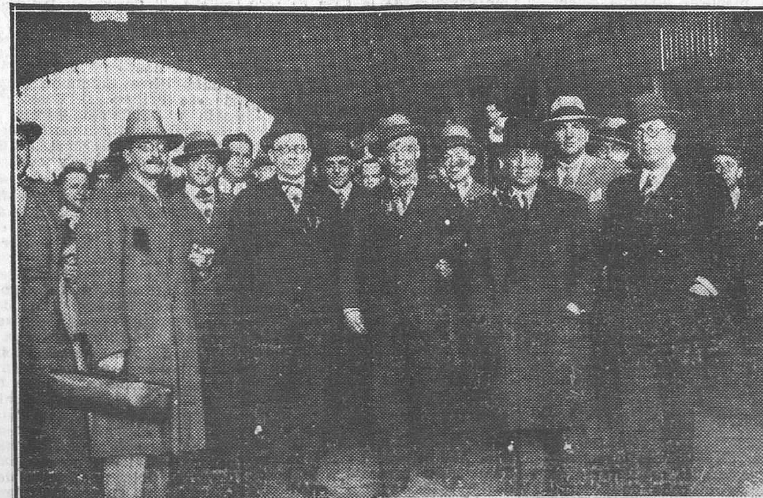
Llegada a Madrid de D. Gabriel Alomar, recibido por los ministros de Fomento y Economía y el gobernador civil.

Rogamos a los colegas que cuando reproduzcan nuestros trabajos mencionen su procedencia