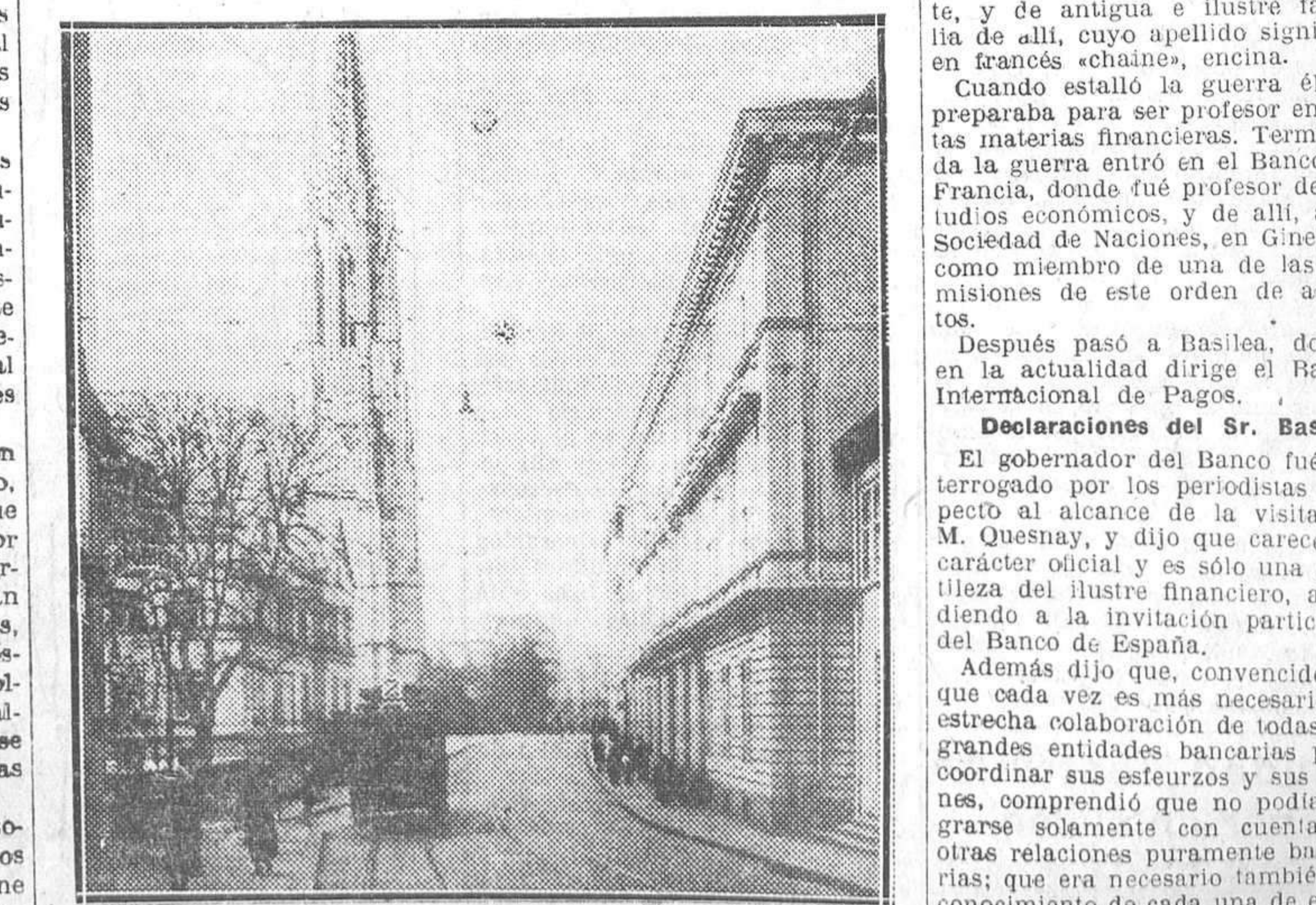
En una calle burguesa y tranquila de Basilea tiene su sede el Banco Internacional de Pagos