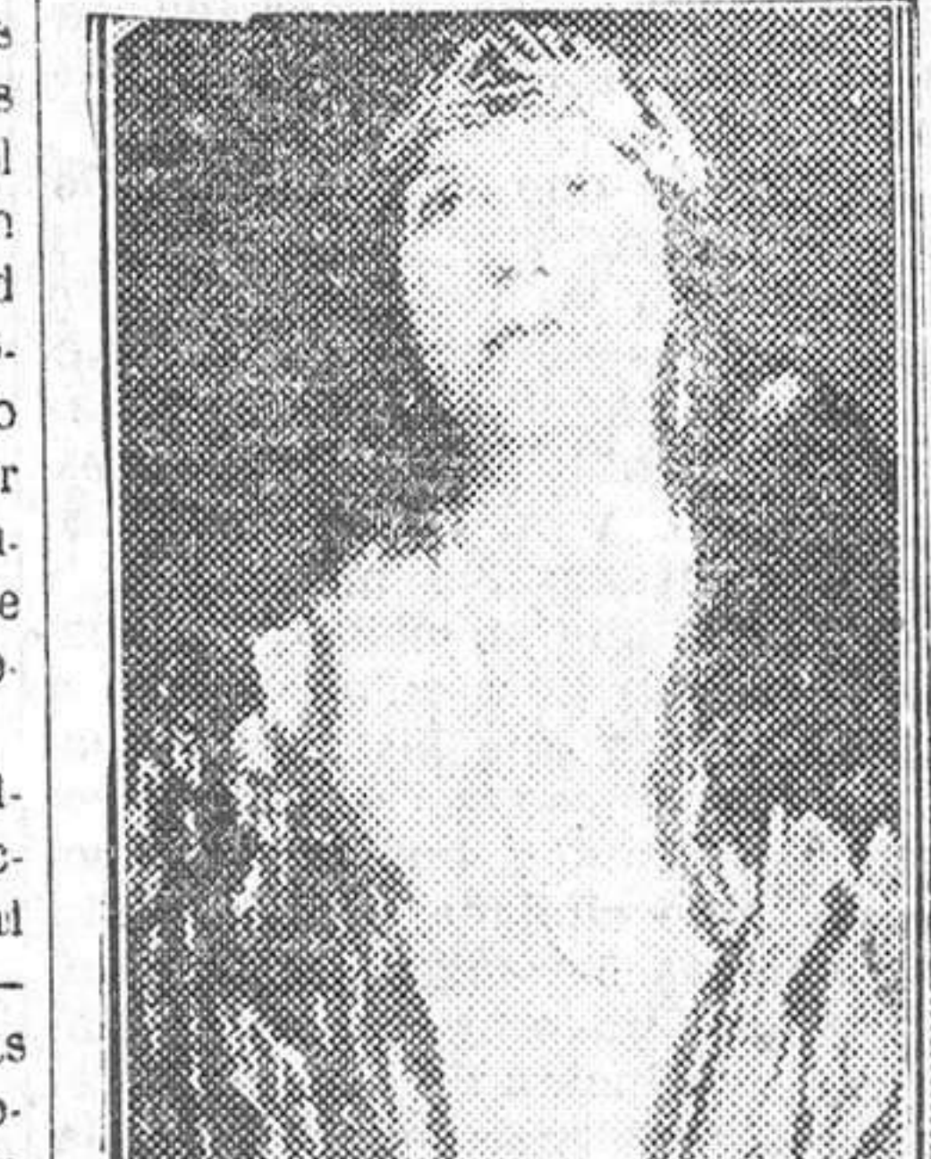
La famosa cantante Nellie Melba

Londres, 13.—Comunican de Melbourne que la famosa «prima donna» señora Melba ha sido desembarcada del transatlántico «Catho» y trasladada en una ambulancia al hospital, en donde los médicos han diagnosticado que su estado es de suma gravedad.