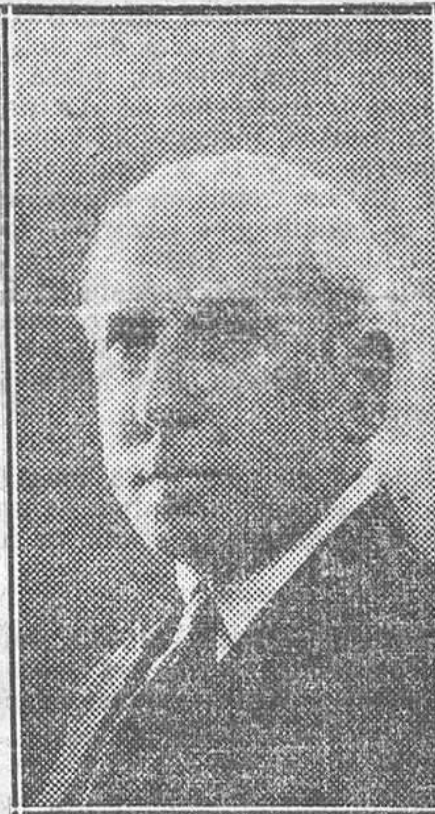
Eduardo Zamacois, el gran escritor, autor de «La risa, la carne y la muerte», una de sus obras de más resonante éxito

C. I. A. P. Librería Fernando Fe, Puerta del Sol, 15