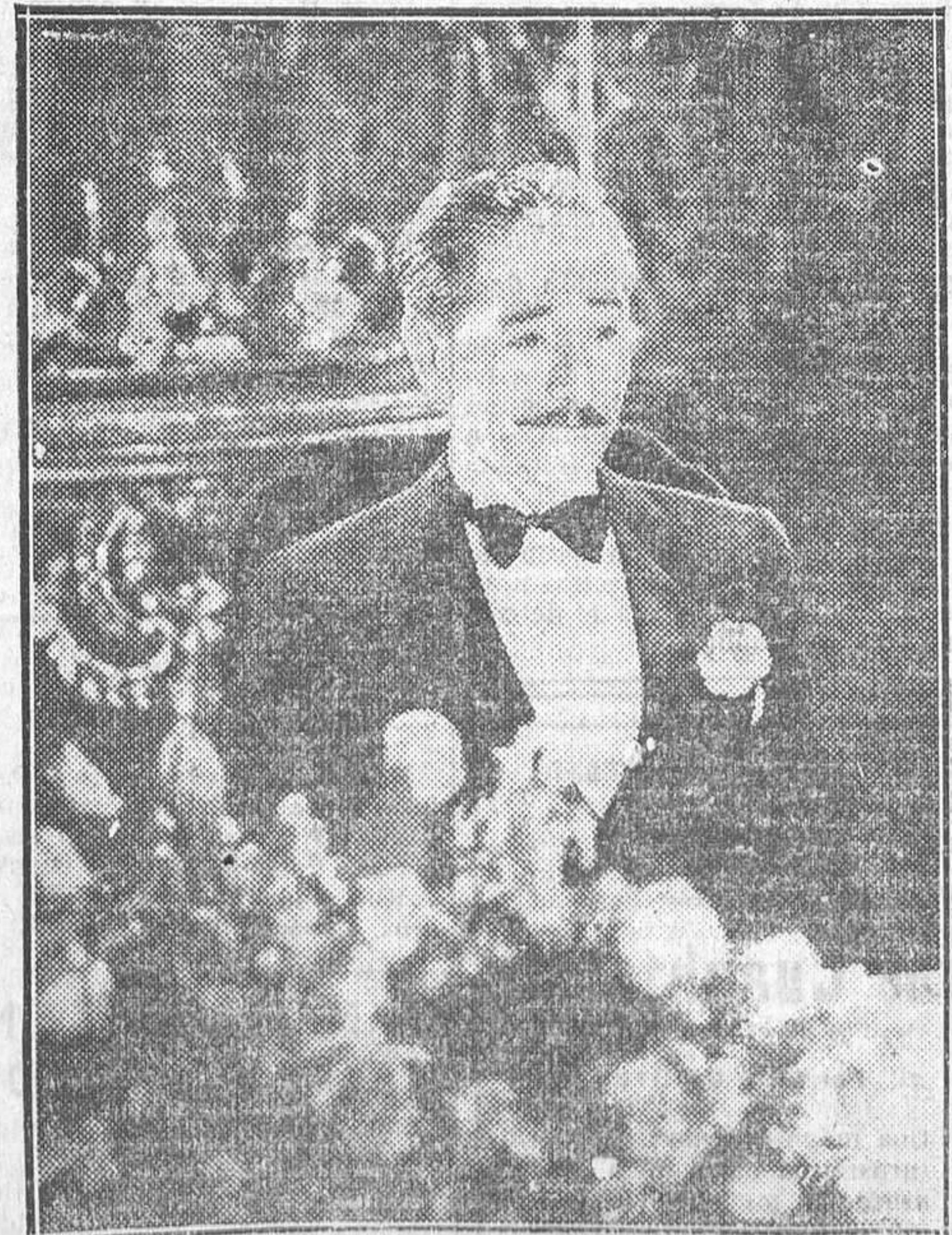
ADOLFO MENJOU, EL GRAN ACTOR DE LA PARAMOUNT, PROTAGONISTA DE AMOR AUDAZ. TODO HABLADO EN CASTELLANO QUE SE EXHIBE EN EL CALLAO