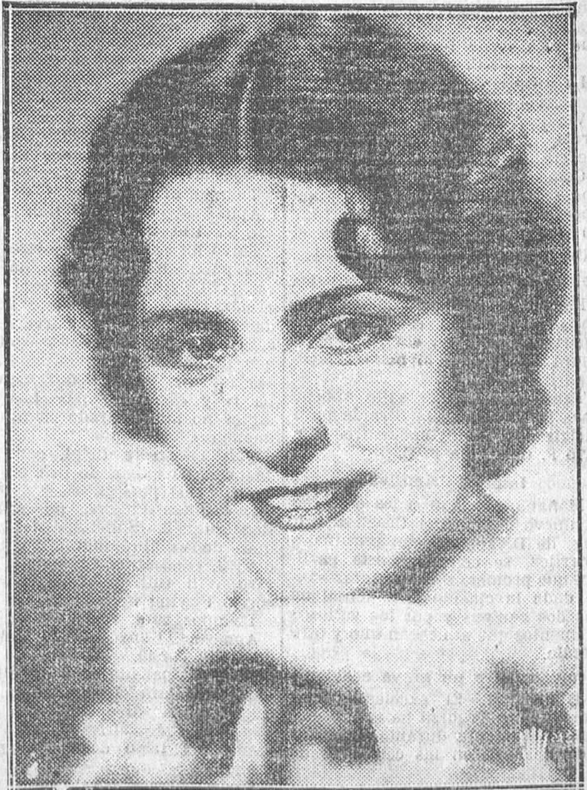
IMPERIO ARGENTINA, «ESTRELLA» ESPAÑOLA, INTERPRETE DE LA PELICULA DE RENAISSANCE FILMS «EL PROFESOR DE MI MUJER», QUE SE PROYECTA EN EL REAL CINEMA