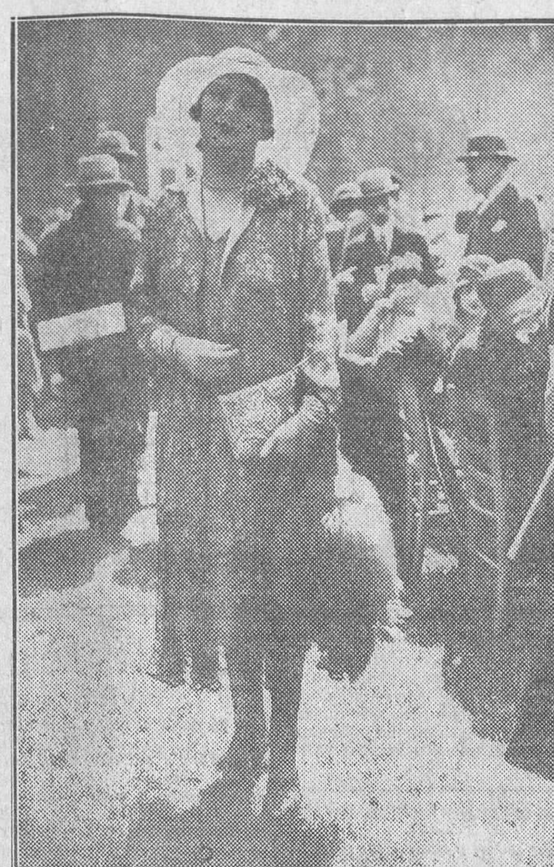
La moda en Paris