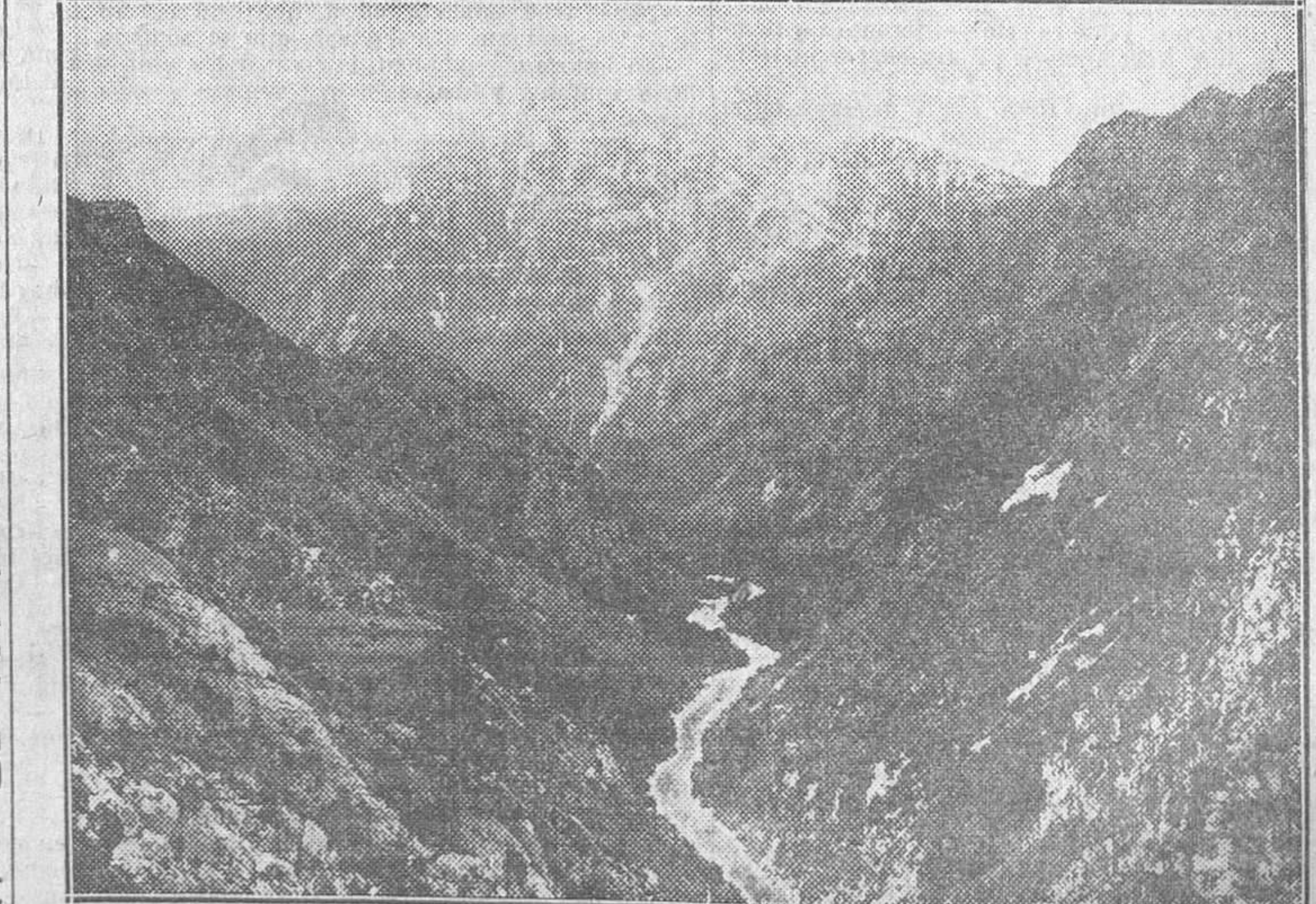
Pintorescas gargantas del Yerdon, cuya grandiosidad no tiene que envidiar las bellezas naturales del Arizona y el Colorado

será un folletón que nuestros lectores seguirán con expectación y deleite.