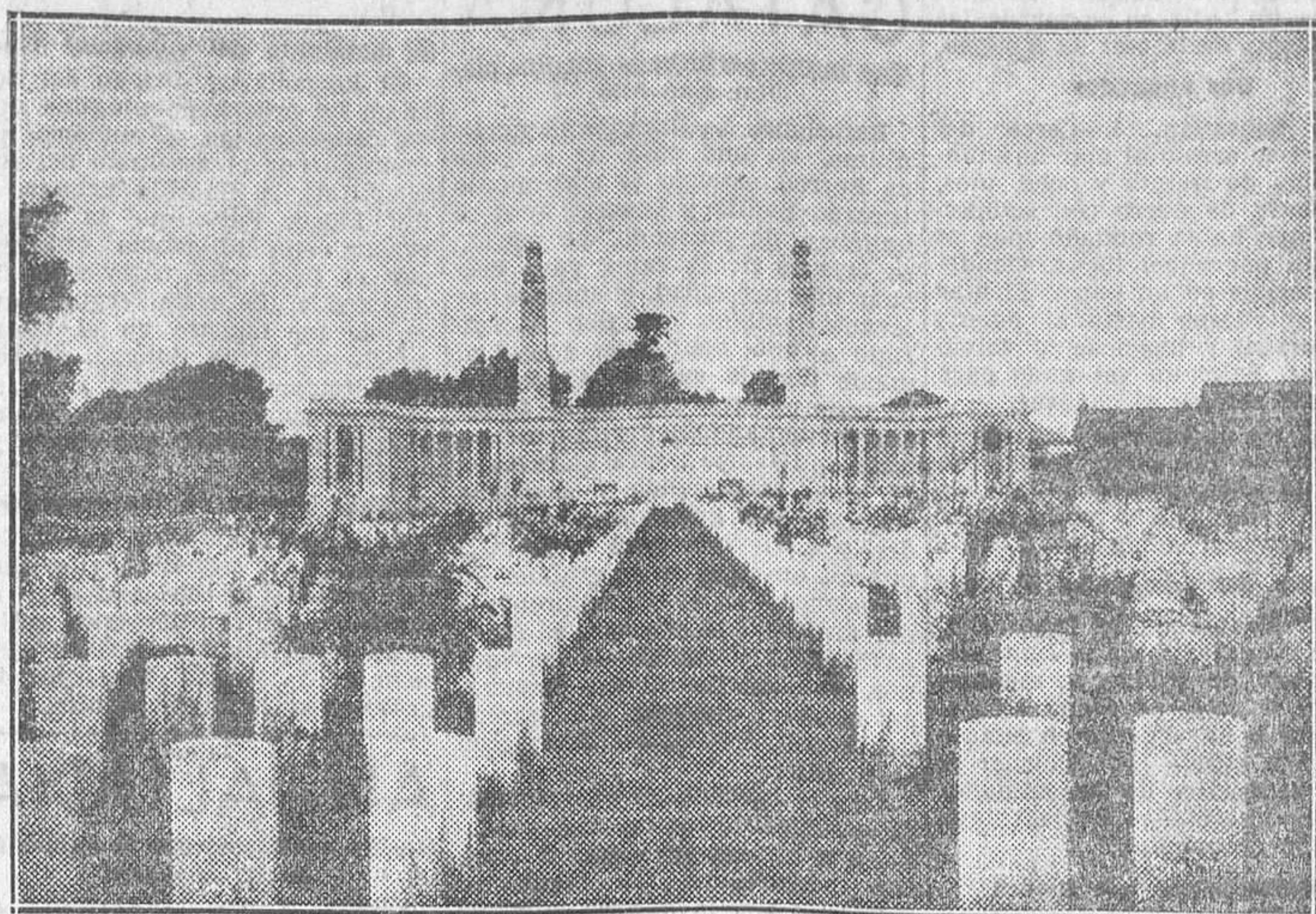
Monumento erigido a los soldados ingleses muertos por el enemigo en Artois, y cuya inauguración se efectuó el 2 de Agosto actual, bajo la presidencia del ministro de la Guerra inglés

F. FERNANDEZ ARMESTO Berlín, Agosto, 1930.