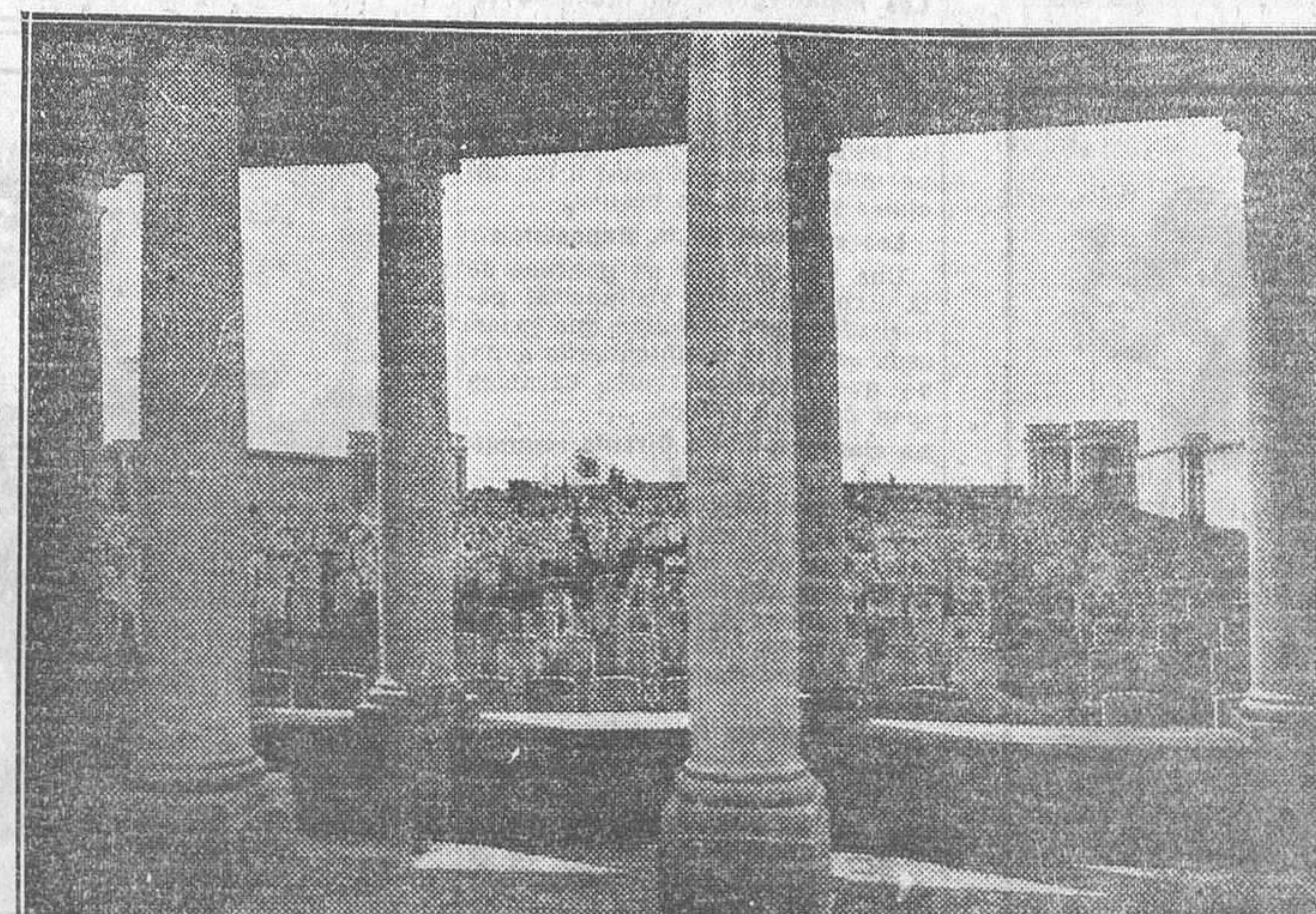
Vista del cementerio inglés desde el monumento erigido en Gohelle a la memoria de los soldados británicos caídos en Loos y Bethune y que no se pudieron identificar

La Amada penetra en el campo de las ruinas como un resplandor. En un instante retrocedemos treinta siglos, y nos transformamos en un absurdo anacronismo.