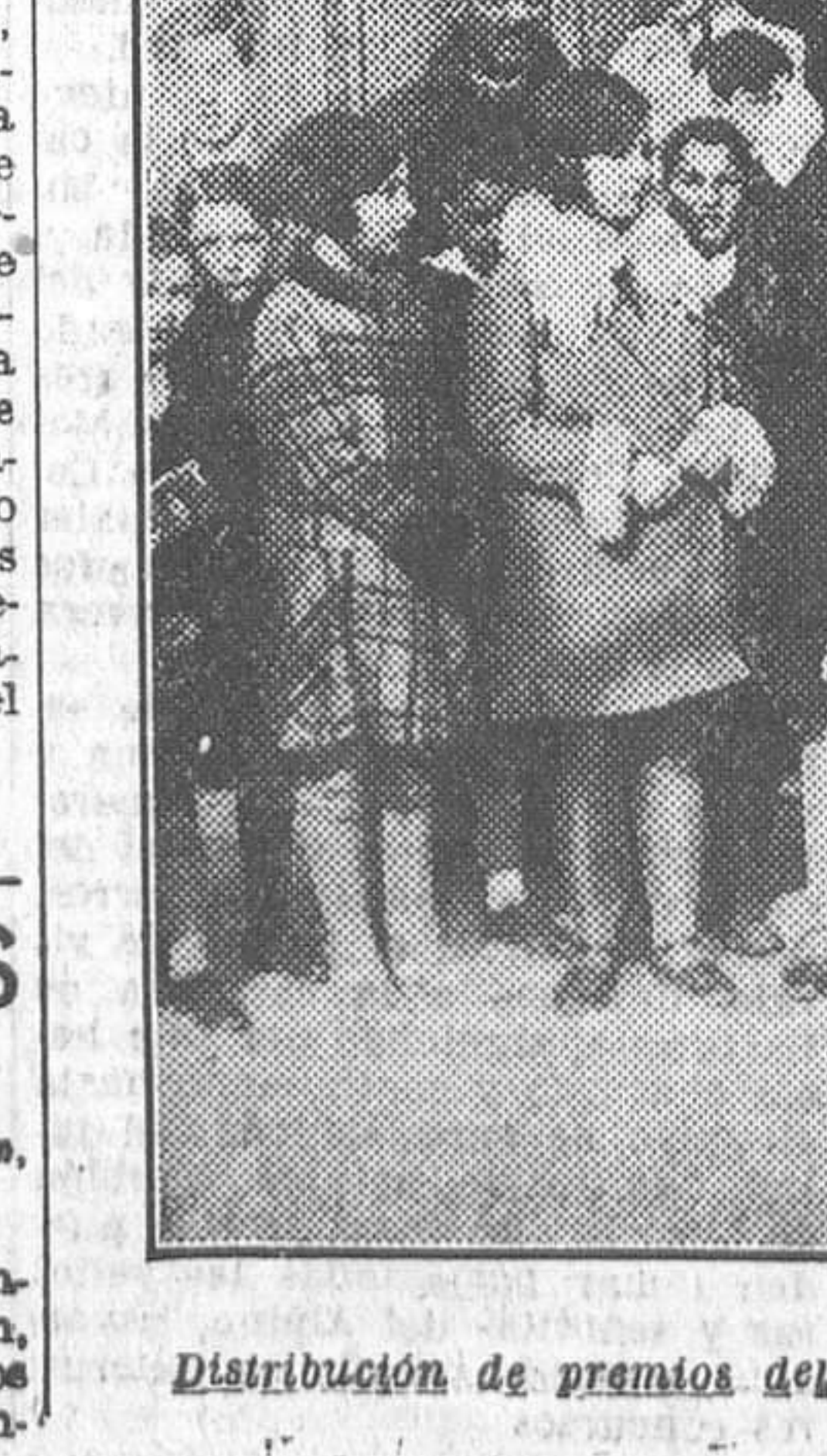
Distribución de premios del concurso organizado por la Sociedad Amigos del Niño, efectuado ayer en la Florida

Si las aguas del Mississippi siguen creciendo, los Estados de Illinois, Wisconsin e Indiana están amenazados por los afluyentes del Mississippi, que han empezado ya a desbordarse.