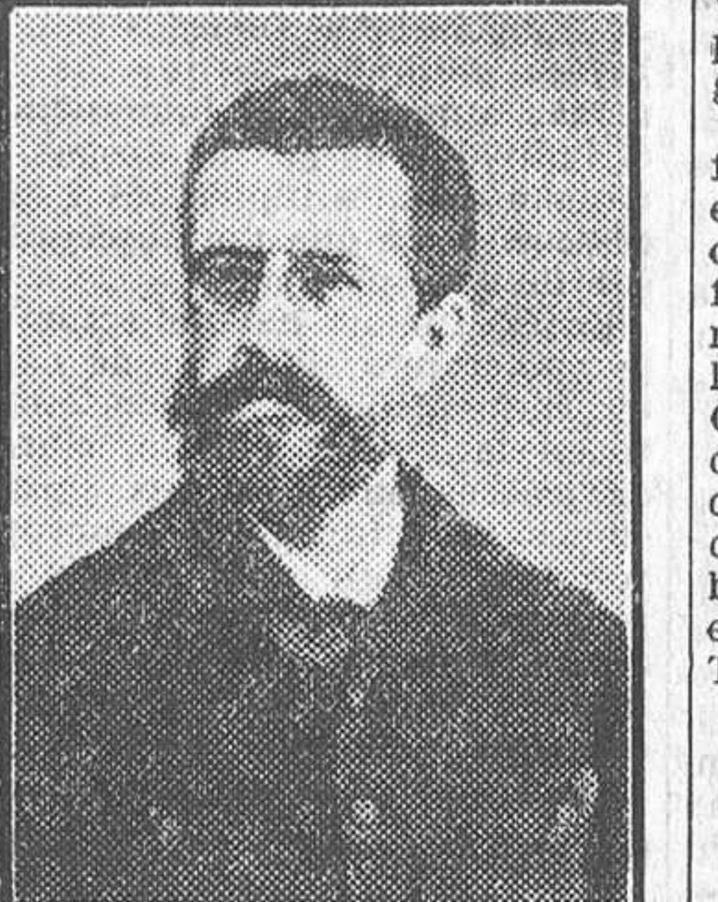
El ilustre saineiro Javier de Burgos

Si, como parece inevitable, las noticias propaladas por la Prensa, solicita siempre en recoger las últimas palpaciones de la actualidad, referentes a la próxima demolición del teatro de Apolo se confirman, dentro de poco de lo que fué, si no cuna, templo del género chico español—y bien pudiéramos decir que del arte lírico nacional, pues es lo cierto que lo chico superó muchas veces a lo grande—, no quedará más que un montón de recuerdos agrupados en las páginas de un libro—si alguien se atreve a llevar a cabo esta