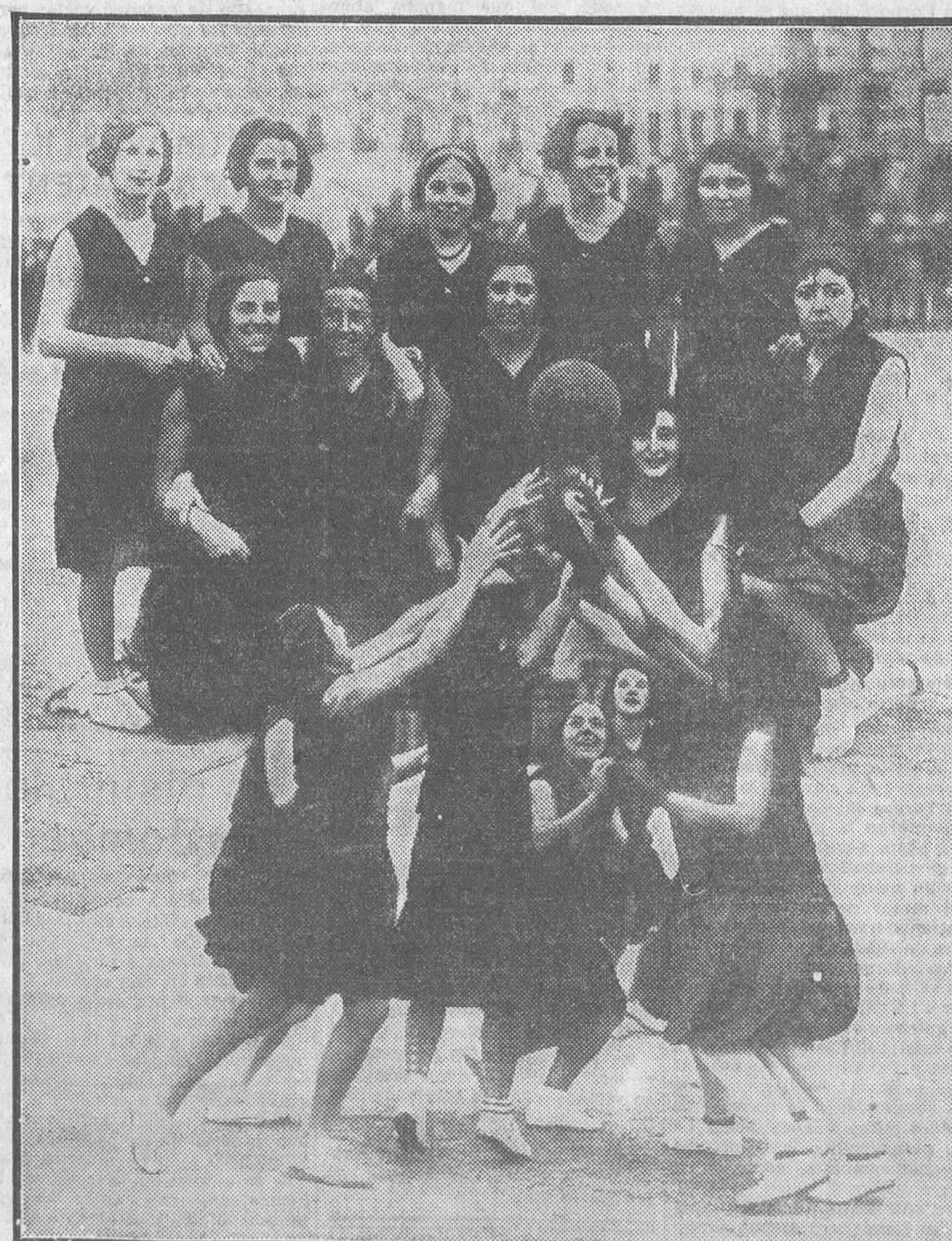
Los equipos femeninos de Ciencias y Filosofías de la Federación Universitaria. — Un momento del partido jugado ayer en el campo del Unión