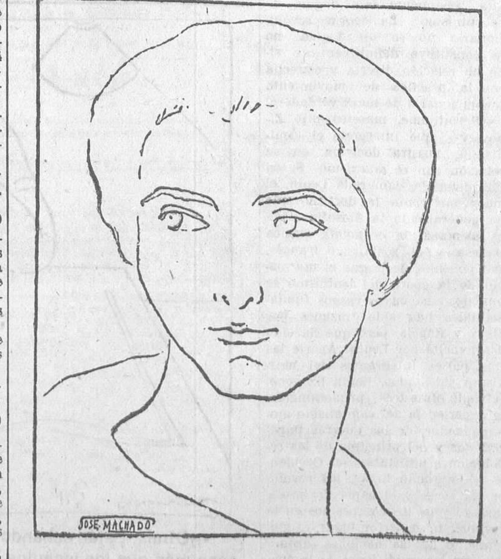
¿De quién es esta cara?