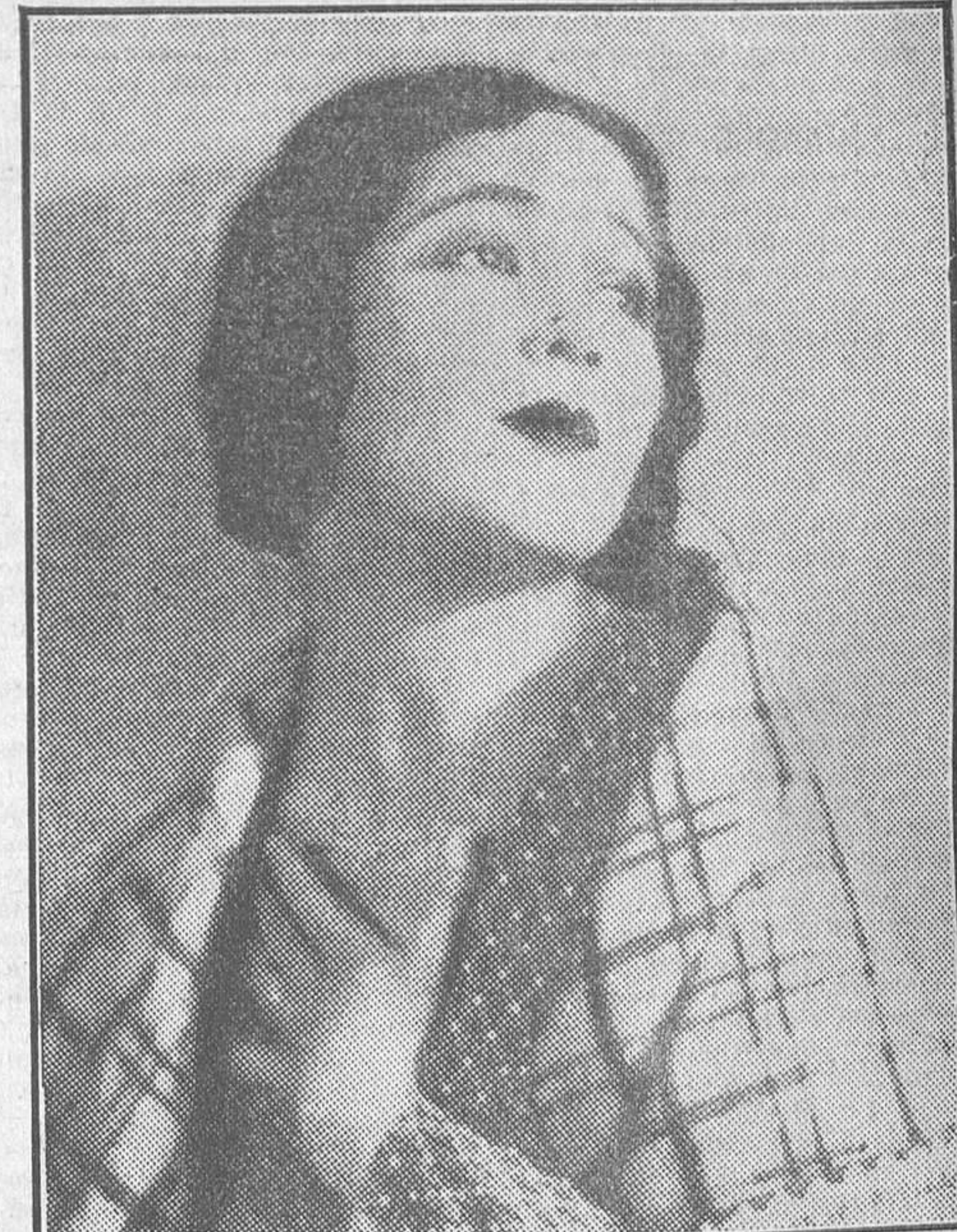
DOLORES DEL RIO, LA BELLA ACTRIZ MEXICANA, QUE PRONTO ADMIRAREMOS EN UNA EXCEPCIONAL PELICULA