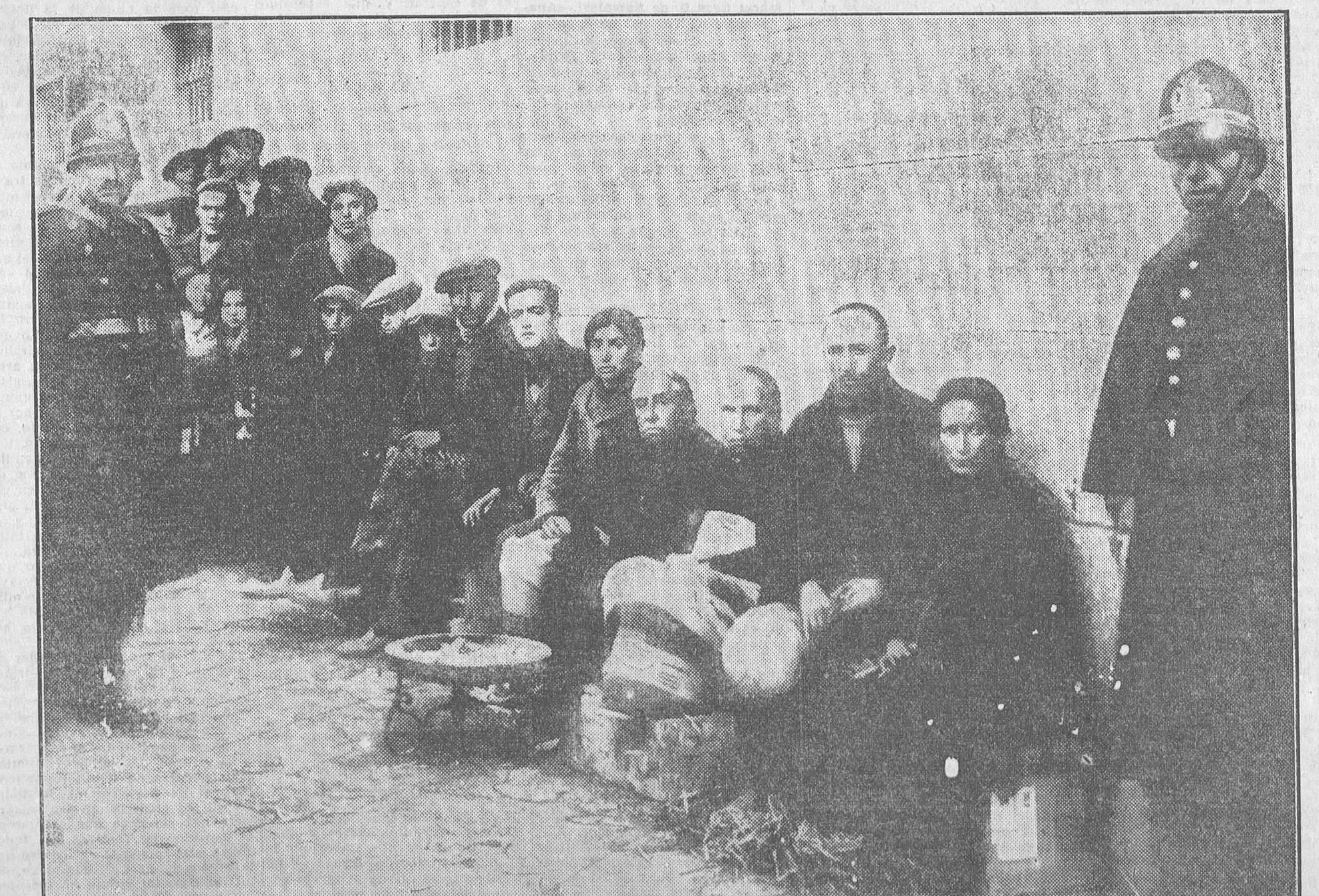
La «cola» a la puerta de la Casa de la Moneda, donde se celebrará hoy el sorteo de la lotería de Navidad

Moscú, 21.—Según los periódicos soviéticos, la subscripción al último empréstito industrial ha demostrado la enorme diferencia que existe entre la ciudad y el campo en lo concerniente a sus relaciones con el Gobierno de los Soviets. Mientras que en las ciudades las diferentes fábricas y organizaciones profesionales suscribieron 424 millones de rublos, la