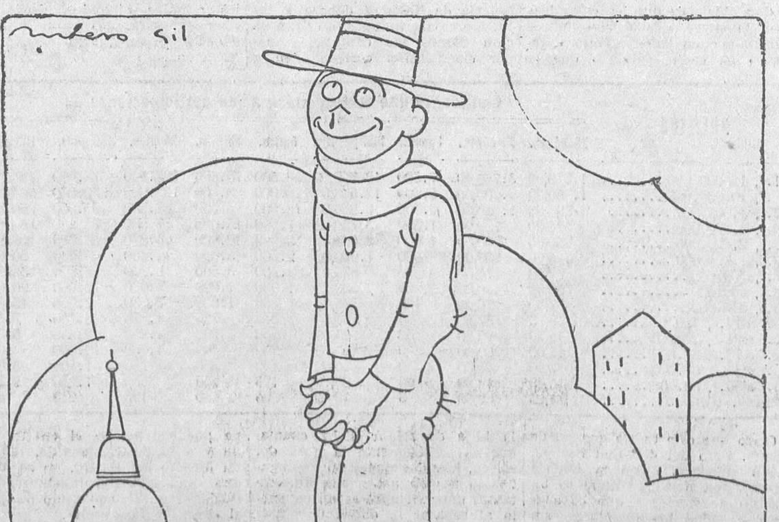
--Yo no aspiro más que al reintegro.

Roma, 21.—Comunican de Bordighera que a las cuatro de la tarde ha fallecido el general Cadorna.