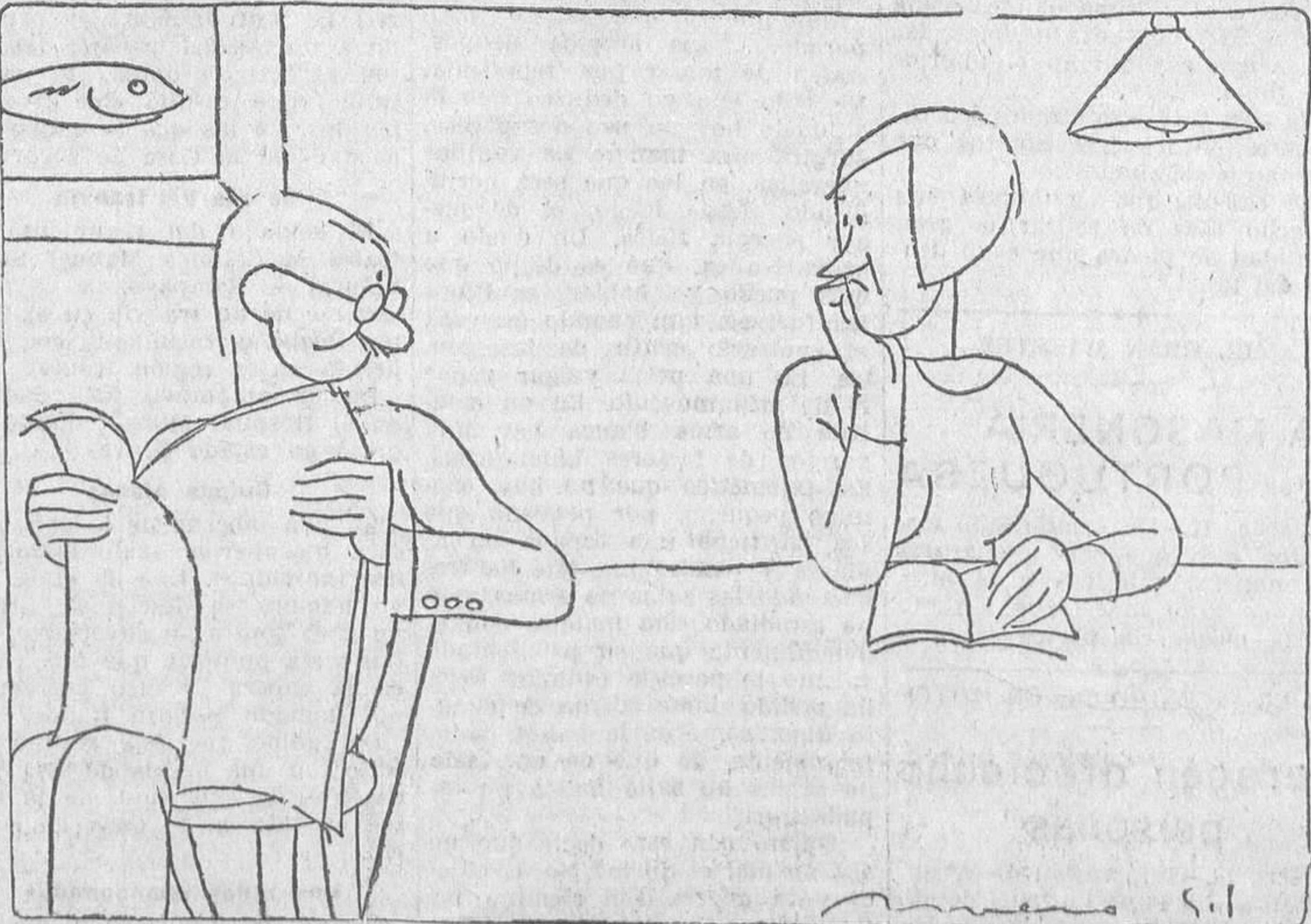
¡Pobre Hoover! El, que es partidario de la ley seca... ¿Y qué le pasa? ¡Que le están aguando la excursión...

En Nankín sólo quedarán tres divisiones modelo, cuya instrucción estará a cargo de treinta oficiales alemanes.