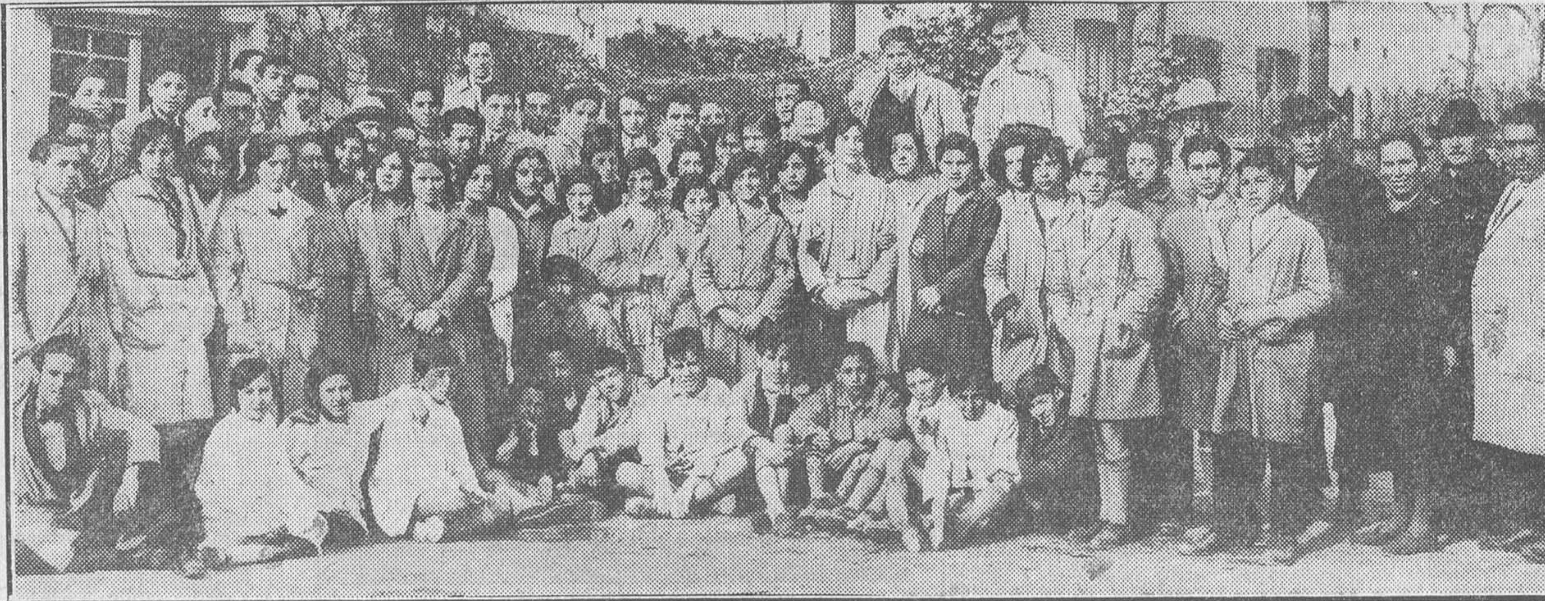
Los profesores y alumnos de la Escuela de Cerámica de Madrid

MALLORCA, isla dorada, de frondosos pinares, calas encantadas y cielo diáfano