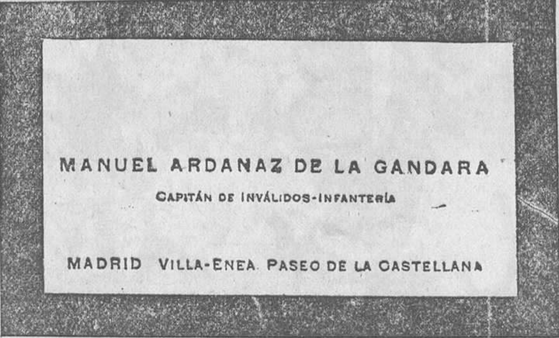
Una de las tarjetas que empleaba el estafador

A los pocos días, el distinguido estafador, para procurarse ingresos en efectivo metálico y fuera del radio del crédito, se apresuró a ofrecer a todas las amistades nacientes participaciones en un número del sorteo de Navidad completamente imaginario.