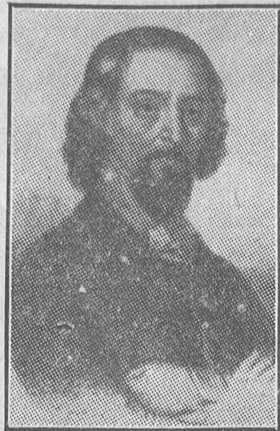
Don José Zorrilla, en la época en que escribió su famoso drama