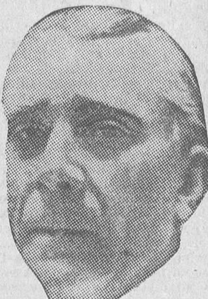
Fernando Díaz de Mendoza