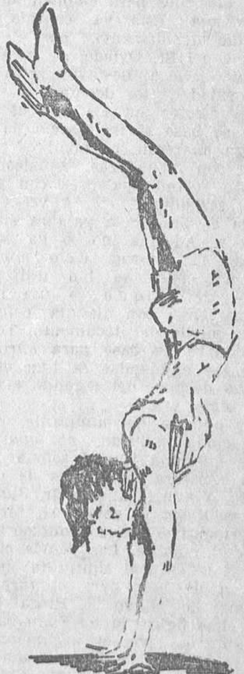
El saltador (Dibujos de Peñalver Jiménez)

—¿Cuándo es mejor el negocio, en invierno o en verano? —En verano, desde luego. En invierno, además del frío que pasamos por esos caminos y pueblos de Dios, tenemos que soportar ciertas condiciones de trabajo. Hemos de ir provistos de ma-