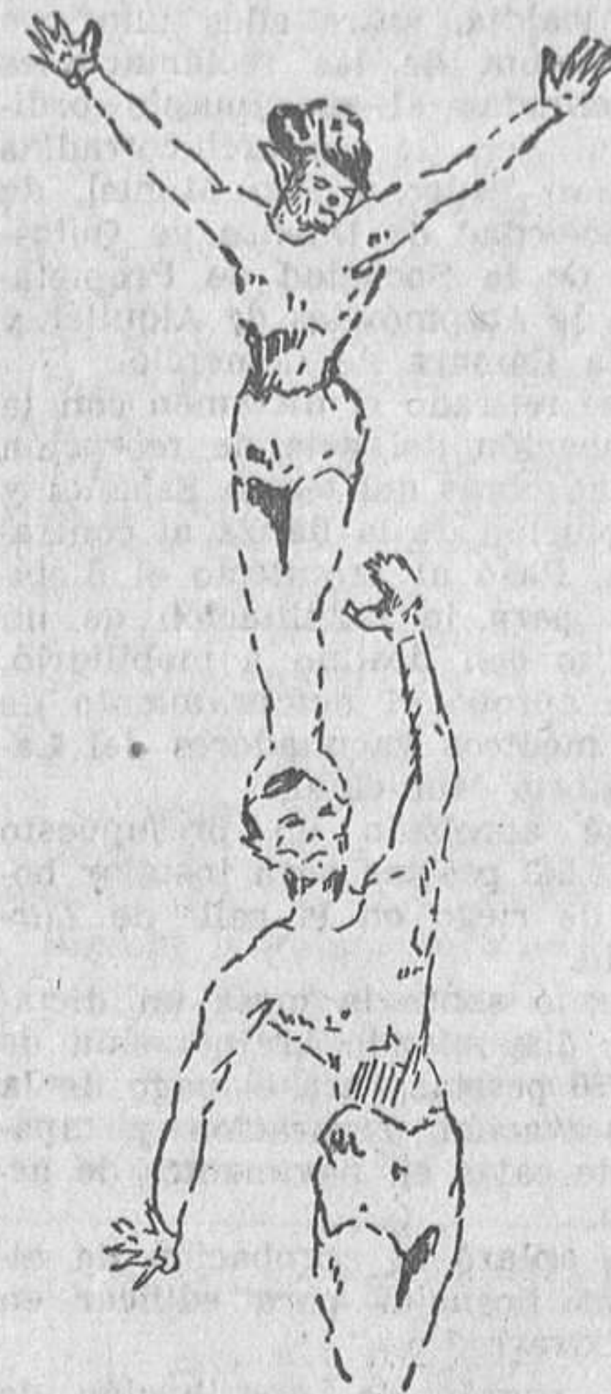
Un ejercicio difícil

—¡Unos minutos de silencio, señores! ¡Quiéren hacer el favor de guardar unos instantes de silencio?—grita un hombre con boina calada hasta las sienas. Se hace el silencio. A continúa-