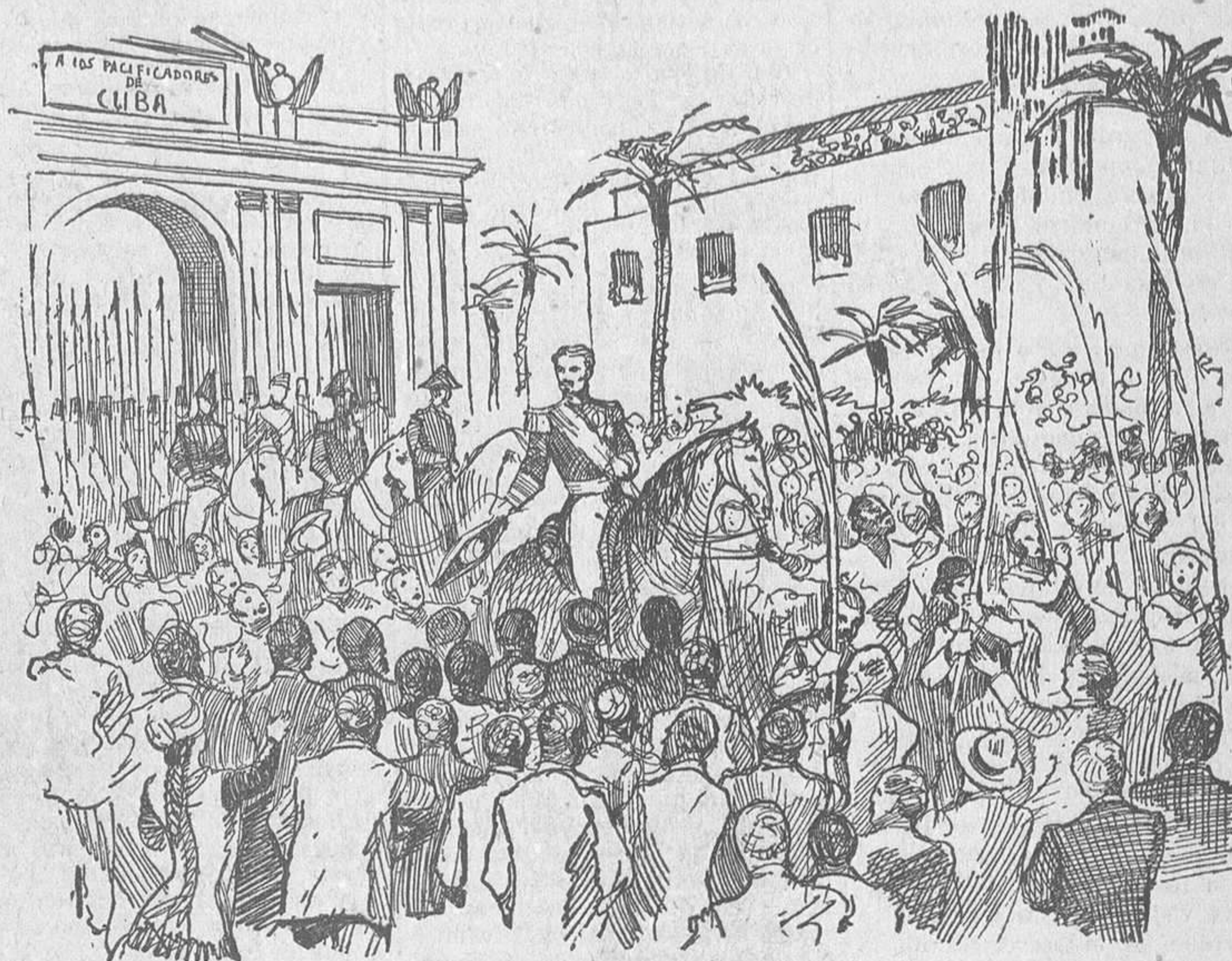
Entrada de Martínez Campos en La Habana, después de la pacificación de la isla de Cuba

—Daremos la comisión al marqués de Sardoal—concluyó el ex ministro de D. Amadeo de Saboya, afanzándose los espejuelos,