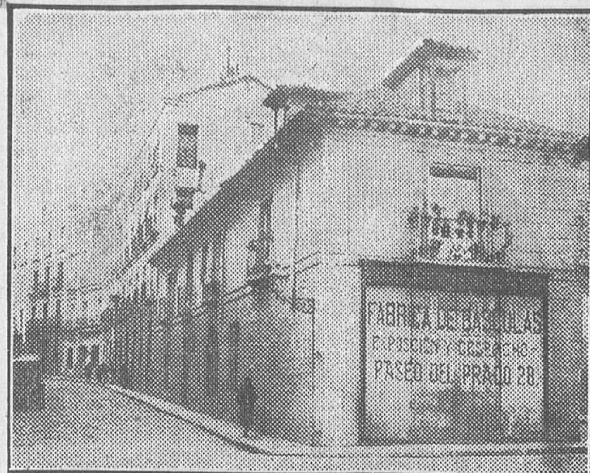
Casa de la Platería de Martínez, donde estuvo la imprenta de 'El Socialista' en los tiempos heroicos.

social, el socialismo, el mejoramiento de la clase obrera, etc., tenían efecto en Academias, Ateneos, Centros y Sociedades.