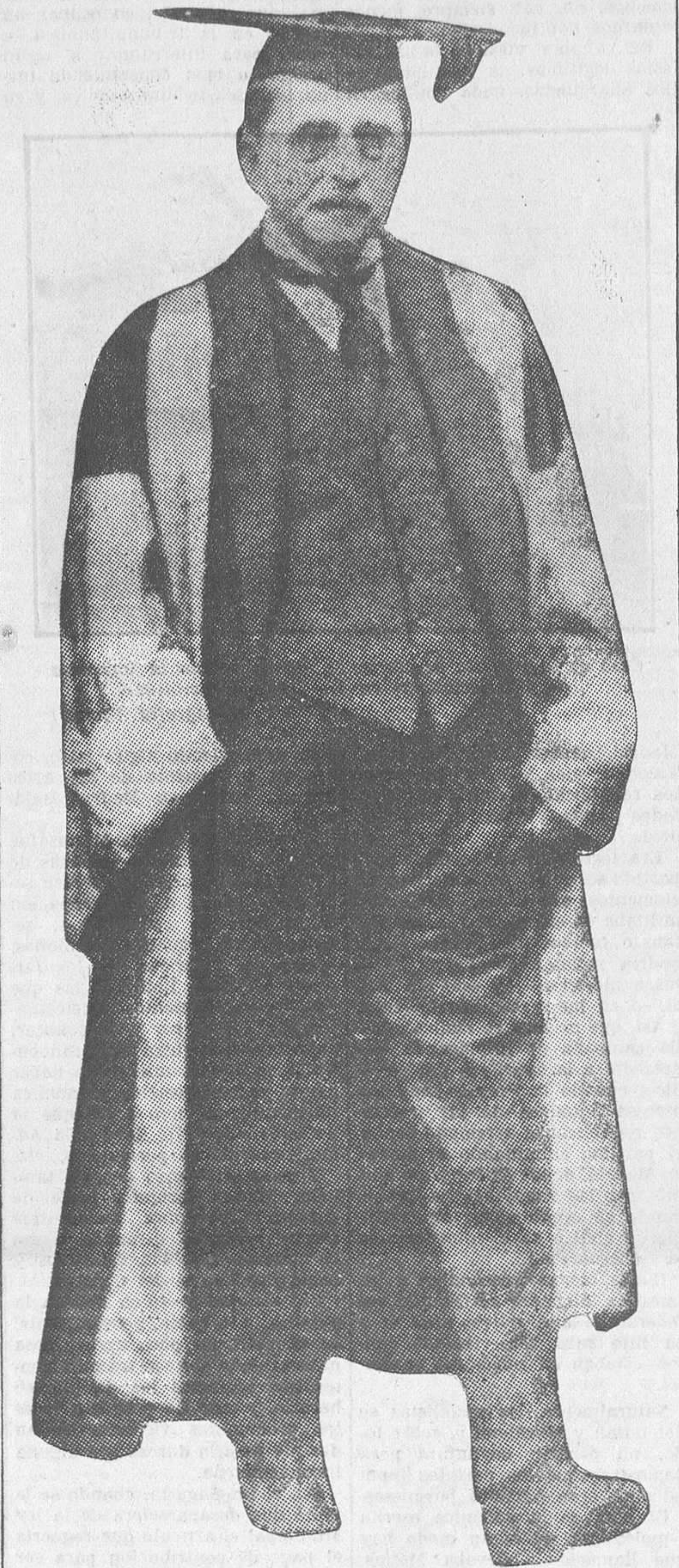
El creador de «Mary-Rose» (en la versión española «Marilyn»), «Peter Pan», «El admirable Crichton» y tantas otras obras famosas, a quien la Universidad de Oxford ha concedido una alta distinción honorífica

de verme retr, de pronto, exquisitamente. Camino con mis personas, como en su compañía y me mordiase el bigote al mismo tiempo que mi personaje, si éste tiene esa lamentable costumbre... Sin duda, el ilustre dramaturgo es también un gran actor ca-