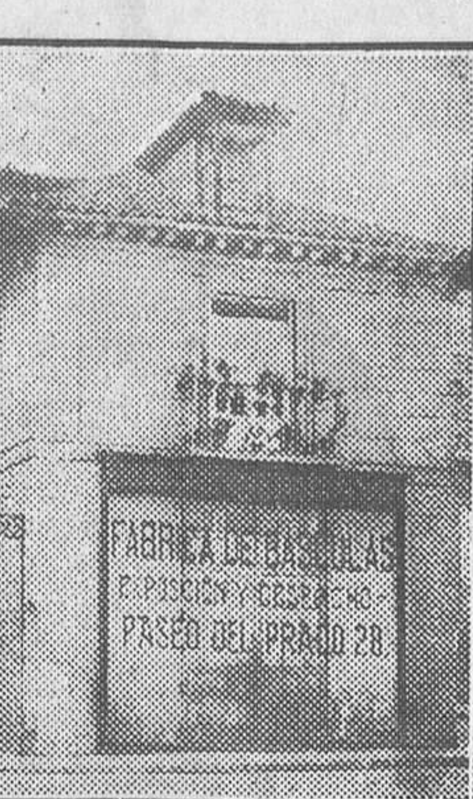
Casa de la Platería de Martínez, donde estuvo la imprenta de 'El Socialista' en los tiempos heroicos.

Los precios asignados a las localidades son más bajos que los de las corridas de la Cruz Roja y Montepío de Toreros, ya que hasta por 4,25 pesetas puede presenciarse nuestra fiesta y votar en «Oreja de Oro».