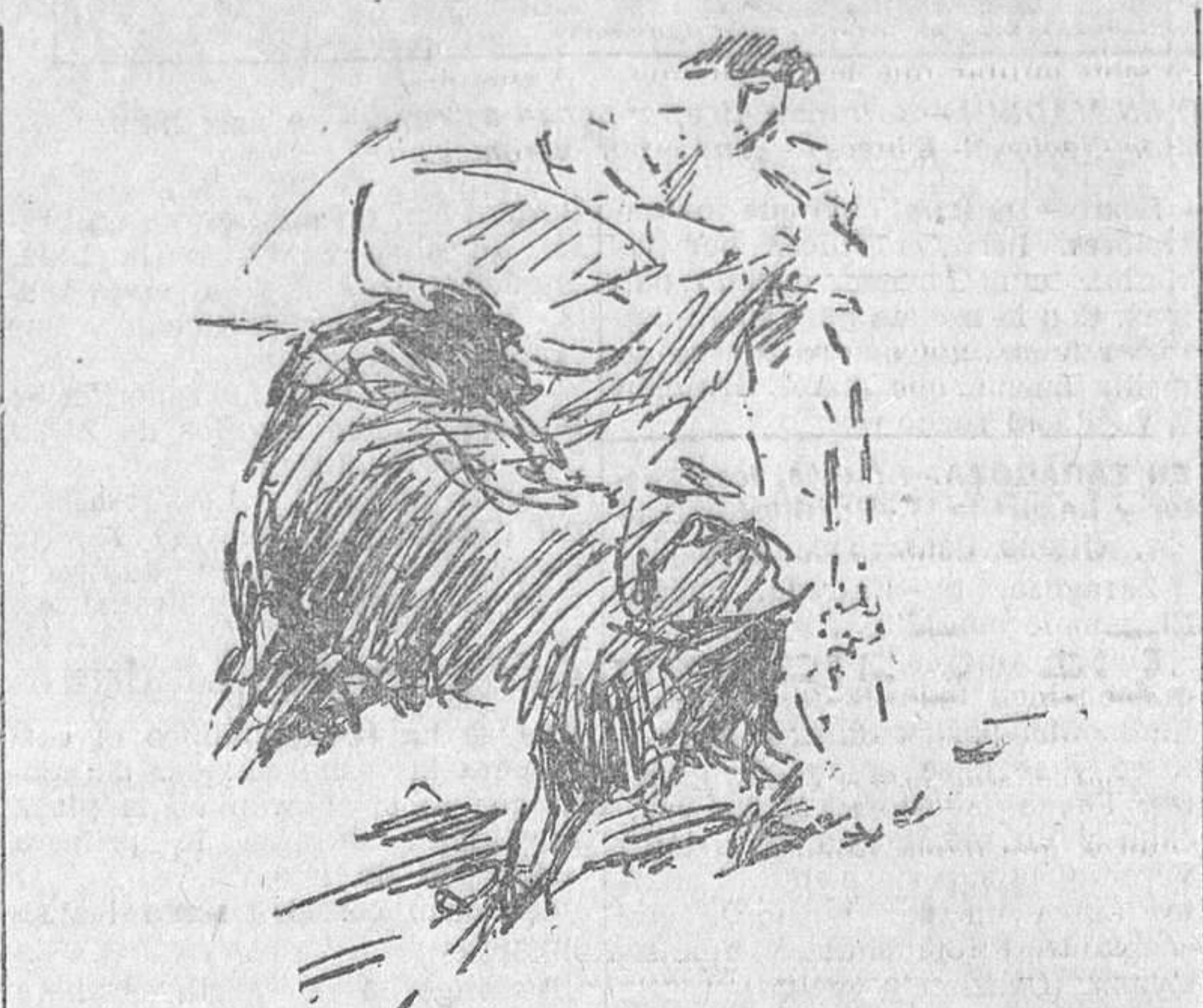
EL DOMINGO, EN MADRID.—Nacional Chico rematando los lances de capa en el segundo toro

Los antecedentes profesionales de los espadas que completan el cartel de la novillada del día de San José dan a ésta el carácter de extraordinaria, y el ambiente de la sinagoga taurina es de fiesta solemne al comenzar la corrida. Entusiasmo ardoroso en los tendidos, esperanza de todos y en todos; las conversaciones lo dicen, y, sobre todo esto, un frío en el ambiente, que no sabemos si re-