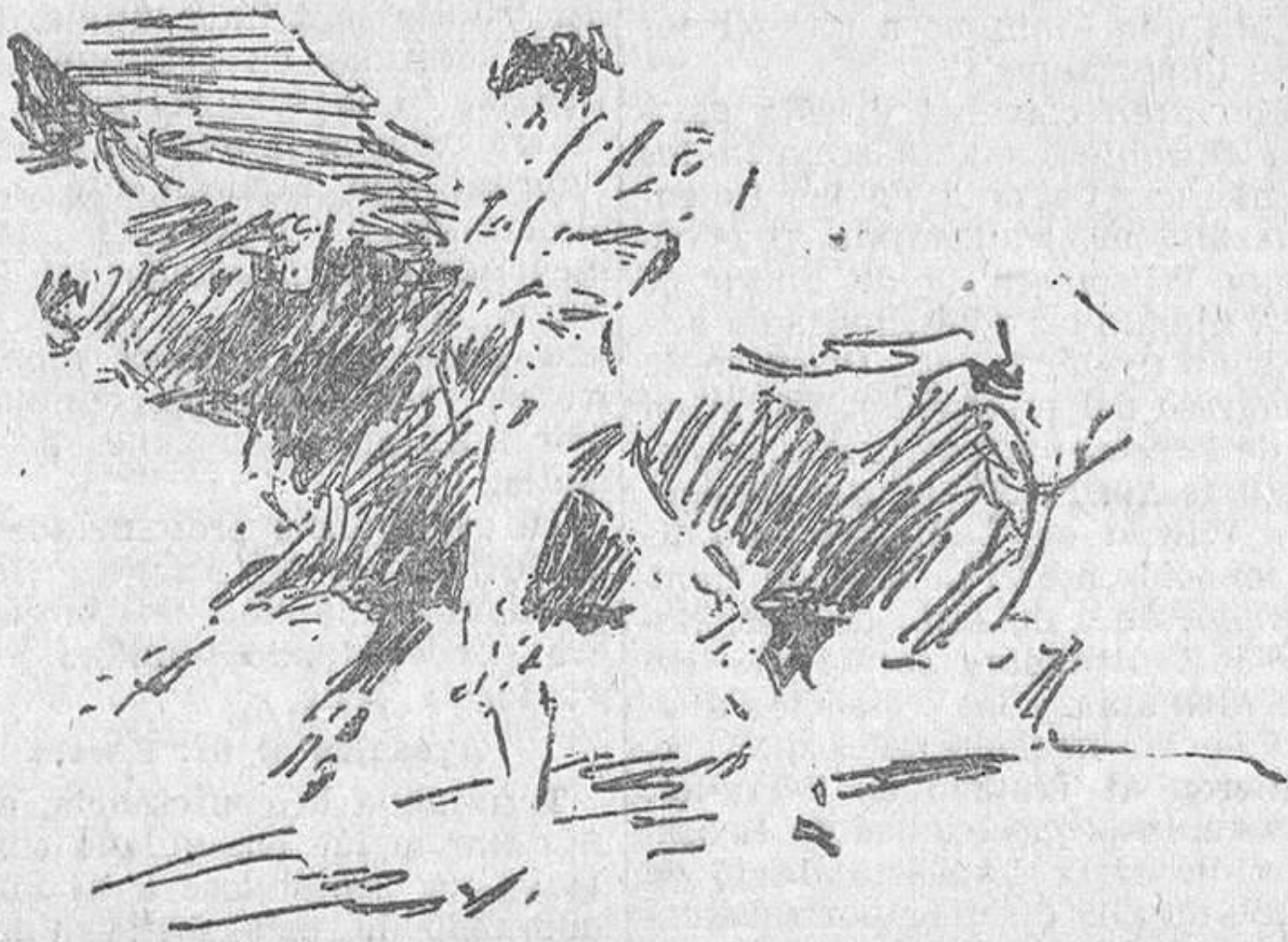
EL DOMINGO, EN MADRID.—Fortuna Chico en un muleta al sexto toro

El palha va cumpliendo como un santacoloma, pongo por toro bueno y santo, cuando Finito sale en su busca con el trapo rojo. Inicia la faena con un pase cambiado, sigue con un natural bueno y acaba el tiempo con uno