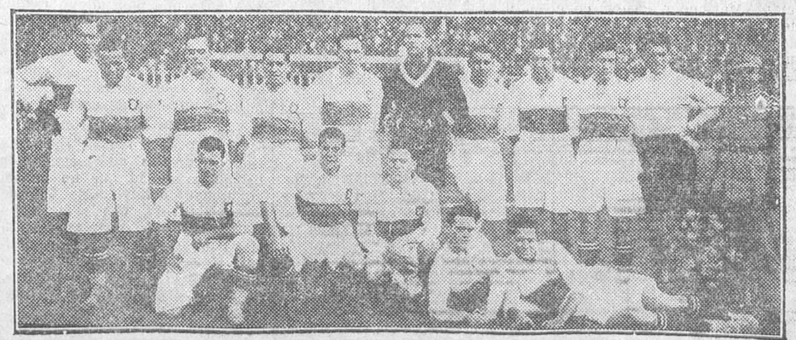
El equipo de la guarnición de Lisboa, que fué derrotado ayer, en el Stadium, por la selección militar madrileña