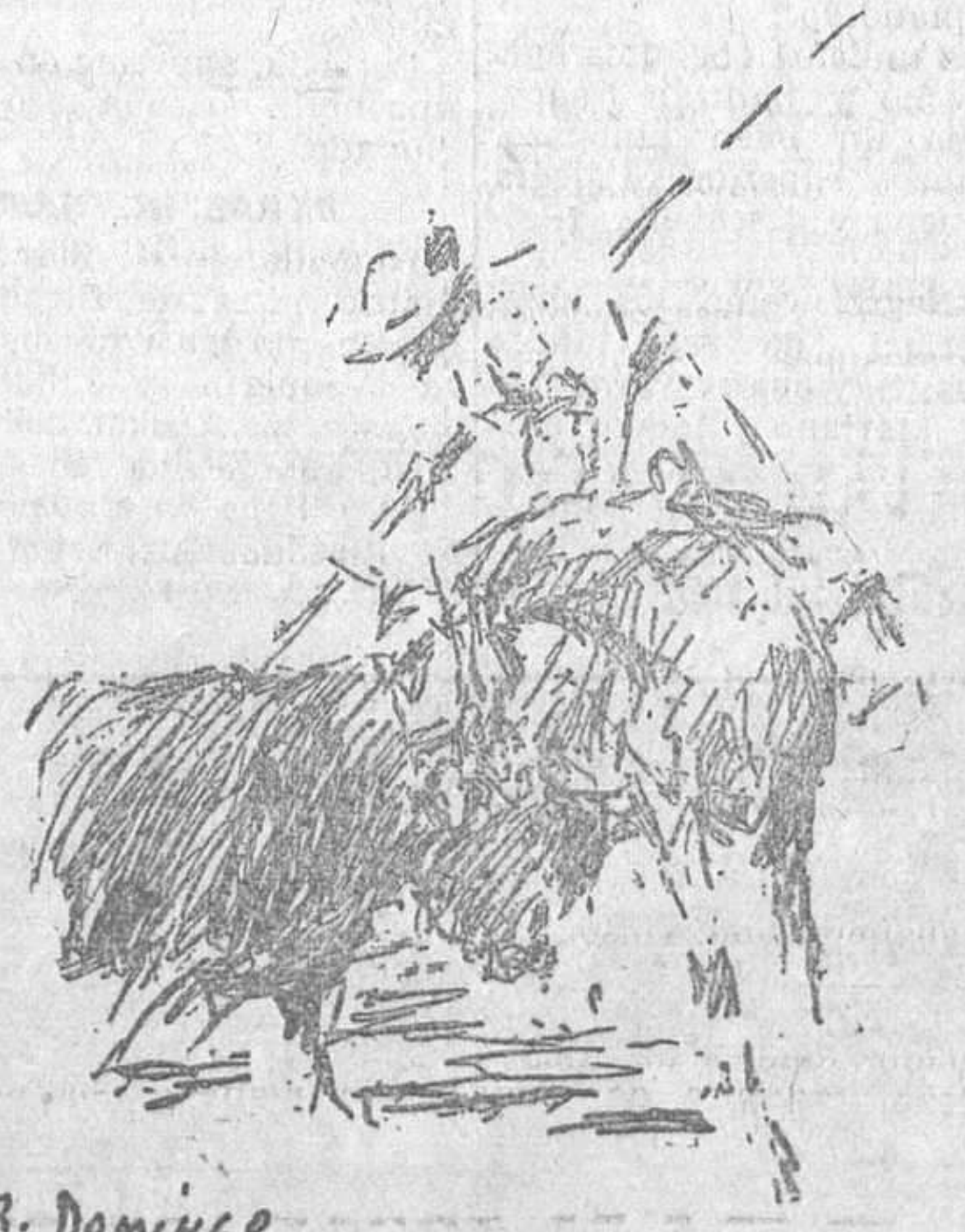
AYER, EN MADRID.—Un puya to de Anguila en el segundo toro. (Apuntes del natural por Roberto Domingo.)

Mariano Rodríguez veroníquea bien. Hace luego una faena breve, de la que sobresalen algunos pases buenos. Un pinchazo. Más pases. Otro pinchazo. Media. Otra