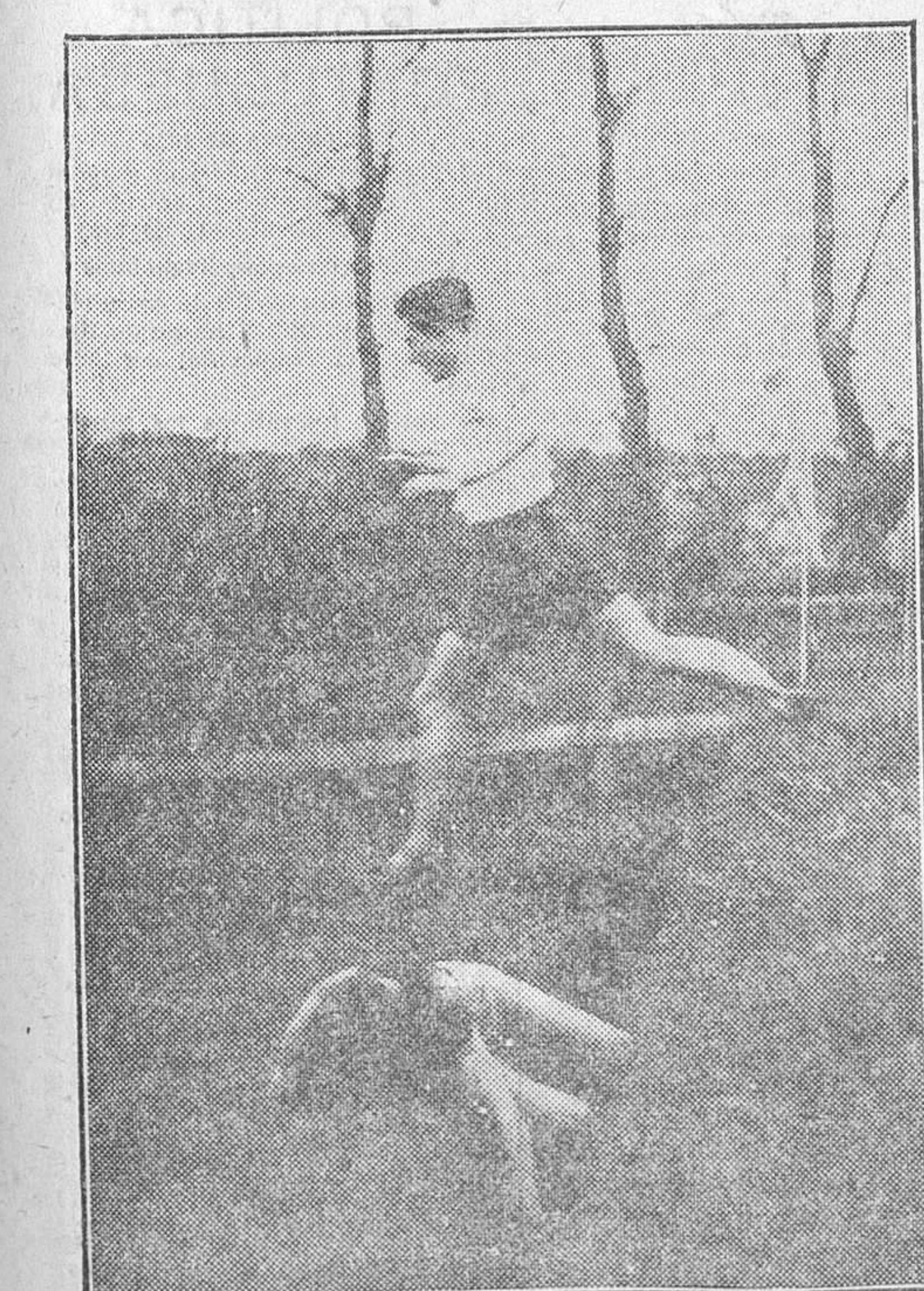
El «cross-country» internacion al de Maison Lafite, en el que los españoles tuvieron una brillante intervención. Un episodio de la carrera al saltar un foso

Apuestas: ganador (cuadra), 6.50; colocados, 8 y 27 pesetas. Premio Málaga, 1.600 metros, 1.400 pesetas.—Primerο, «Las Fra-