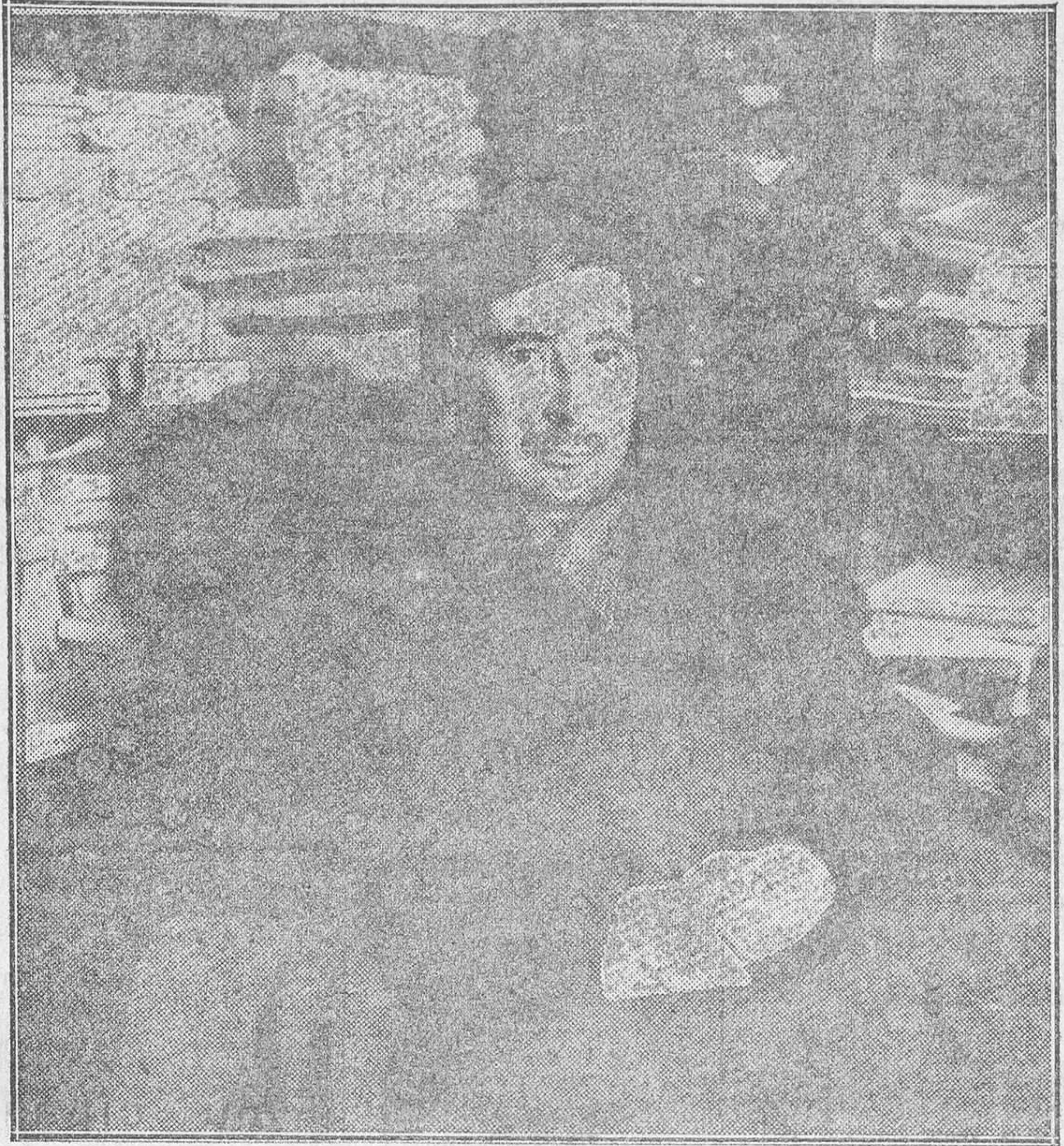
Marcelino Domingo, en la convalecencia

—Lo encontramos a usted hasta un poco más lleno de cara.