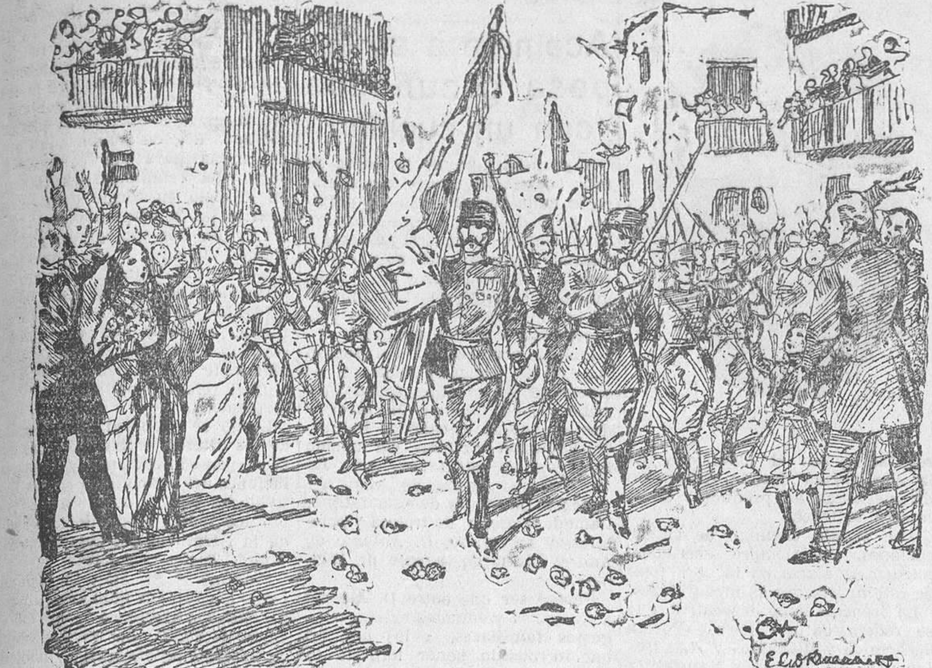
Entrada en Bilbao del ejército libertador (Estampa de Enrique García Ormaechea.)

aceite que ardió hasta la madrugada. Fue el único que en Bayona celebró el fausto acontecimiento. Mi breve permanencia en la ciudad francesa tuvo su fin. Me trasladé a París, allí pasó con mi gente unas cuantas horas y a escape a Londres, donde iba a desarrollar el asunto particular que hilvané en la villa y corte, con las etapas de Elizondo y Ba-