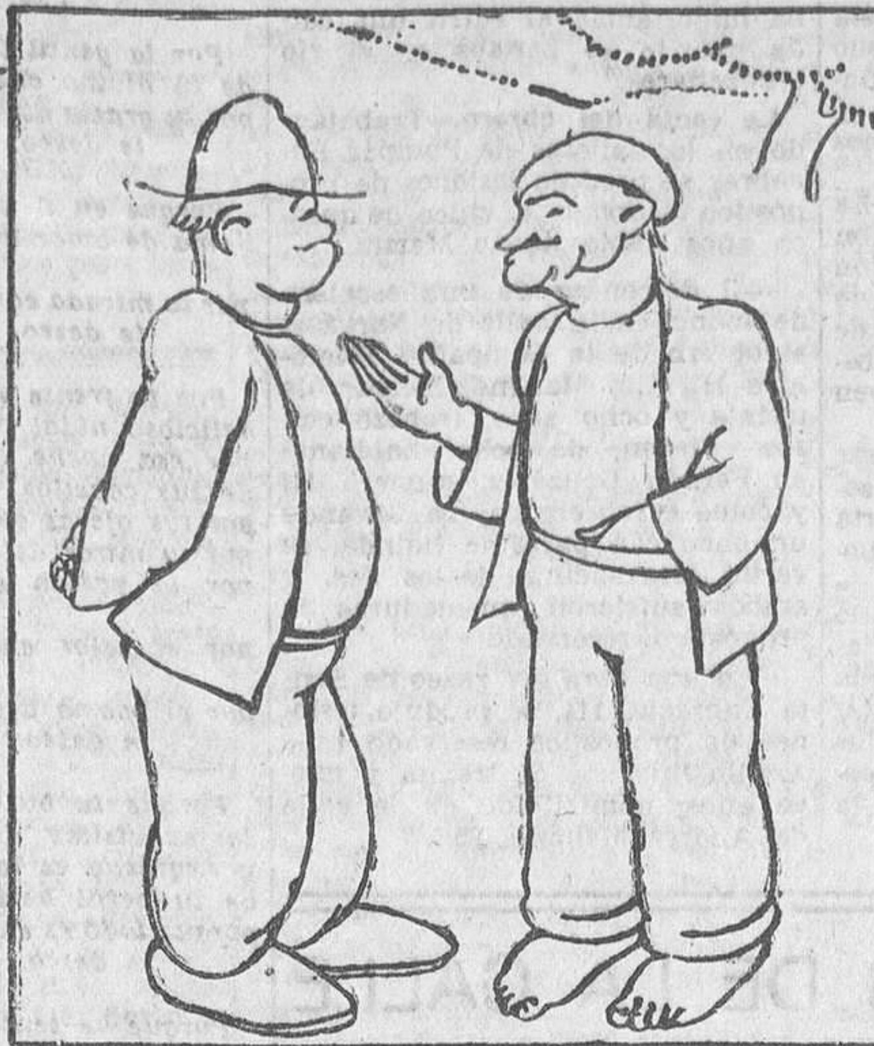
—¿Por qué non lle das de comer ao can?— perguntoulle un día un amigo. —¡Boh!— respondeu o señor Blas—. ¡Para o que traballa...!