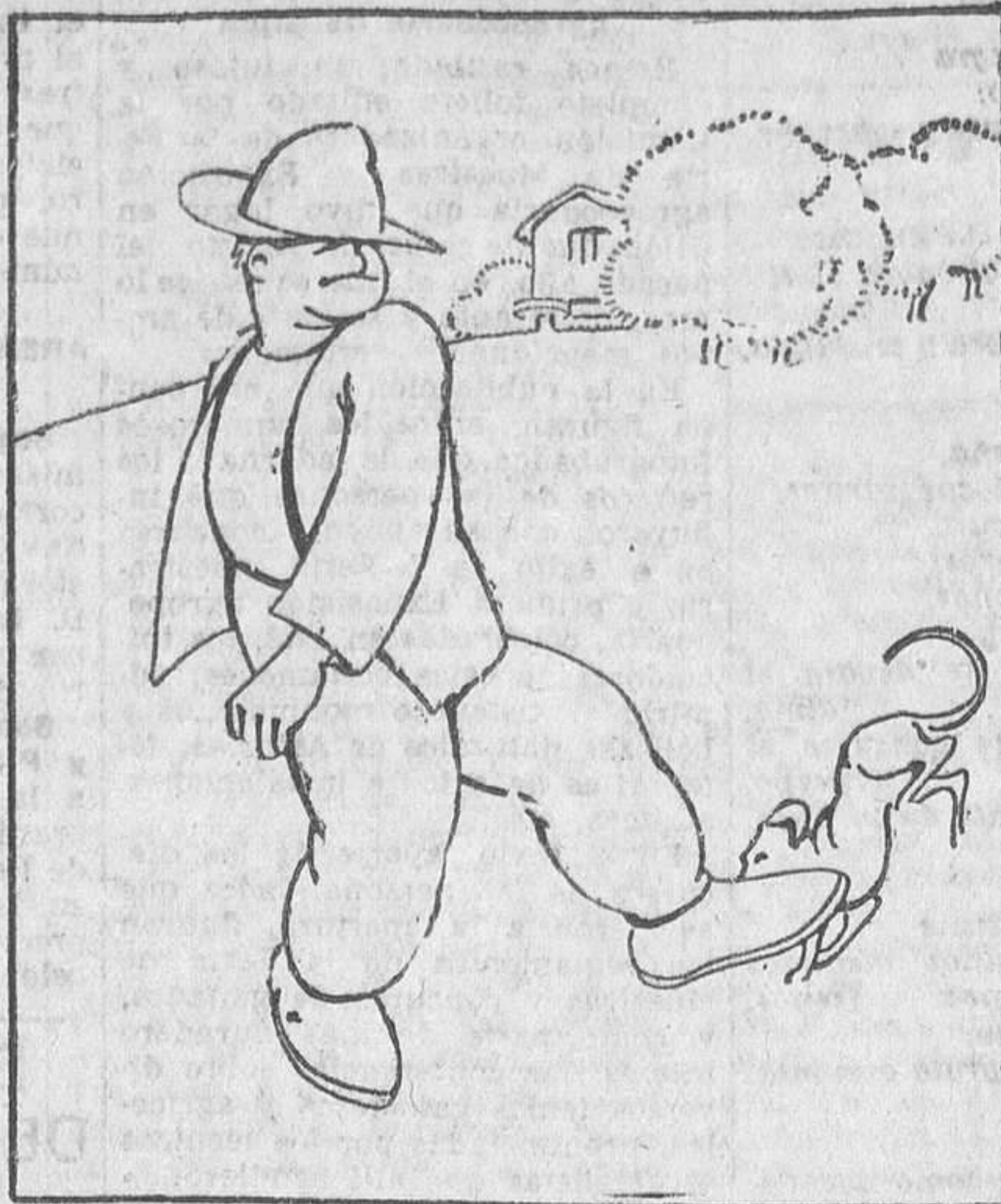
Porque o señor Blas dáalle patadas, en lugar de comida.