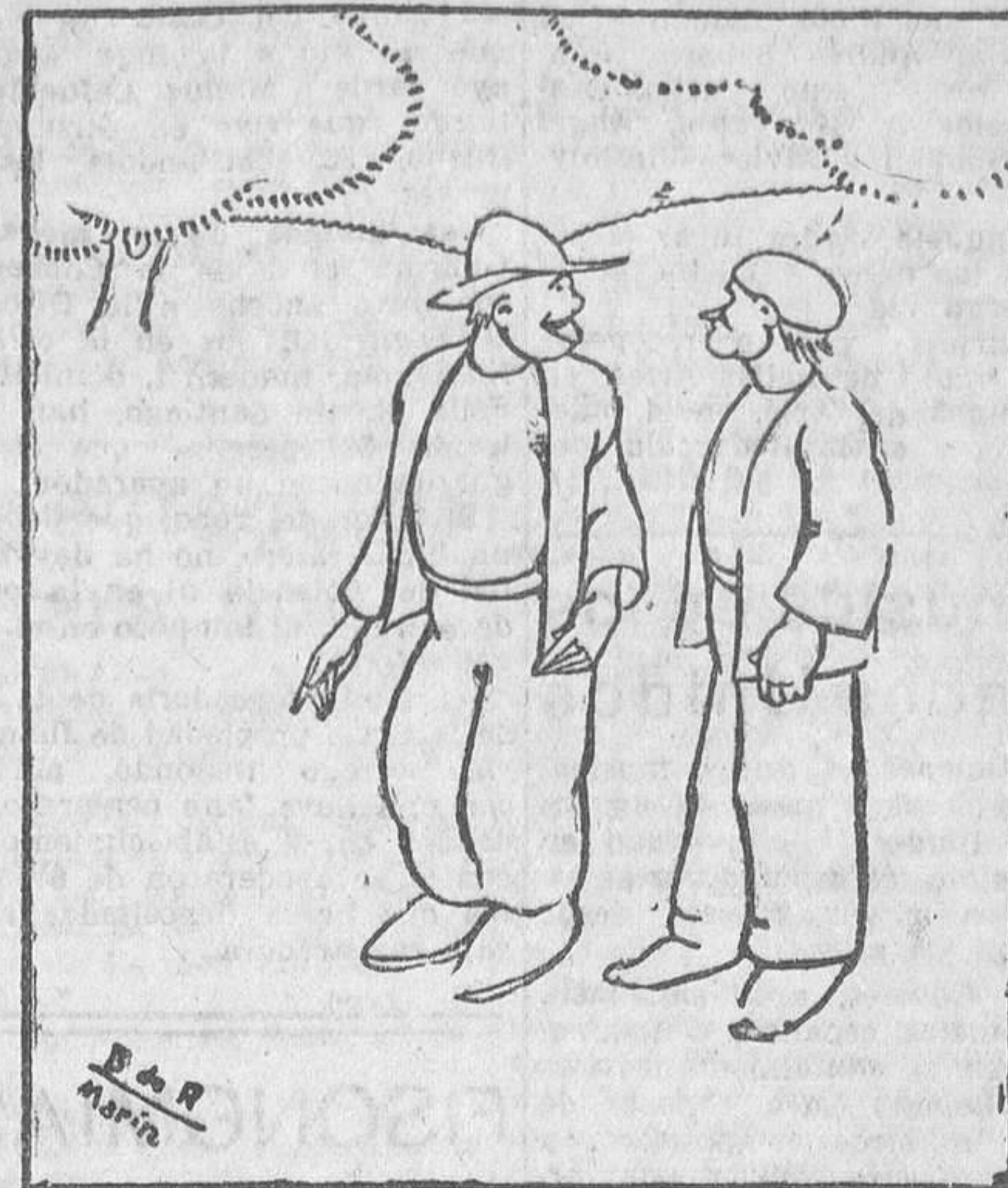
—E logo, ¿por qué non-o matas?— —¡Boh! ¡Pra o que come...!