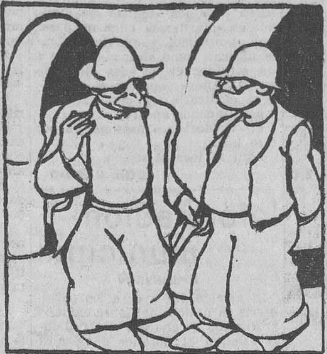
Eu tiña vista coma tí. Pero un día amañecín co-os ollos encarnados e la grimeantes.