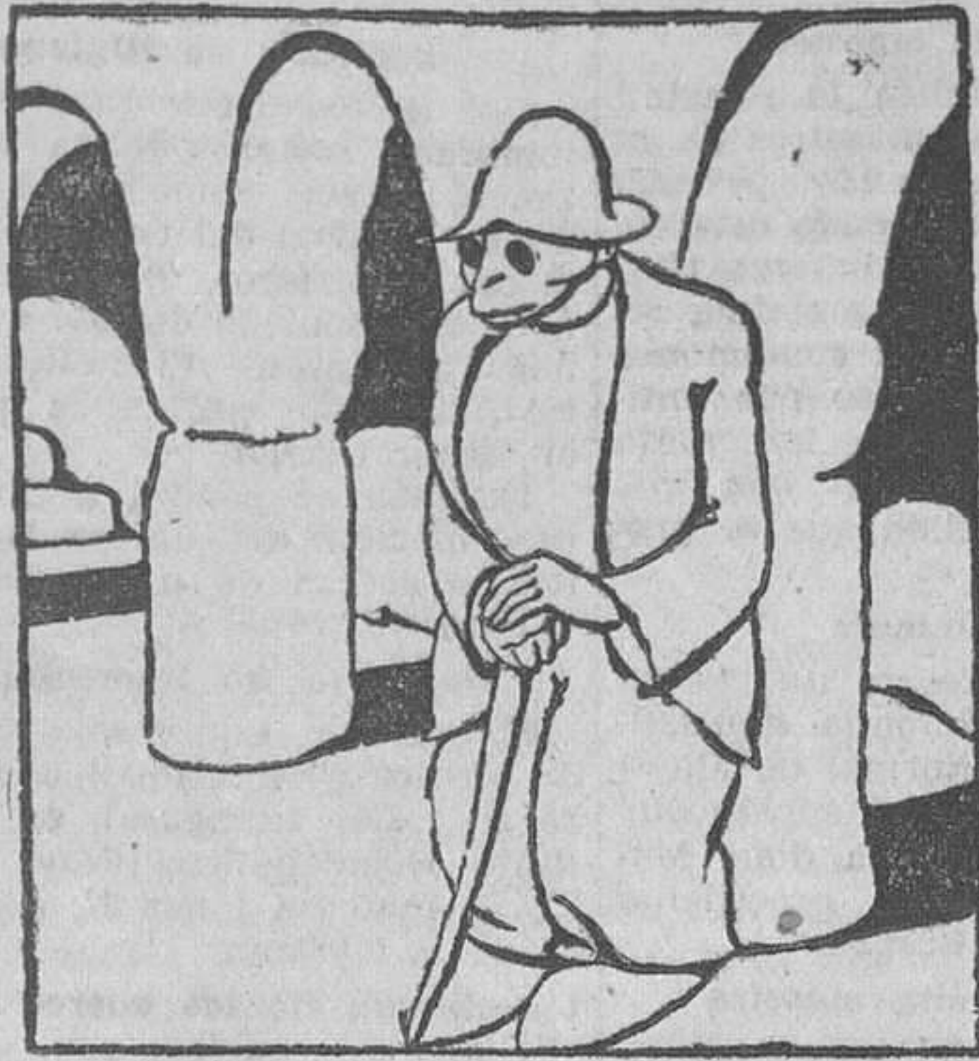
O señor Camilo era mol enemigo dos curandeiros. Non-os podía ver.