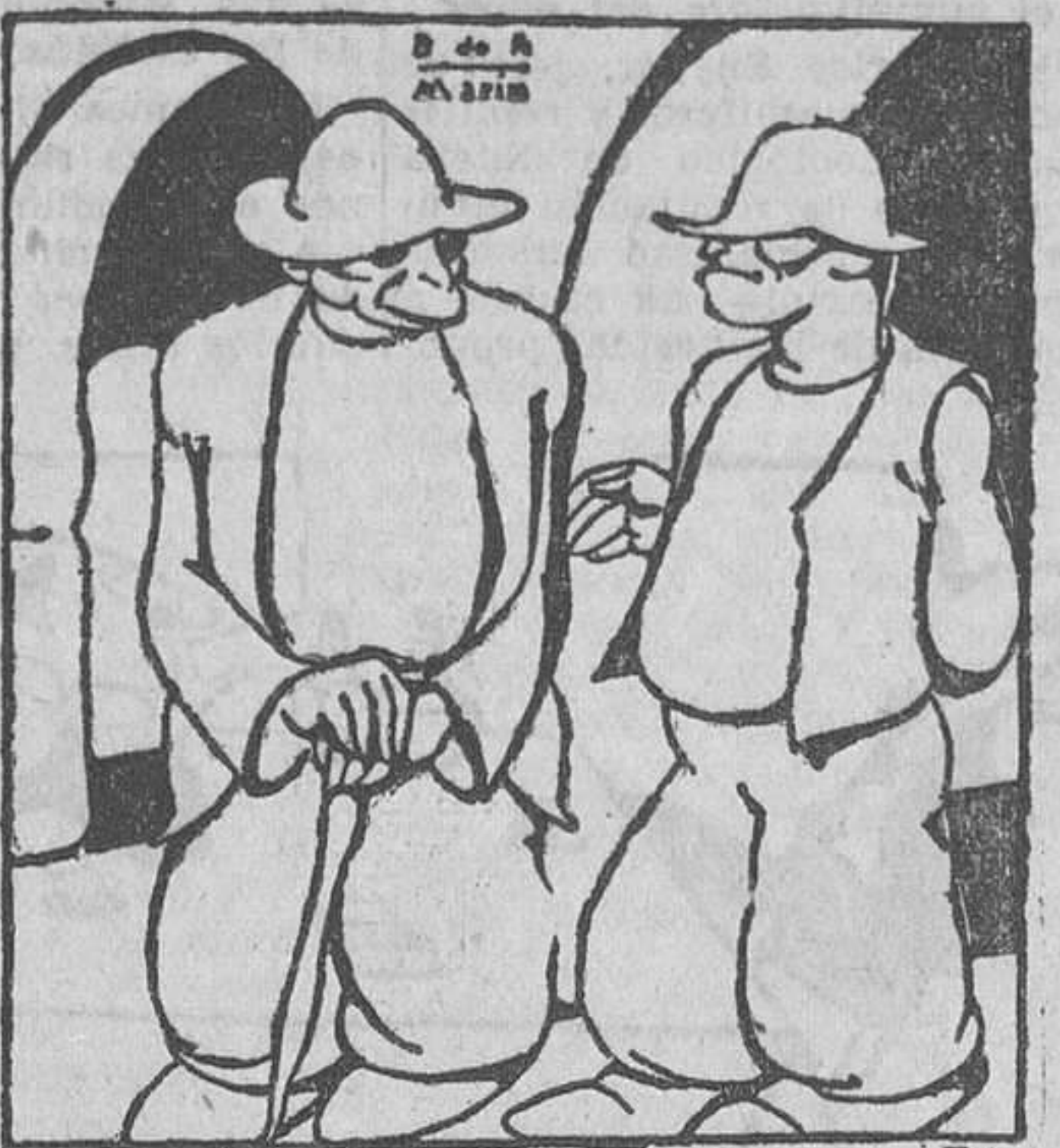
Os catro días quedel cego. Desde entonces non podo ver os curandeiros.