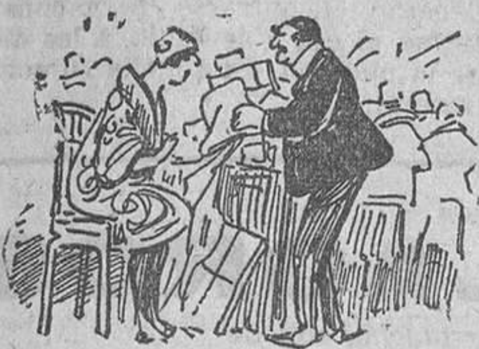
—Si nada de esto la convence, puedo sacarla otros dibujos.

El notable zoólogo murió víctima de su curiosidad. Como tantos otros abnegados hombres de ciencia halló la muerte en el cumplimiento de su deber.