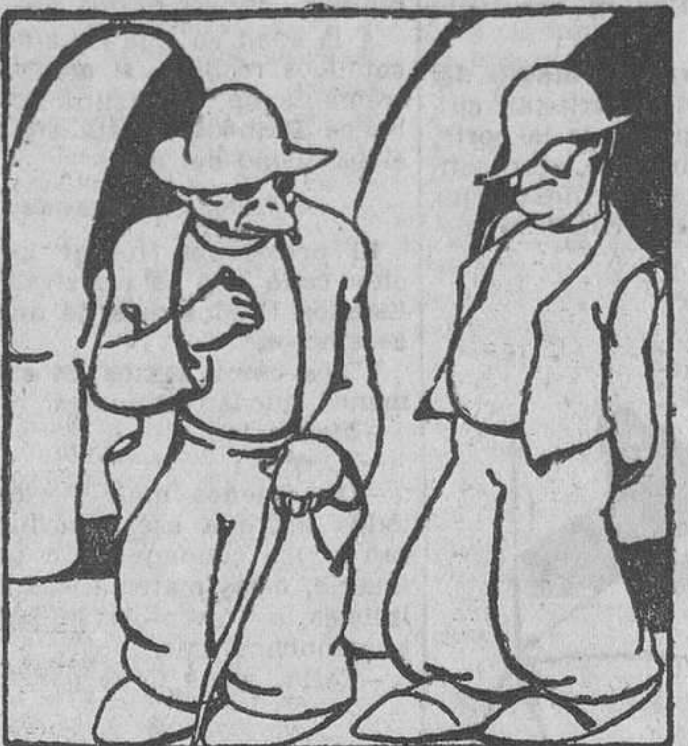
Fun a casa do curandeiro e mandoume lavar os ollos con agua de sulfato de cobre.