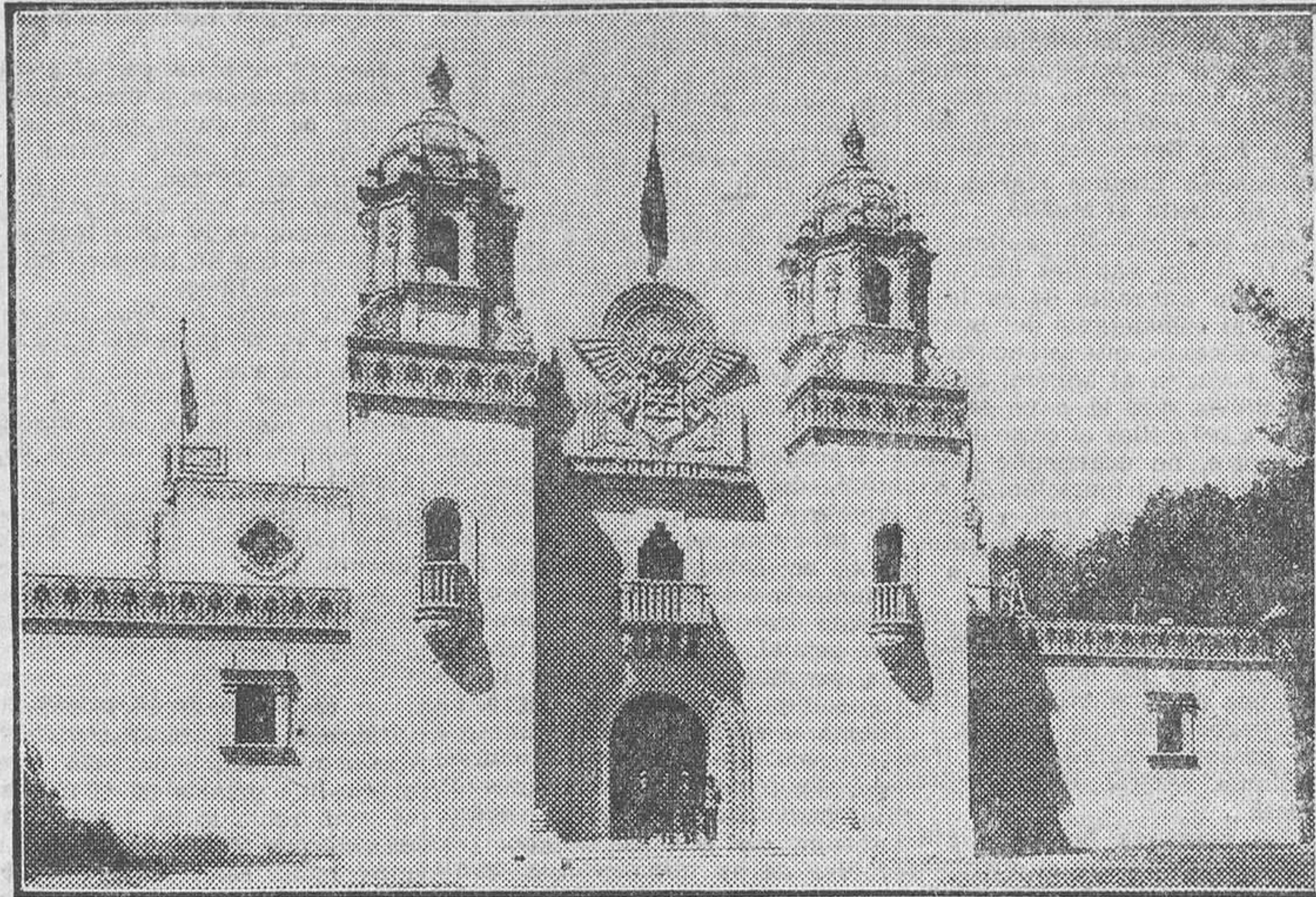
Pabellón de Colombia en la Exposición de Sevilla

La instalación, como cumple al entendimiento del comisionado general, se dispone con cuidado de que el aspecto artístico prevalezca. A los lados de la entrada, dos mapas en mosaico van a hacer ver, respectivamente, la situación de