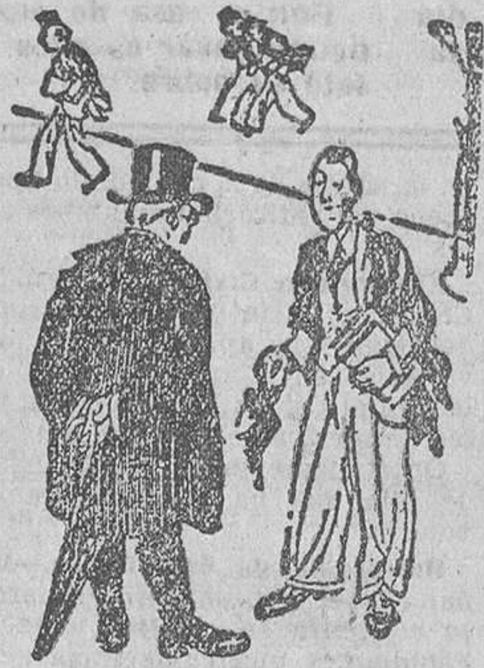
—Señor profesor, ¿puede usted decirme si el castigo eterno consistirá en penas morales o físicas?