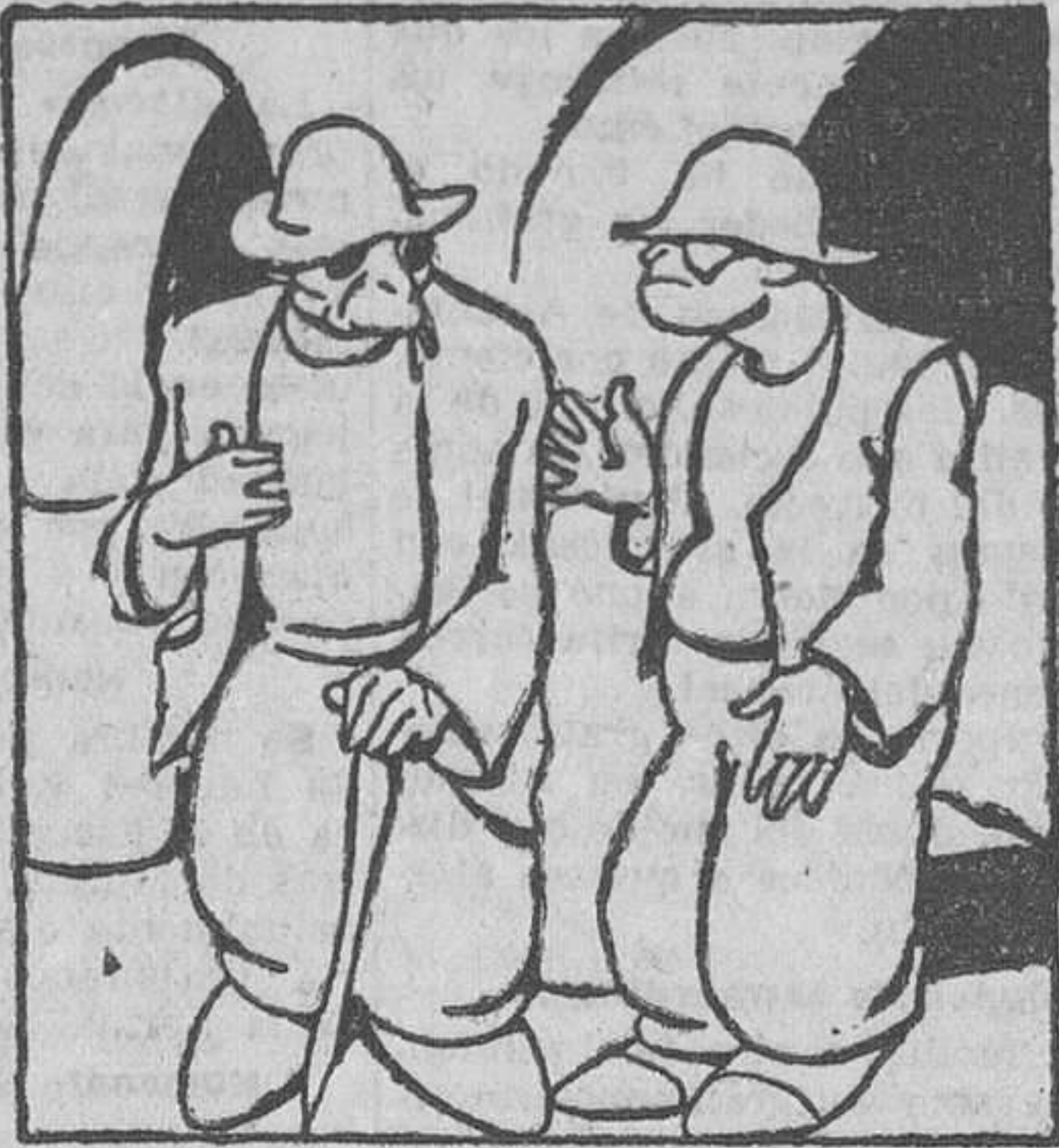
—¿E por qué?—perguntoulle un día un amigo. —¿Por qué? Pois mira.