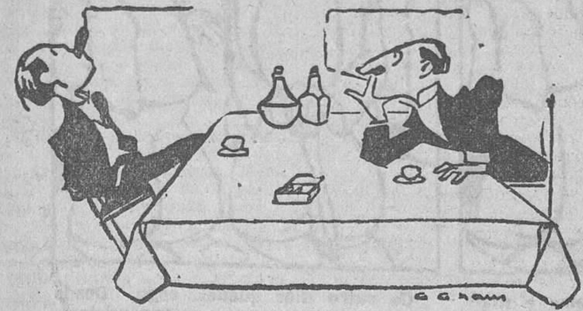
—Me aburro... Estoy cansado de mujeres. —Entonces, ¿cásate!