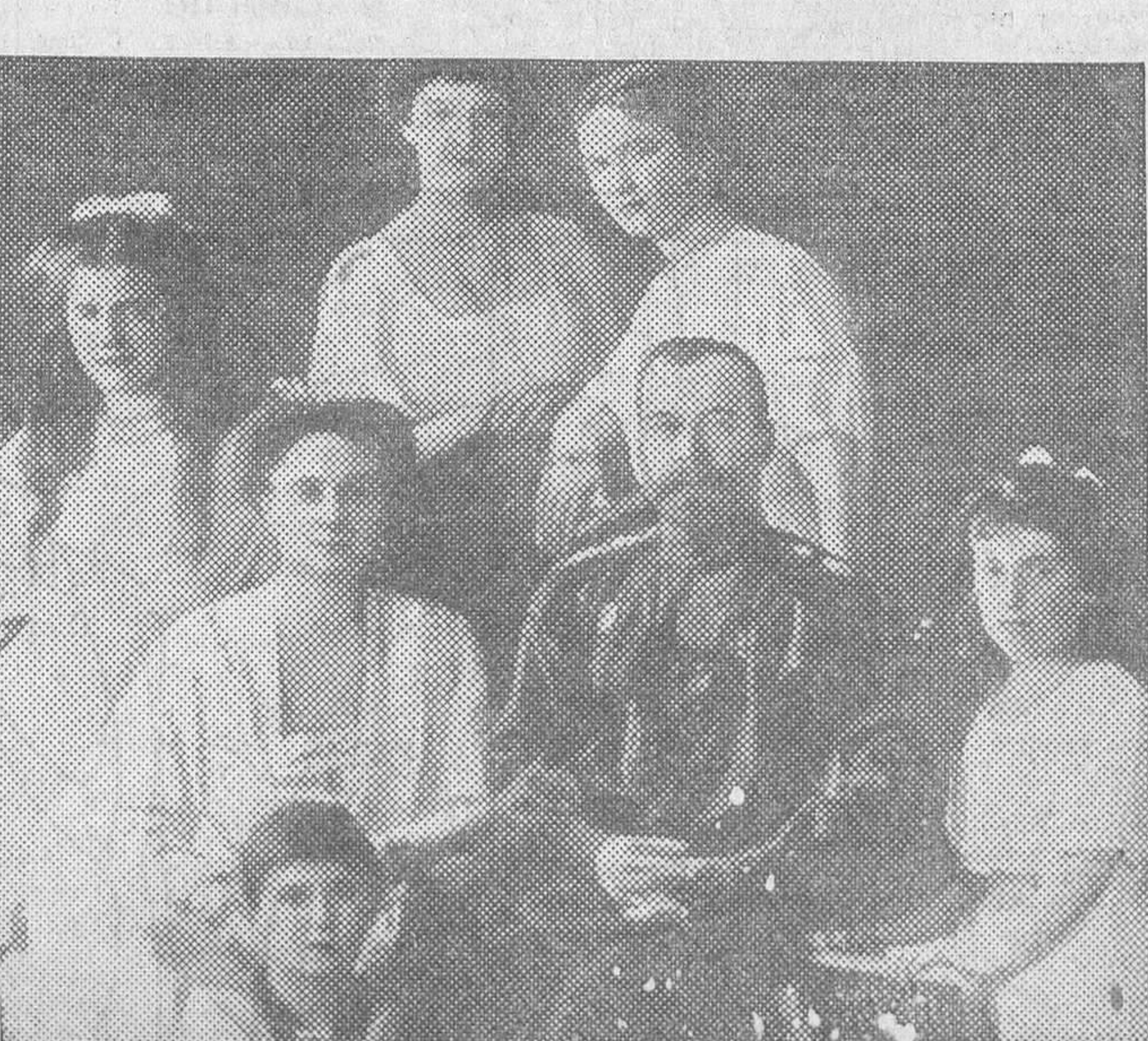
La familia imperial de Rusia.