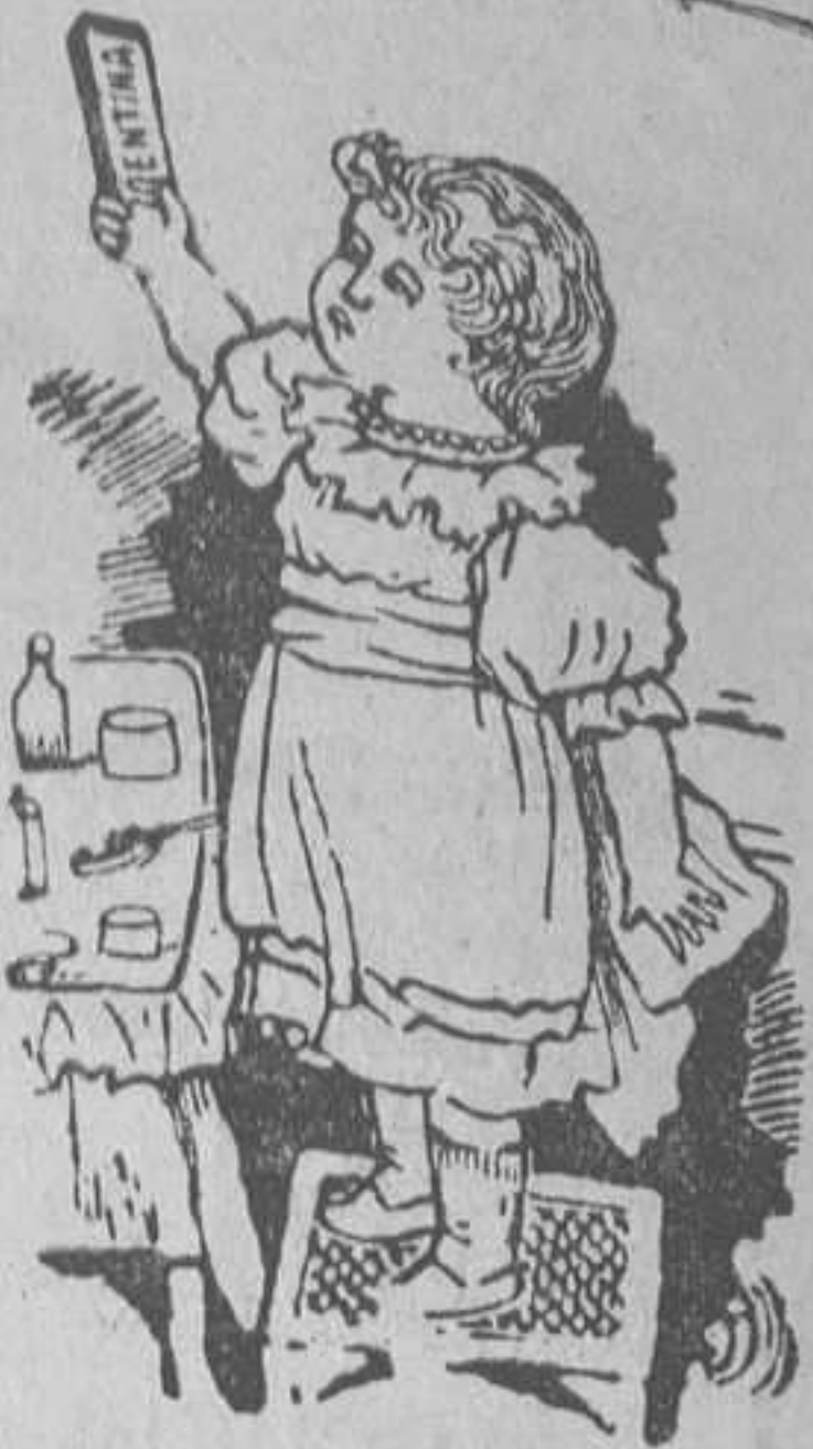
Después de tomar la DENTINA