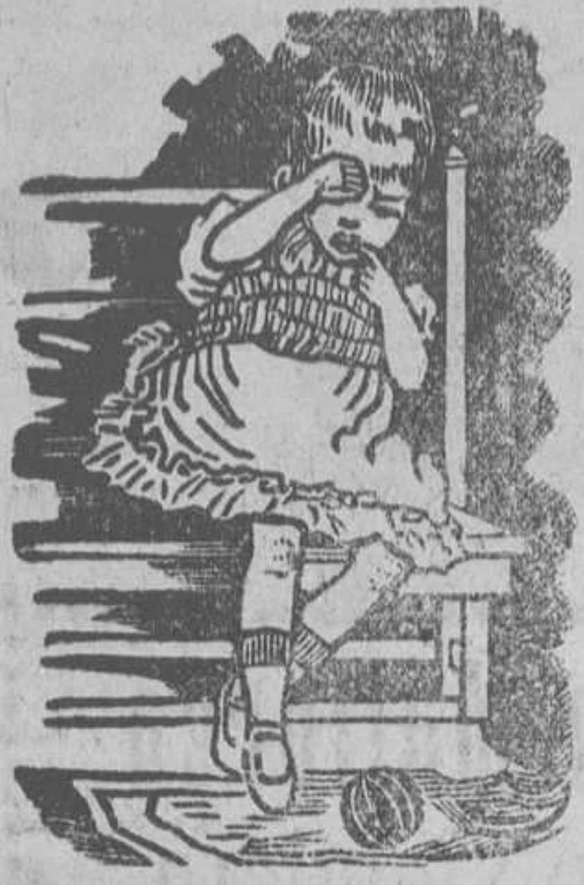
Antes de tomar la DENTINA

Laboratorio y farmacia Cañizares, calle de Caballeros, número 47, Valencia