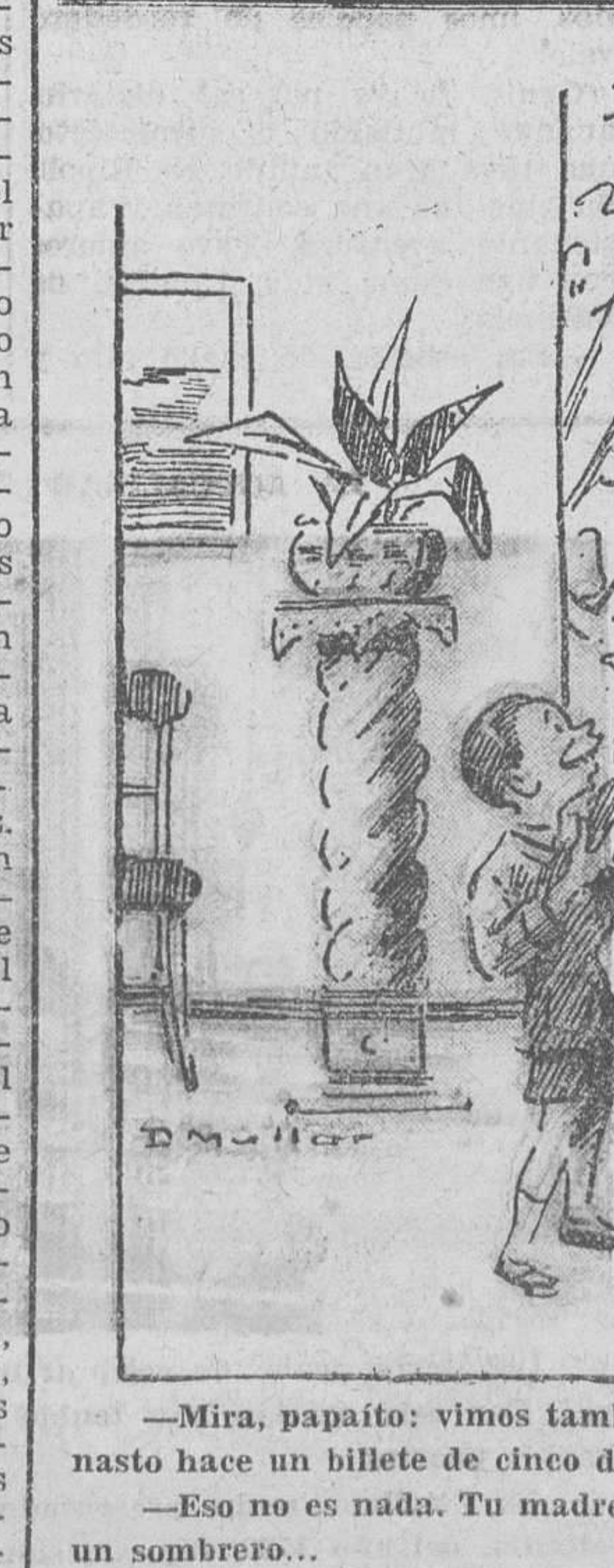
—Mira, papaito: vimos también un prestidigitador que de un canasto hace un billete de cinco duros. —Eso no es nada. Tu madre coge veinte duros y los convierte en un sombrero...

ALBERTO MARIN ALCALDE. (Prohibida la reproducción.)