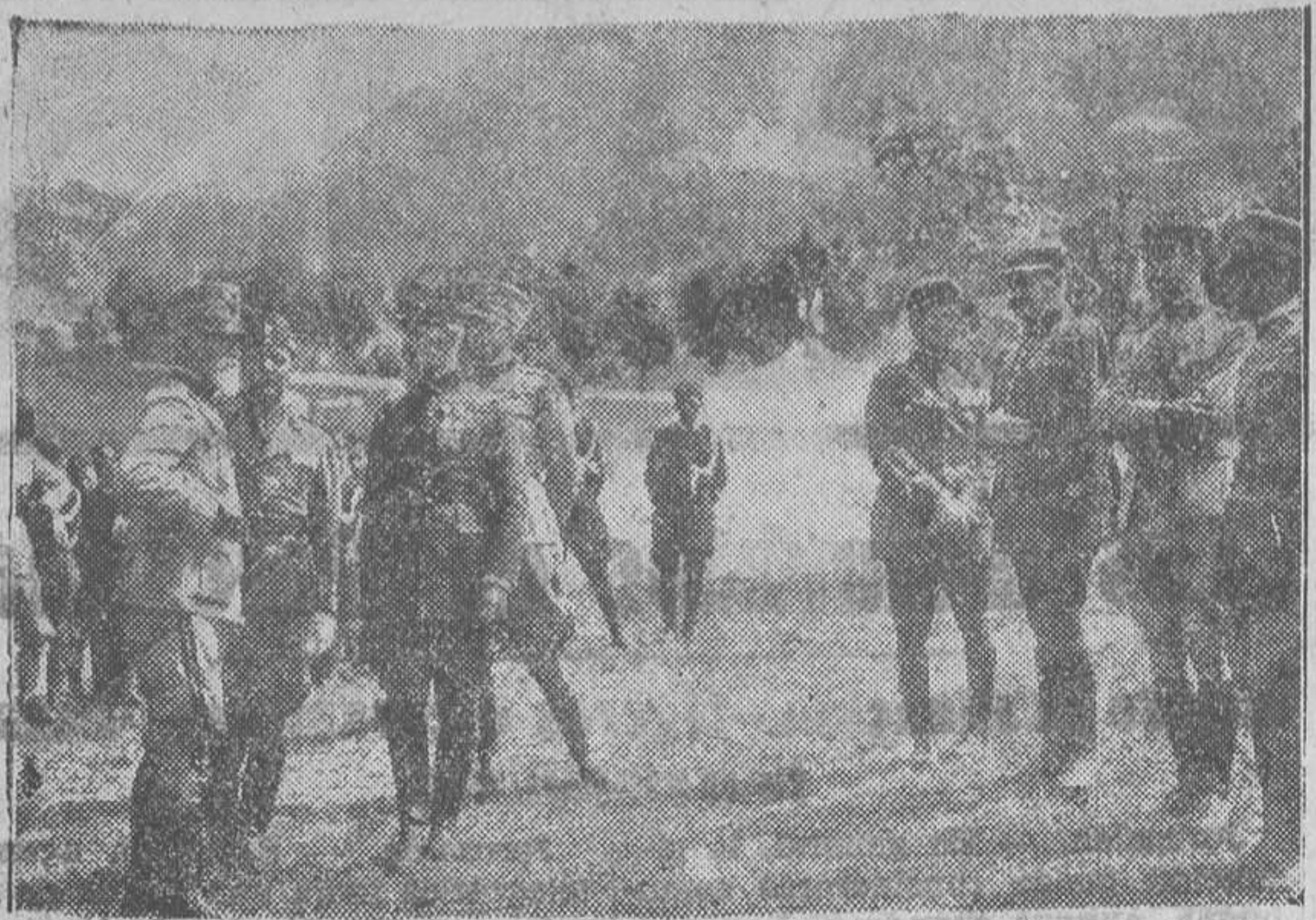
El ejército italiano realiza manio bras bajo el inmediato control del Estado Mayor y el jefe militar de París, general Couraud