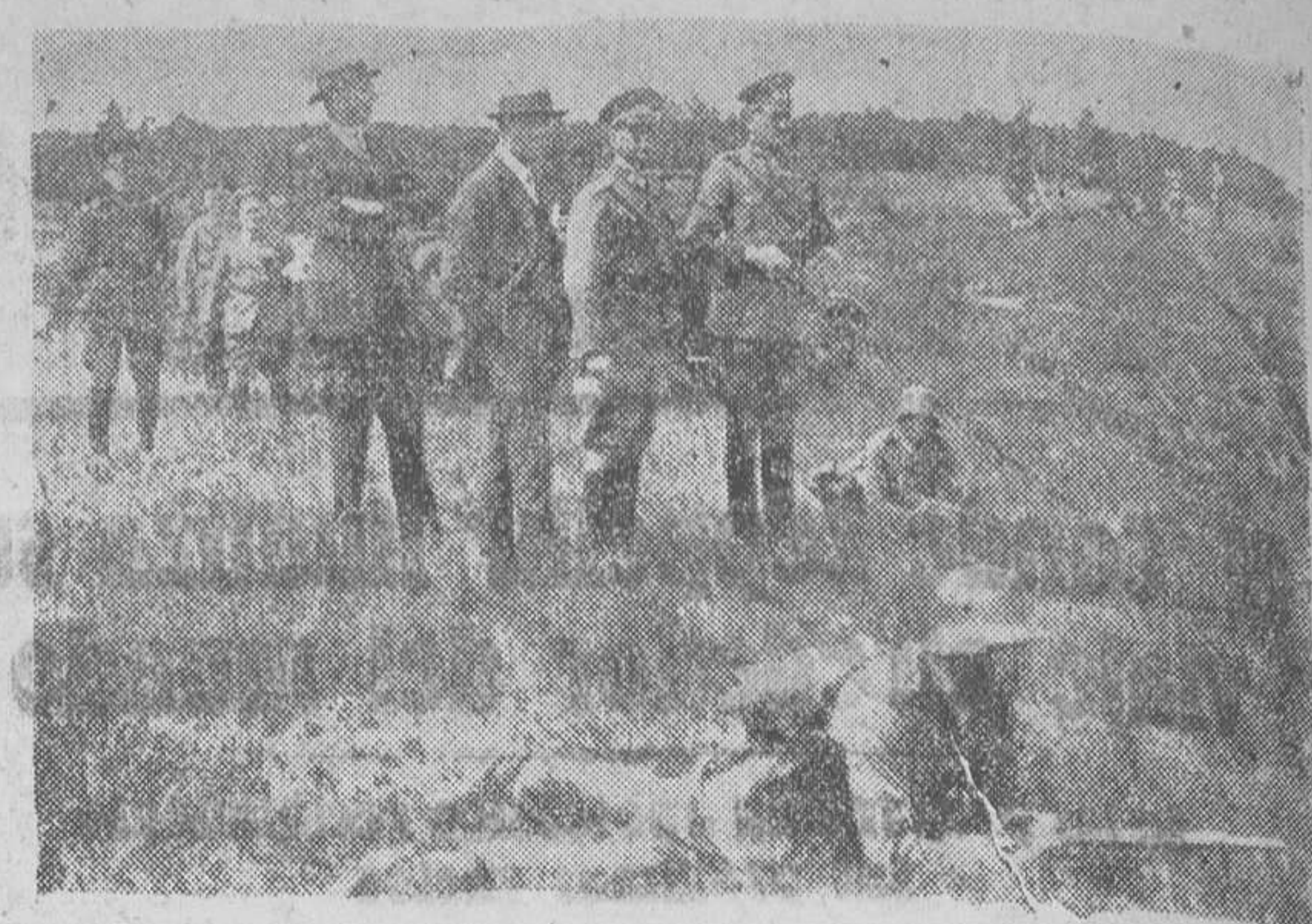
Hace maniobrar sus ejércitos en presencia del general Couraud (vestido de paisano), jefe de la escuela de guerra de los Estados Unidos