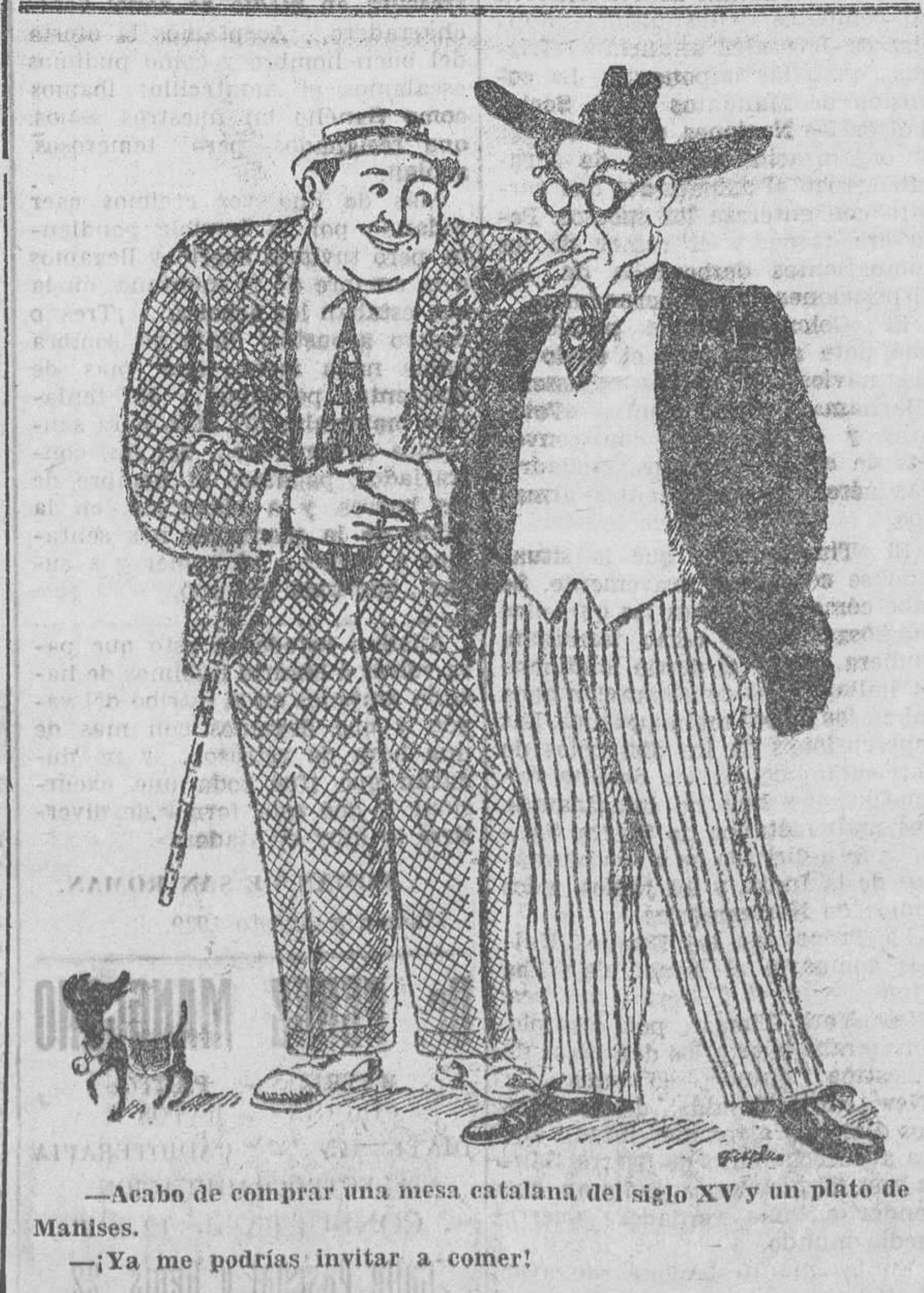
—Acabo de comprar una mesa catalana del siglo XV y un plato de Manises. —¡Ya me podrías invitar a comer!