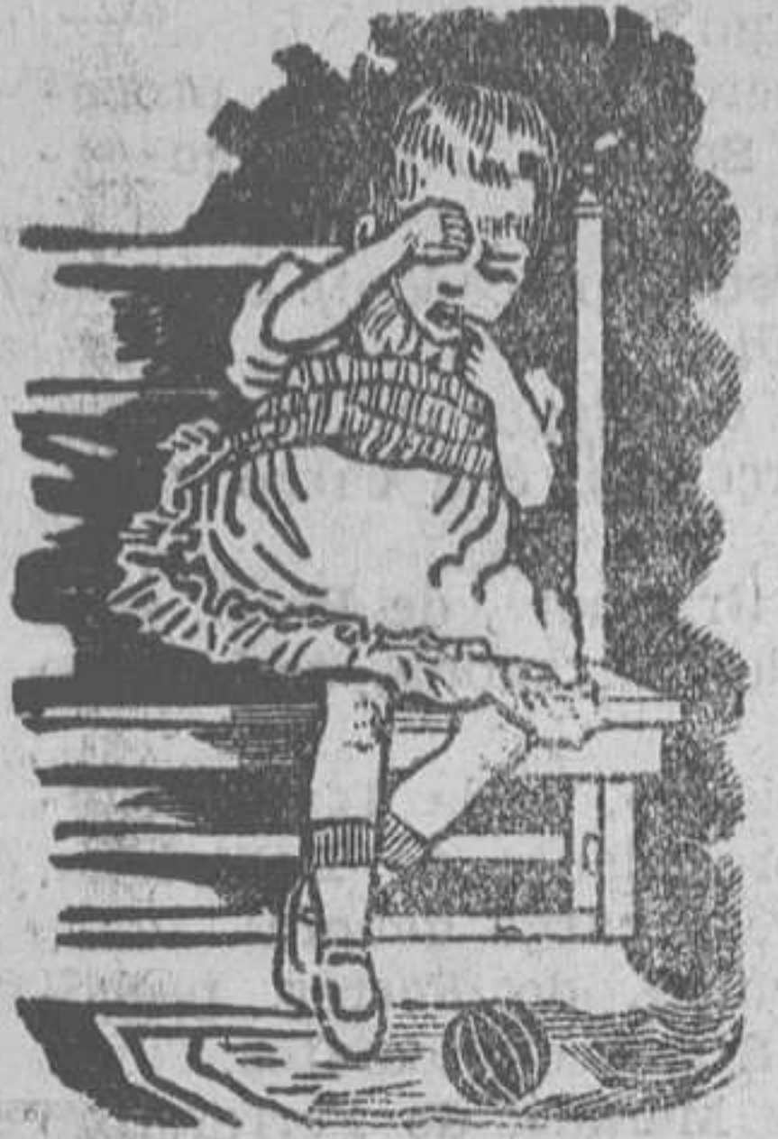
Antes de tomar la DENTINA

Caja-estuche, 1'25 pesetas, en buenas farmacias y droguerías y en Laboratorio y farmacia Cañizares, calle de Caballeros, número 47, Valencia