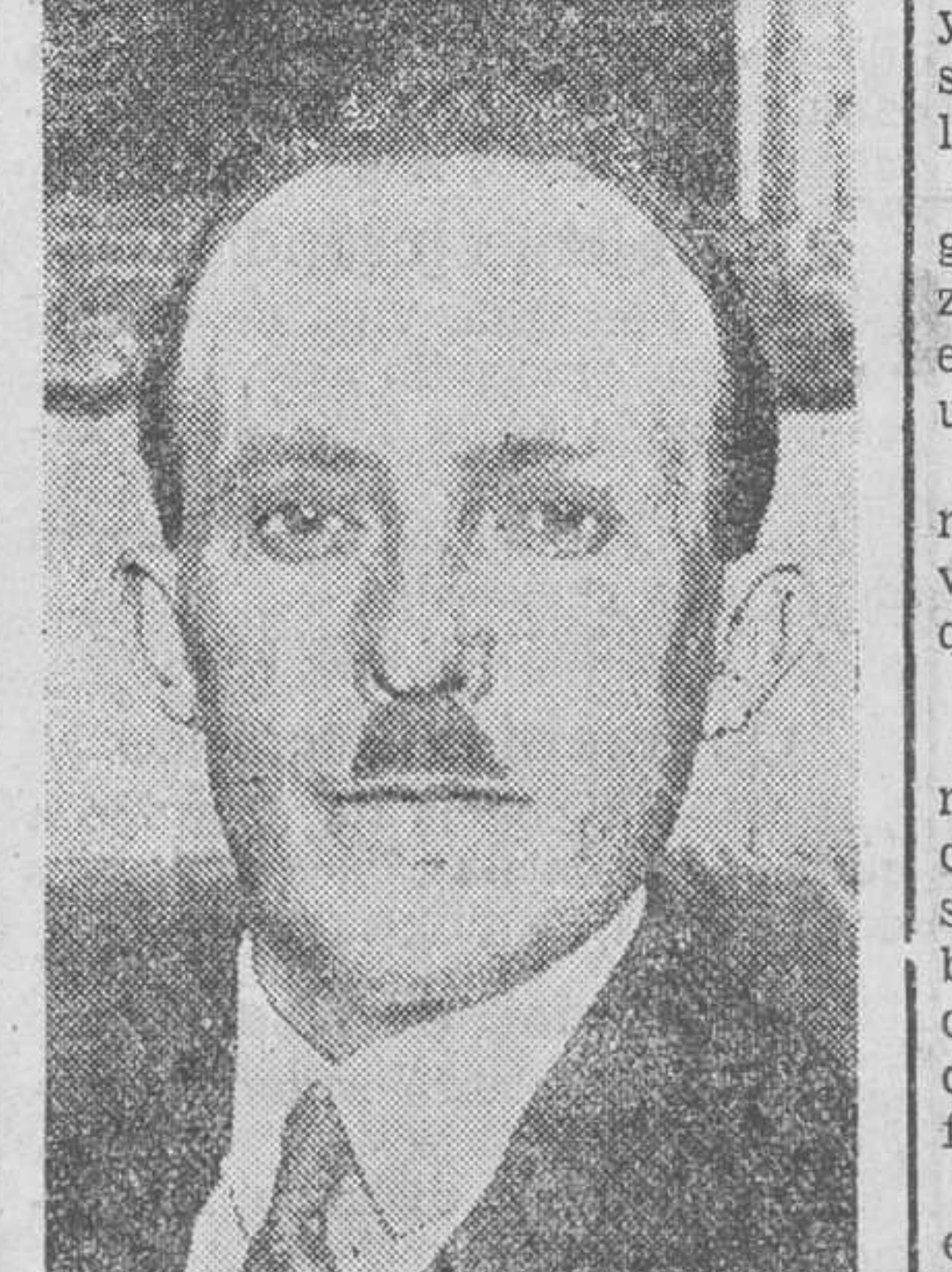
Tras la aprobación del plan Young, cobra actualidad la figura de mister Quensay, nombrado director del Banco Internacional de Reparaciones, cuya domiciliación sigue aún discutiéndose.