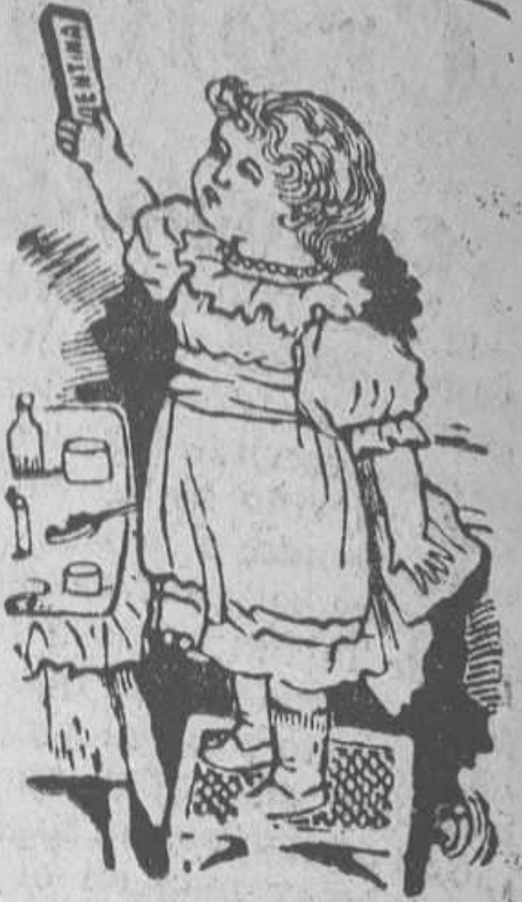
Después de tomar la DENTINA