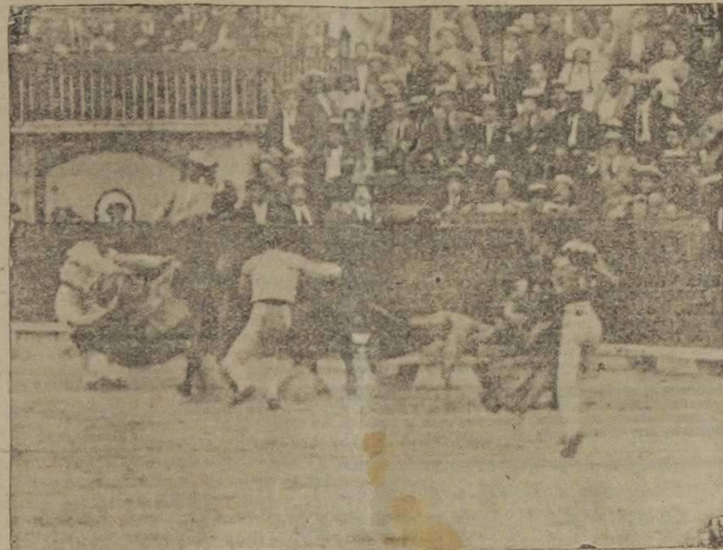
Cogida de La Rosa por el quinto toro de ayer tarde.—(Foto. Vidal).

A las cinco de la tarde, segundo día de Certamen musical en la Plaza de Toros. A las diez de la noche, bailes populares en el paseo de la Alameda.