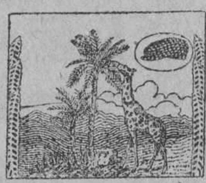
Nombre y marca registrados

FLASADERS, 13, VALENCIA. Alquiler espléndido local, propio para industria almácn, garage, cine, etc. RAZÓN: VINATEA, 7, principal