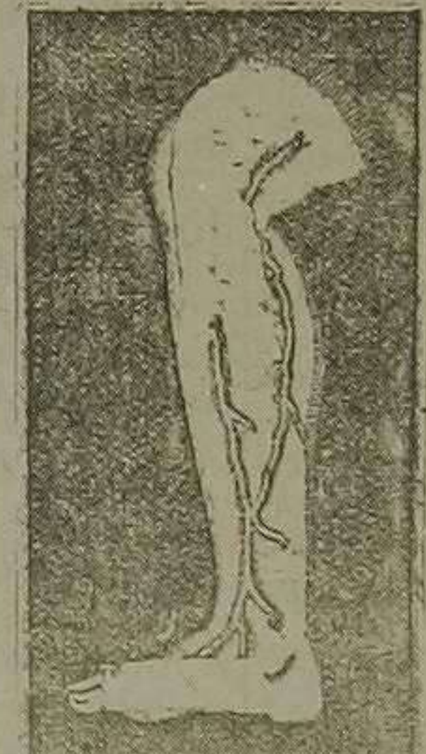
Pierna con varices

Con una caja de 12 paquetes puede obtenerse 12 litros de agua mineral