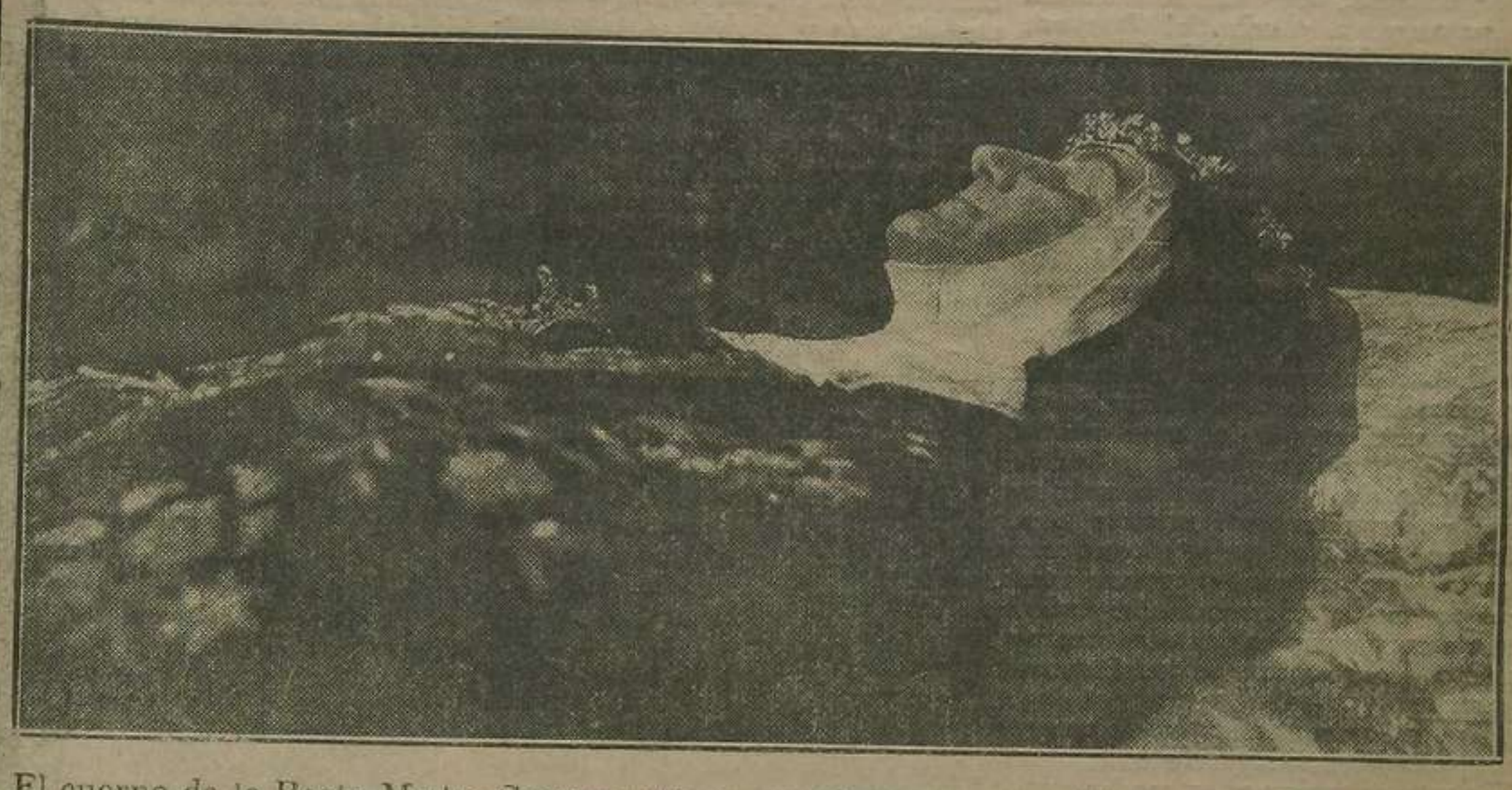
El cuerpo de la Beata Madre Sacramento encerrado en su magnífica urna.

Peró no fué esto sólo; la emoción de Valencia subió hasta el cielo, y a nuestras lágrimas se unieron también las de los cielos, en forma de ligerísima llovizna, durante la