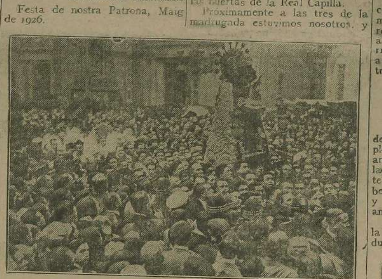
La imagen de la Virgen al ser trasladada desde su Real Capilla a la Catedral

R. Garrido Juan. De l'Academia Valencianista