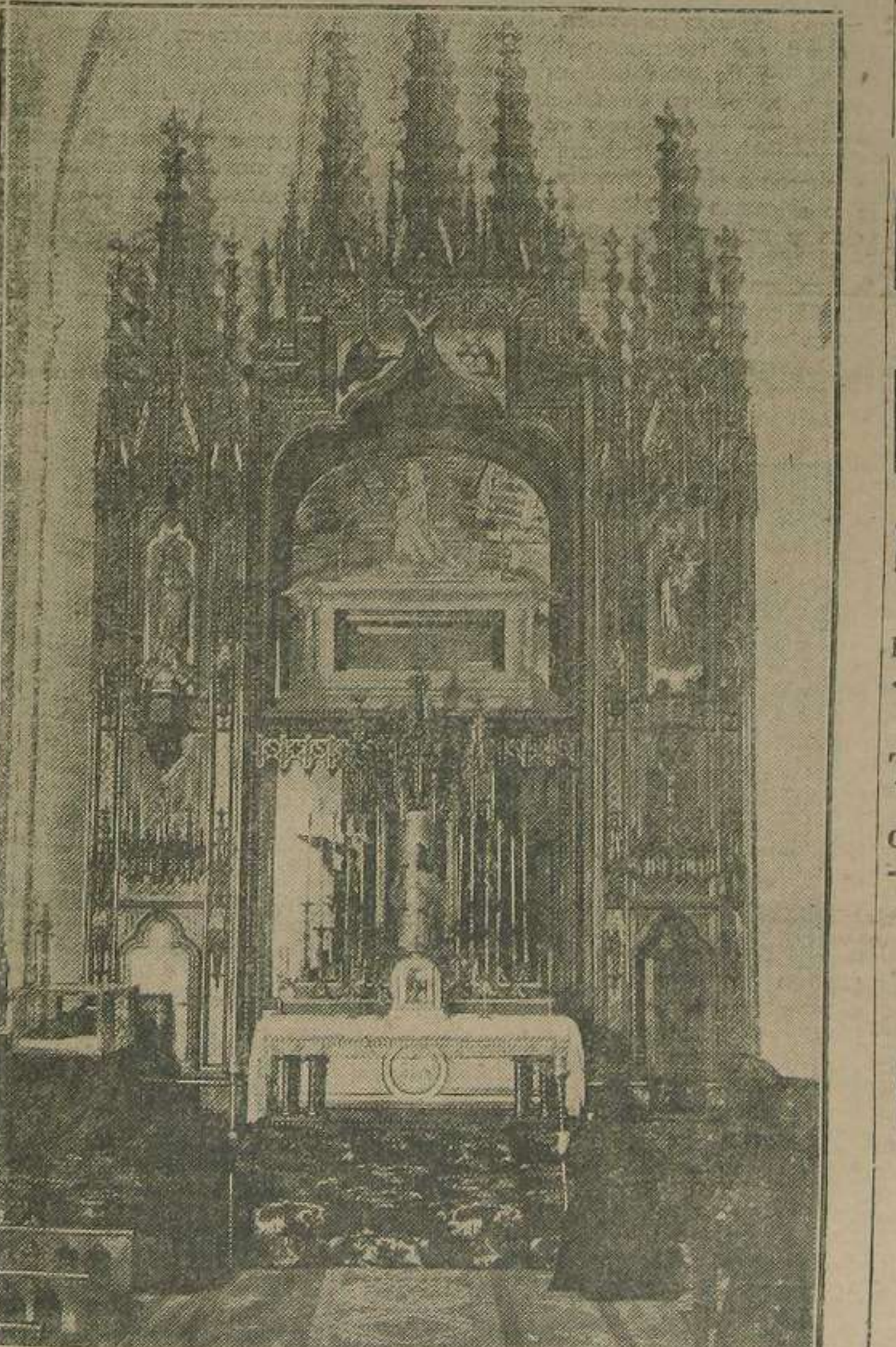
Altar mayor de la iglesia de las Adoratrices, en donde será colocado el cuerpo de la Beata Sacramento