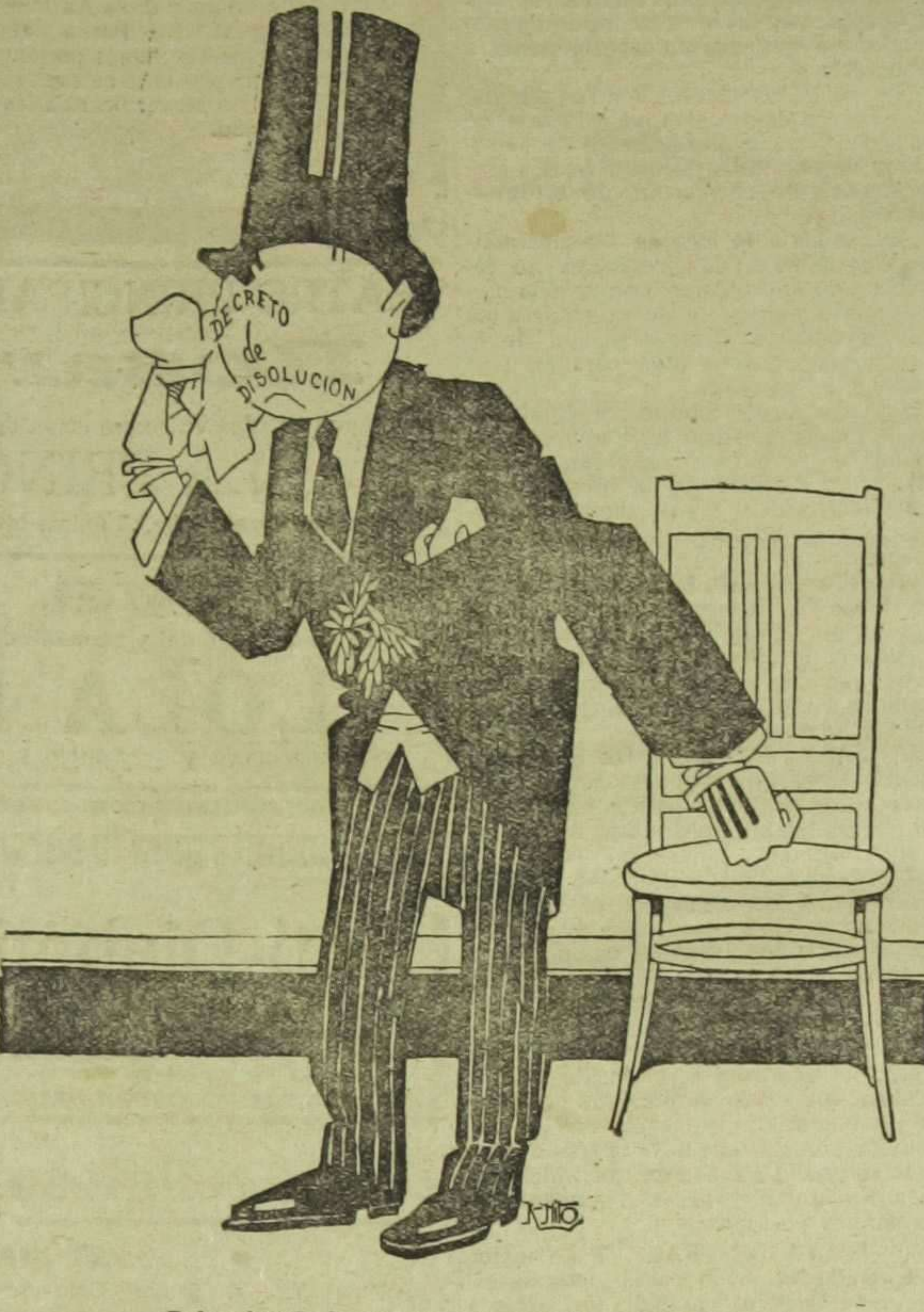
—¡Pobrecito! Se ha quedado compuesto... y sin "Gaceta".