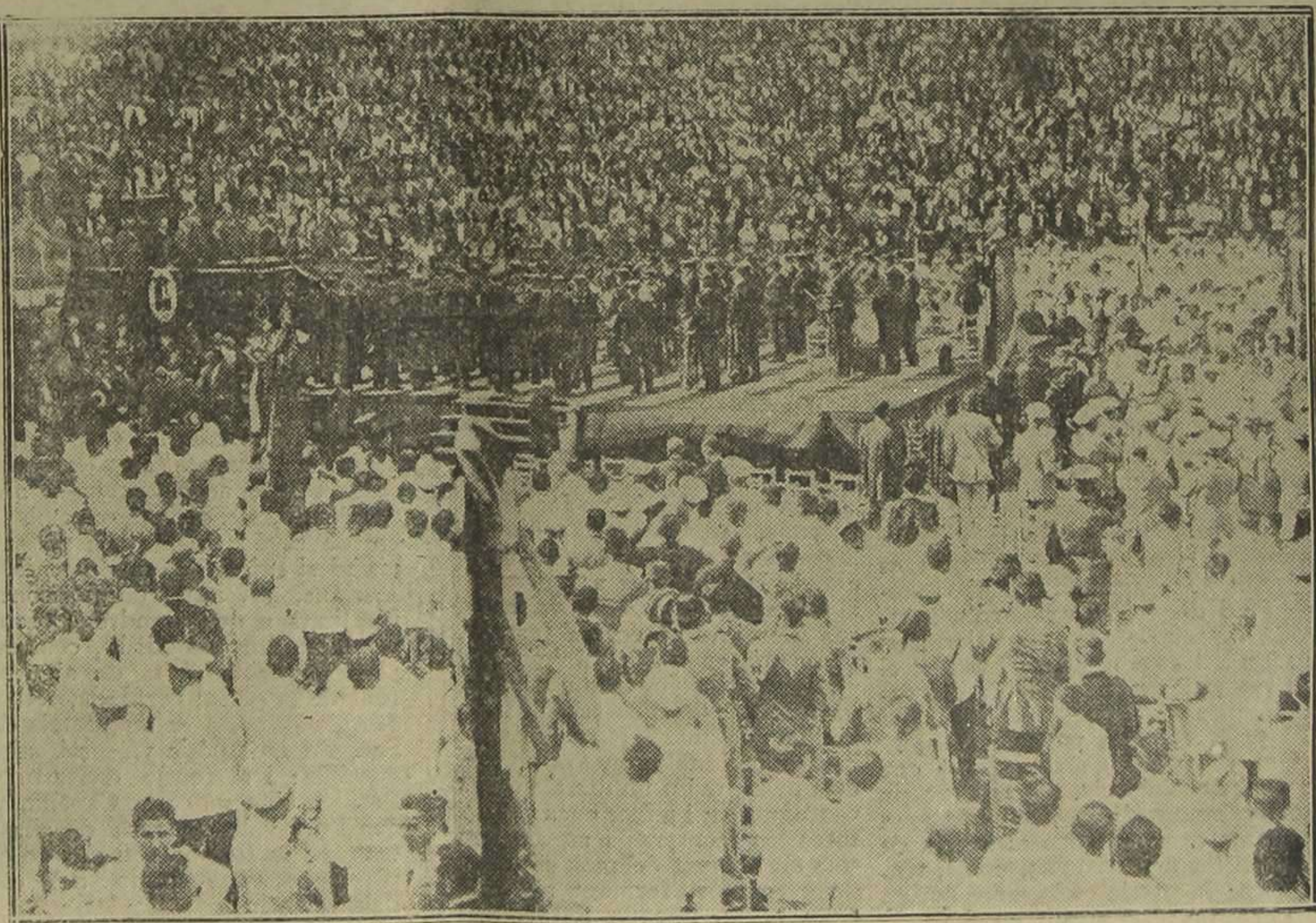
La banda de la Guardia Republicana sobre el tablado.

LOS MEJORES ALGODONES LAS BARRACAS Llop, 6 HULES, PUNTILLAS, BORDADOS, ARTICULOS FUNERARIA TINTE, BLANQUEO, MERCERIZADO