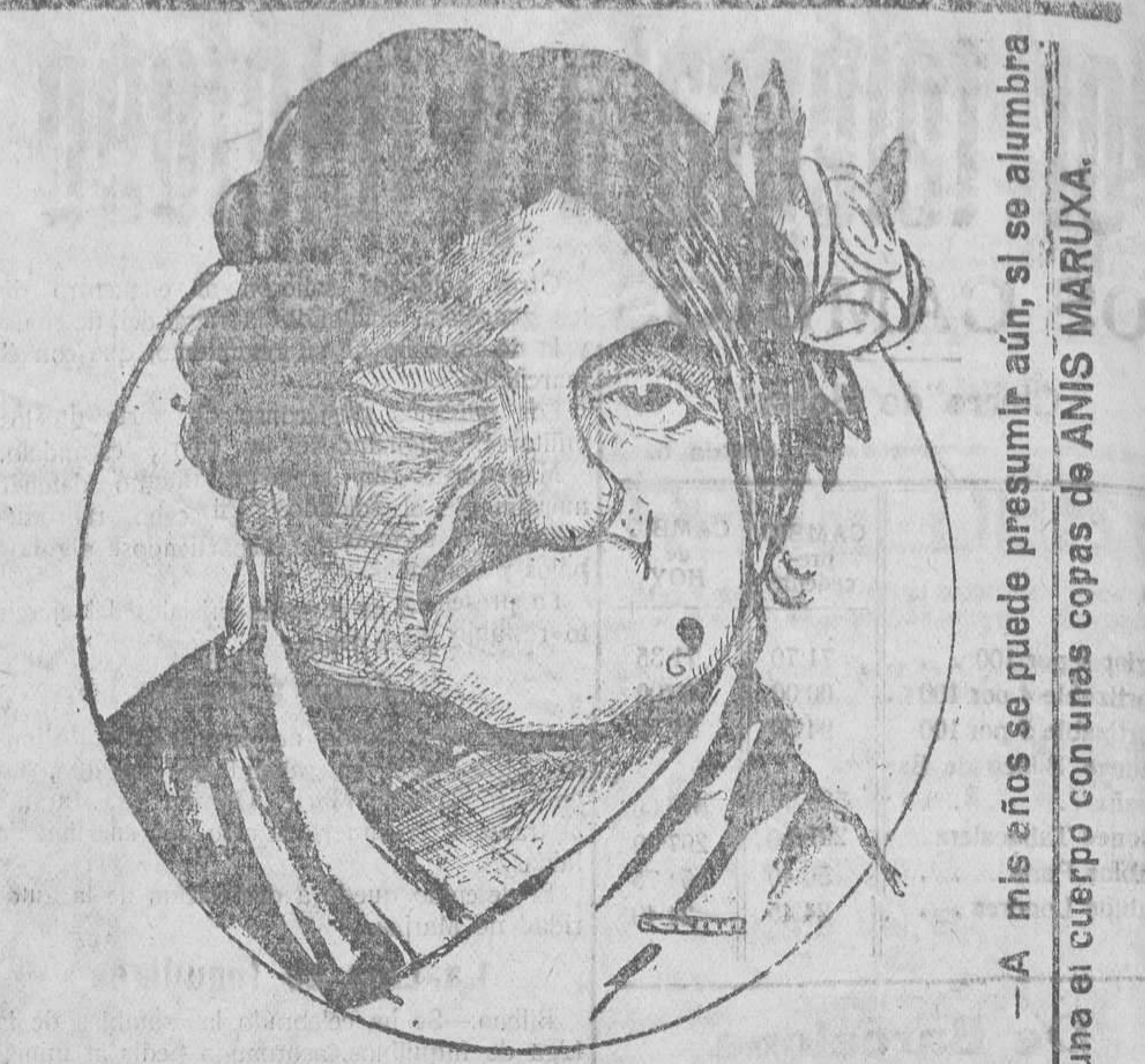
—A mis años se puede presumir aún, si se alumbra una el cuerpo con unas copas de ANIS MARUXA.

Informarán: Delegación de Valencia, Muelle de Poniente, letra E. Grao.—Teléfono 3.255