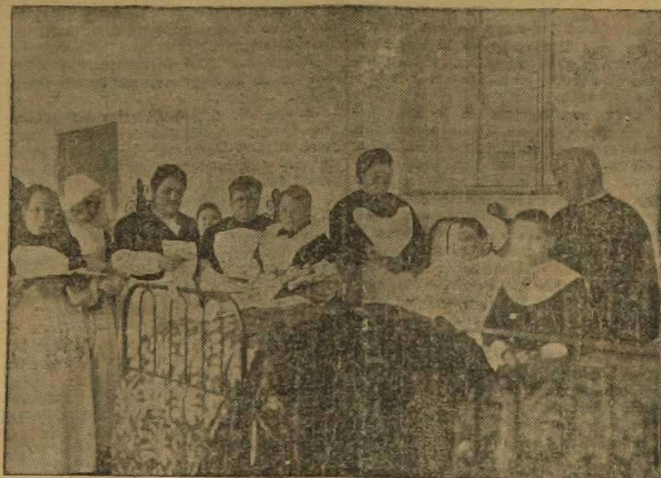
Las obras de misericordia visitar a los enfermos y consolar al triste, practicadas en el Hospital Provincial por caritativas damas.

Hace siete años se constituyó una Agrupación de señoras, con el caritativo fin de proporcionar consuelo a las desvalidas enfermas de nuestro Santo Hospital y desde entonces hasta la fecha, esas señoras no han dejado una sola semana de visitar a las pobrecitas, de cuyos labios sólo se ven bendiciones para sus bienhechoras. En las tristes horas de su enfermedad se ven entretenidas con la agradable conversación de las mencionadas señoras y escuchan los buenos consejos que éstas les dan. En esos ratos de grata compañía las enfermas no sienten padecimiento alguno, pues la visita es como un éxtasis paliativo, y aquellas caras tristes y demacradas por el dolor, parecen rejuvenecer al lado de las personas que de ellas se acuerdan y por ellas se sacrifican.