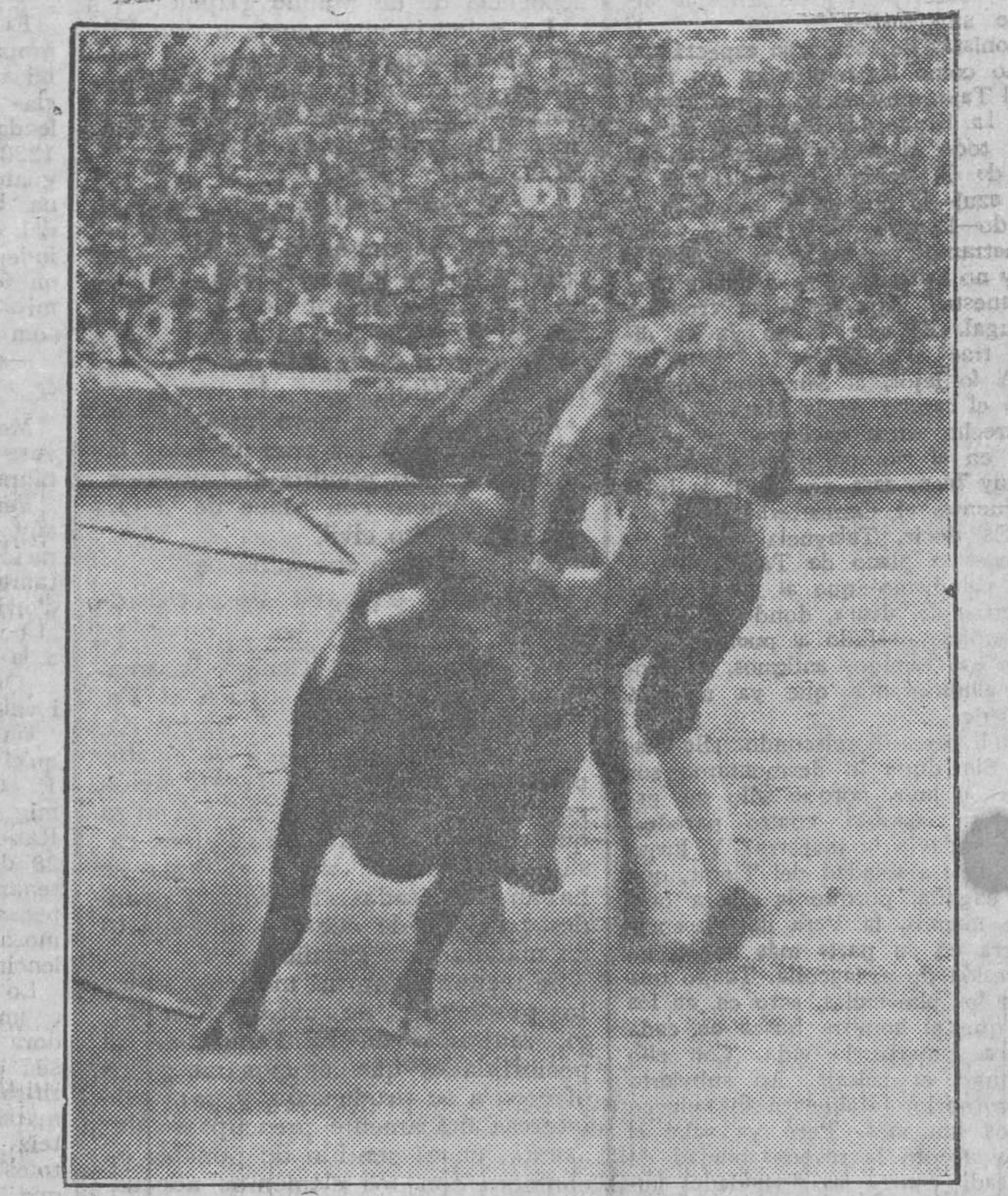
MOMENTO EN QUE EL TORO «ARRIERO», INFIRIÓ LA GRAVE HERIDA AL DIESTRO VALENCIANO