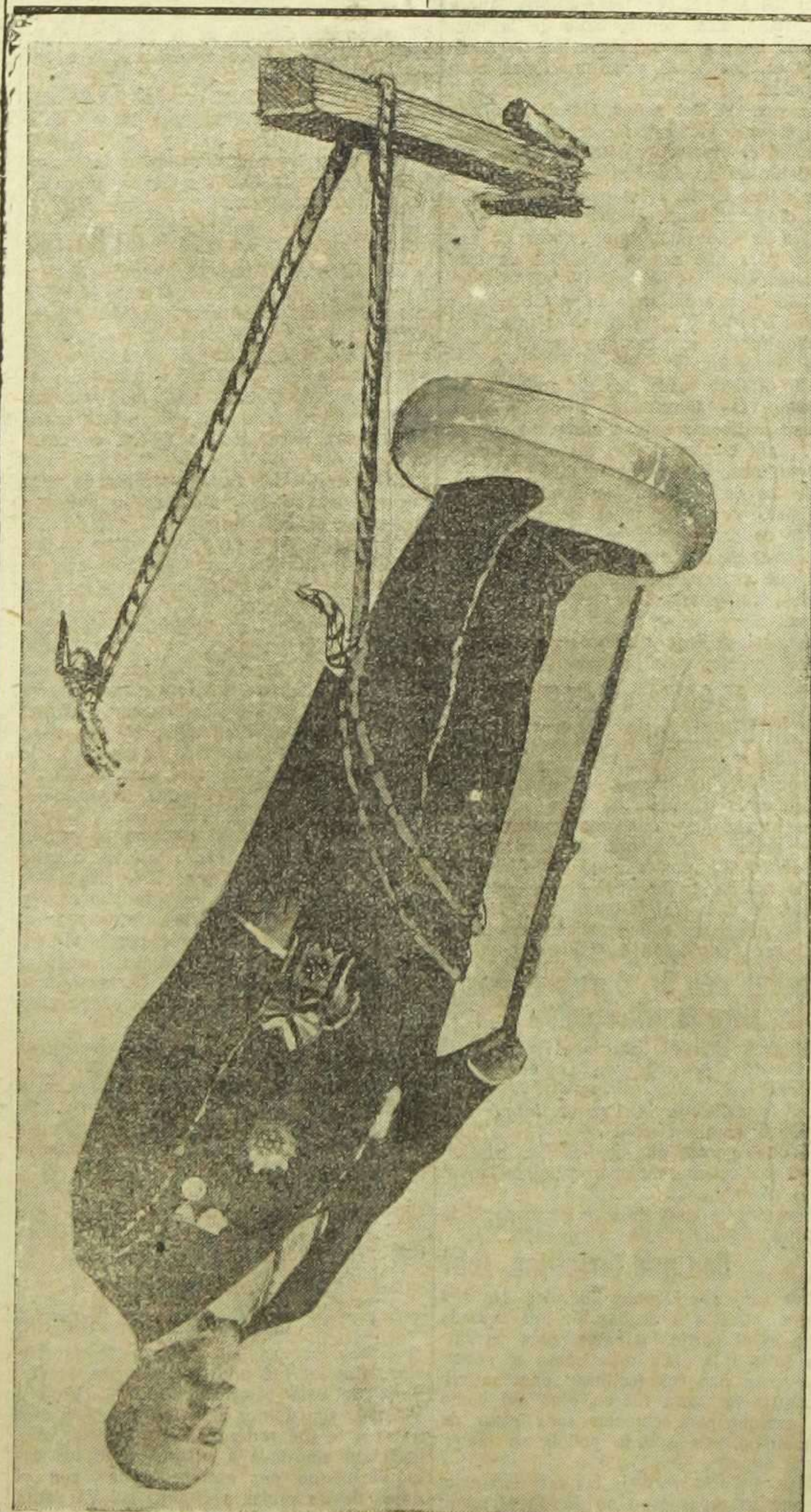
¡Ché, Gurrea, cóm t'han fet!