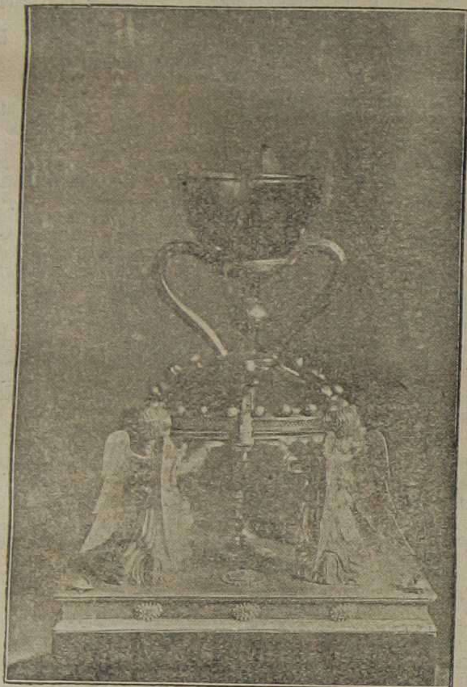
El Santo Cáliz, preciada y valiosa reliquia que tuvo en sus manos el Redentor en la noche de la Cena.

Relación escrita por el M. I. Sr. Dr. D. Elías Olmos Canalda, Canónigo Archivero del Excelentísimo Cabildo.