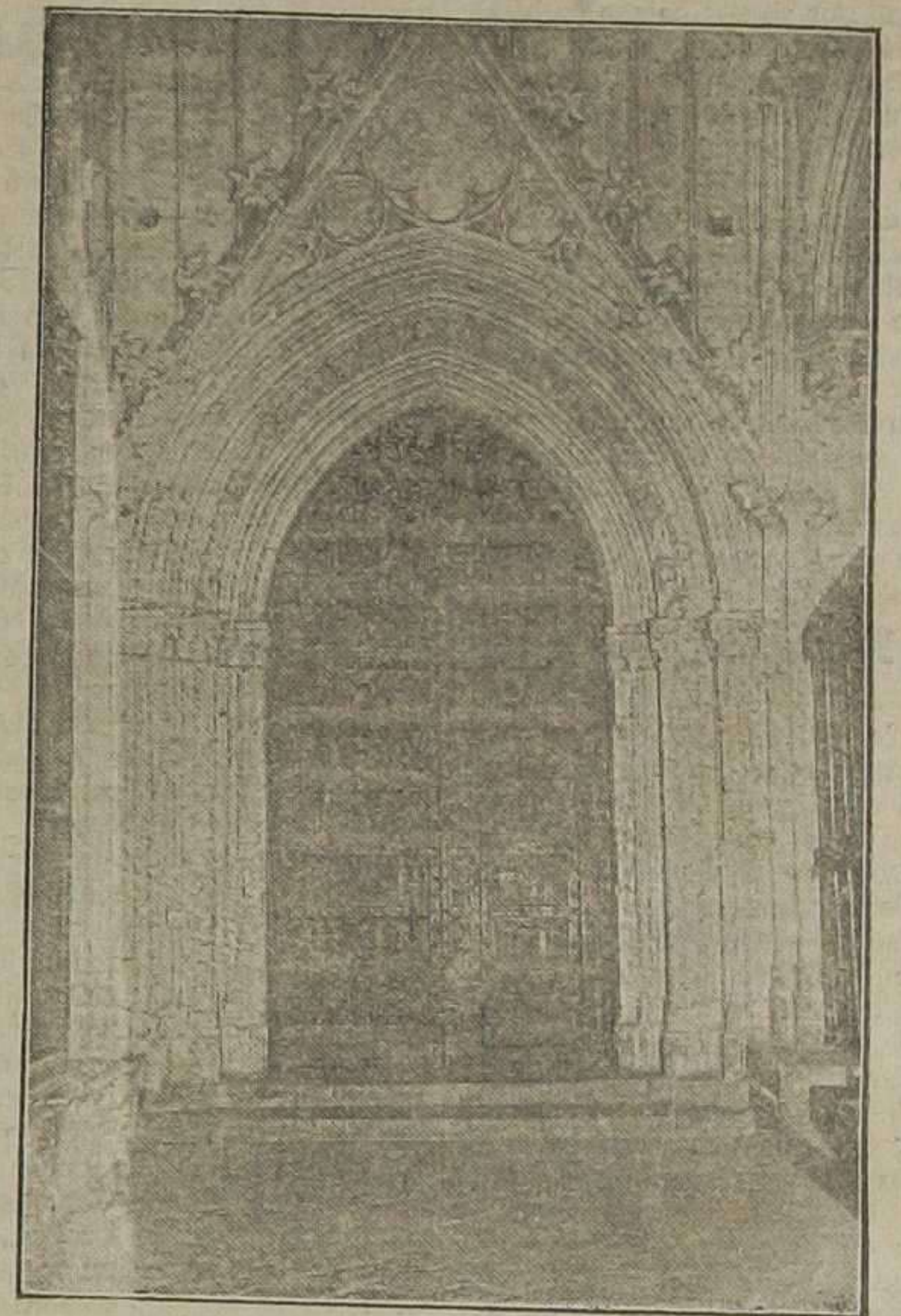
Hermosa y artística puerta de estilo gótico puro que da acceso a la esbelta y monumental Aula Capitular antigua.