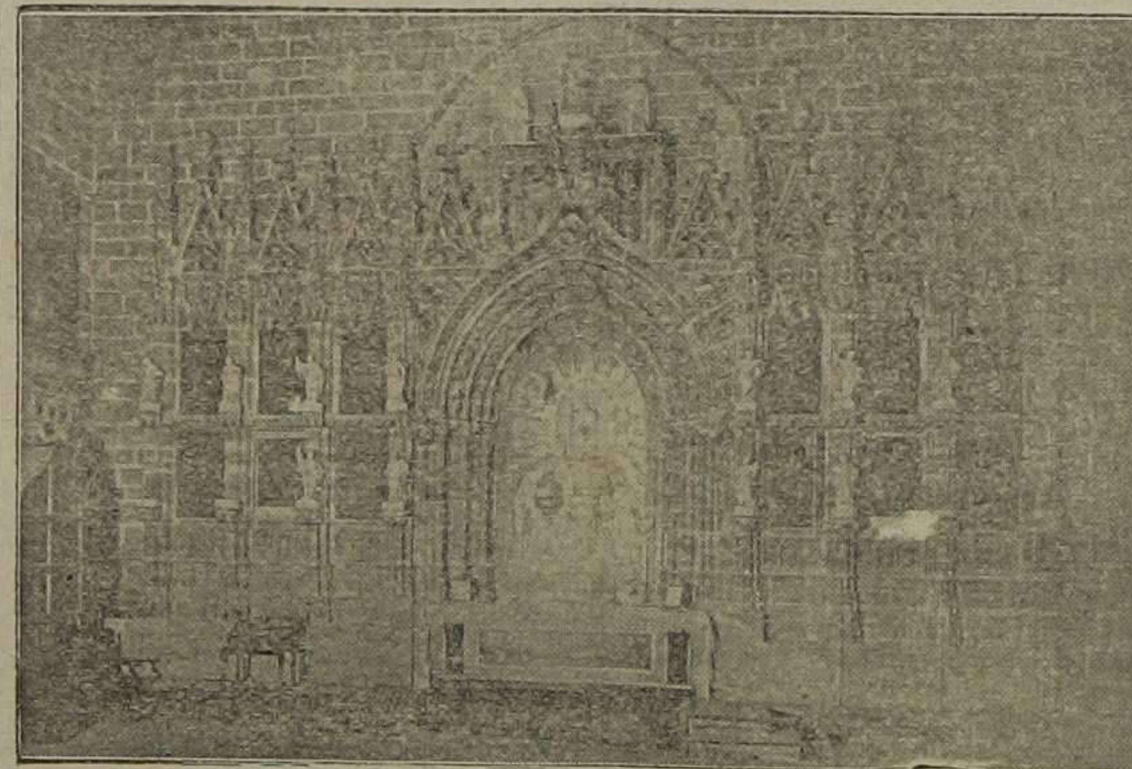
Riquísimo retablo de piedra, en cuyo centro se halla el nicho donde será colocado el Santo Cáliz.

(1) «Vida de San Lorenzo», tomo 1, página 101.