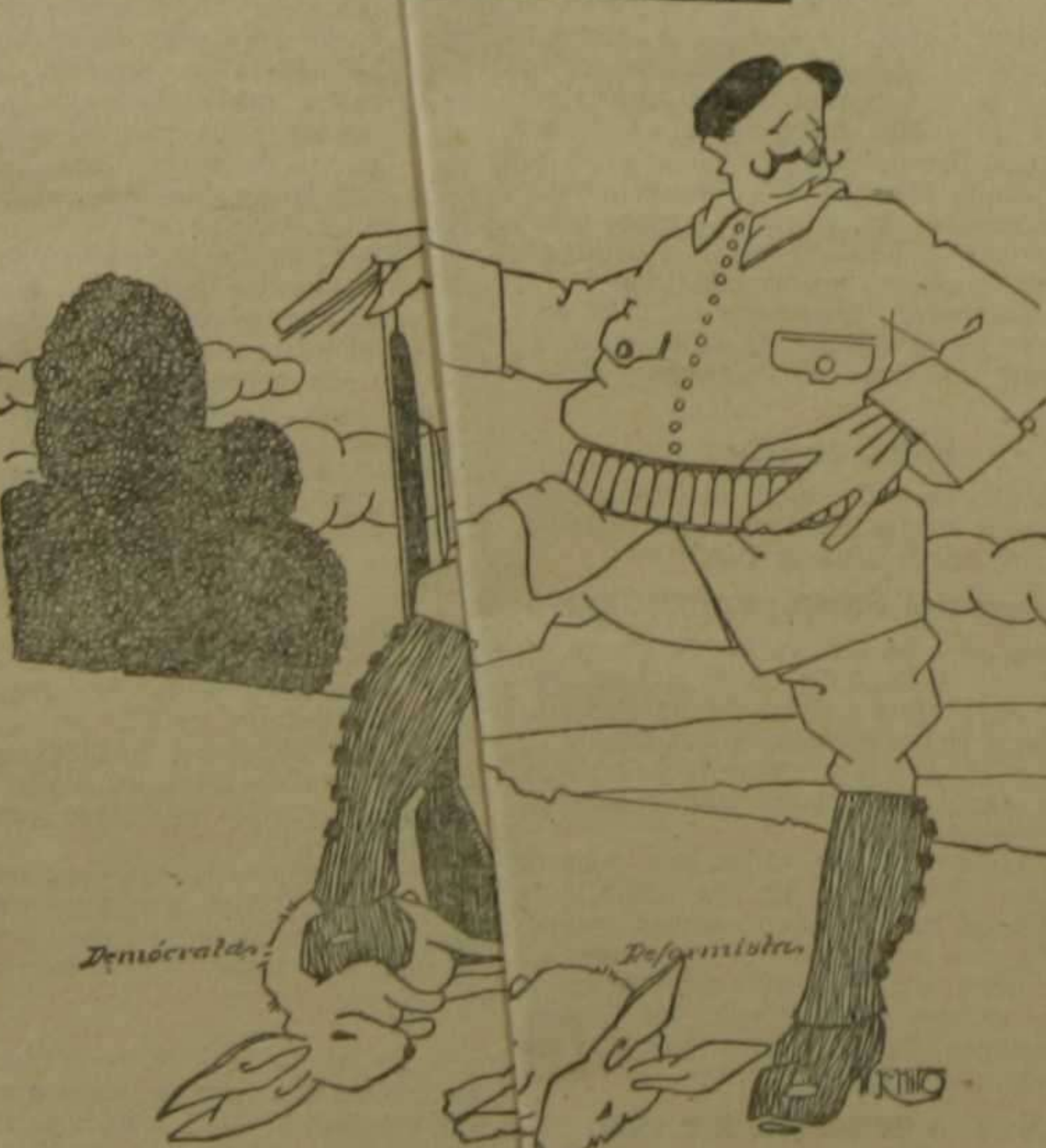
Las dos piezas cobrar el ilustre estadista.