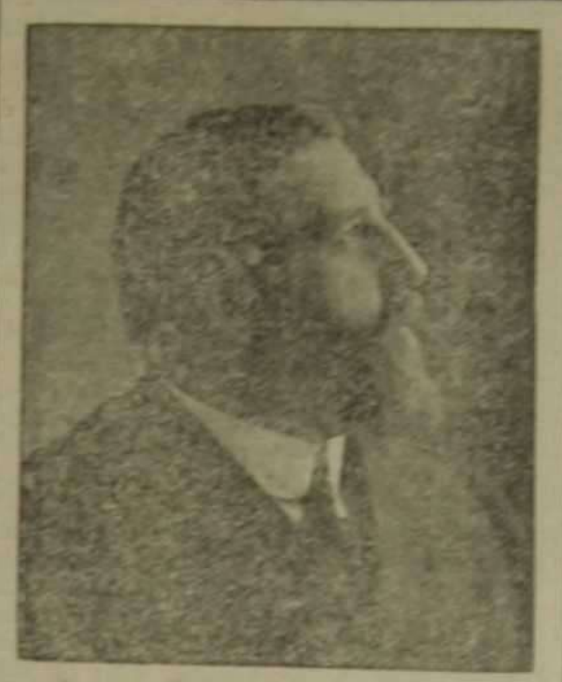
D. Leopoldo Cortina Porrás Nuevo gobernador civil de esta provincia

Añade por su cuenta El Debate que urge que las regiones se conozcan mutuamente, porque el día que esto ocurra y se unan todas, se acabará el efímero poder caciquil, fundado en el centralismo.