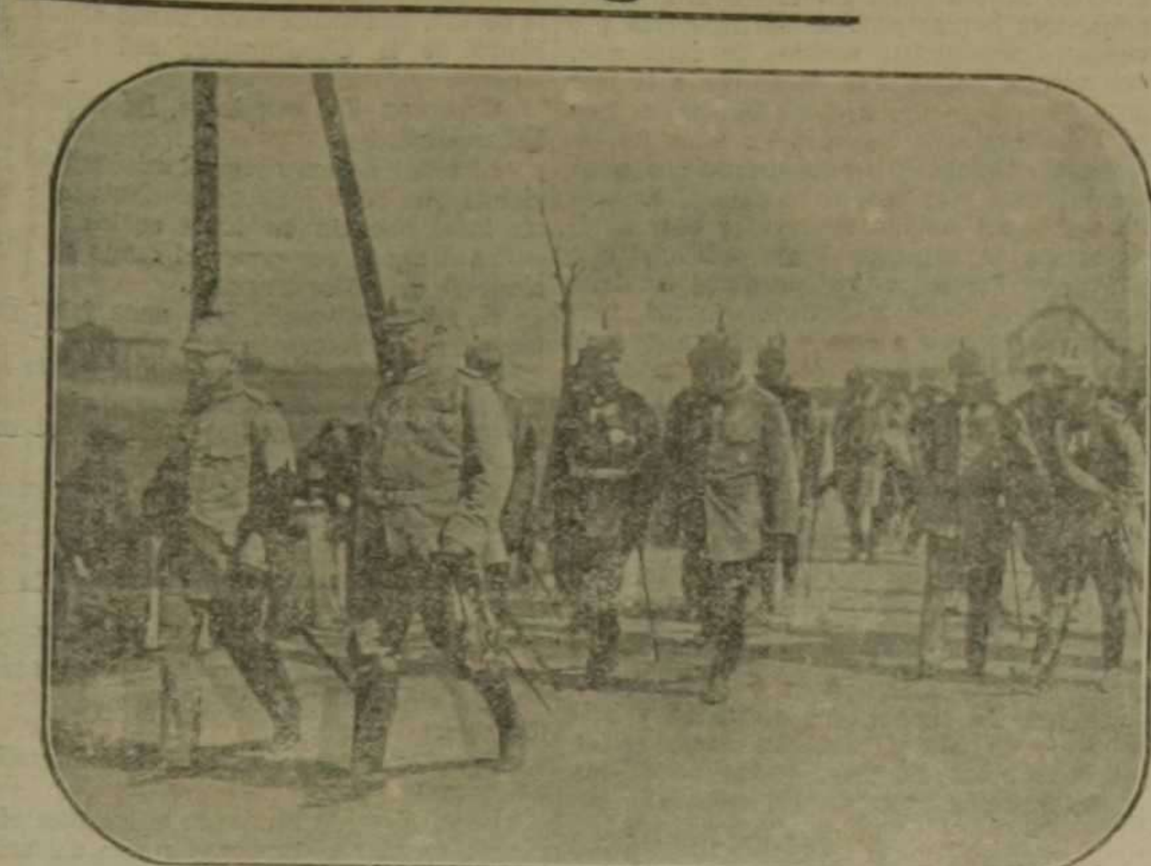
Visita del rey de Sajonia al teatro oriental de operaciones. A la izquierda, el rey de Sajonia; a la derecha, el general mariscal de campo von Hindenburg; detrás el general jefe de Estado Mayor, Ludendorff